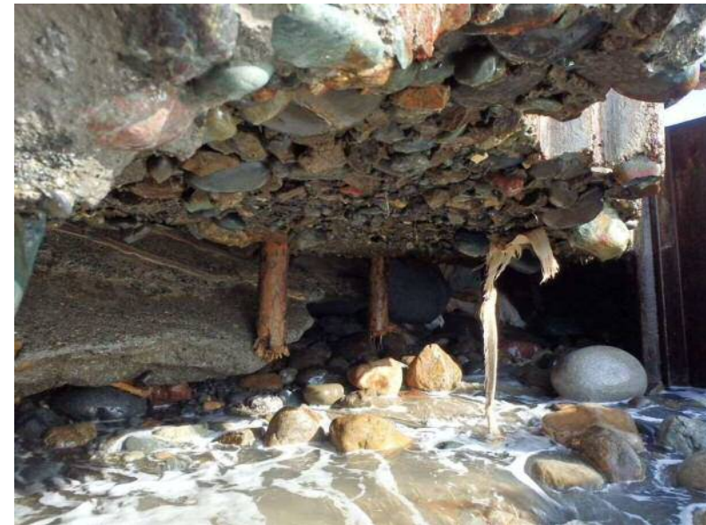
写真4 根固めコンクリート下部洗掘状況