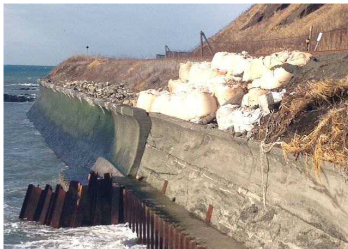
写真3 緊急措置 (大型土のう) 状況