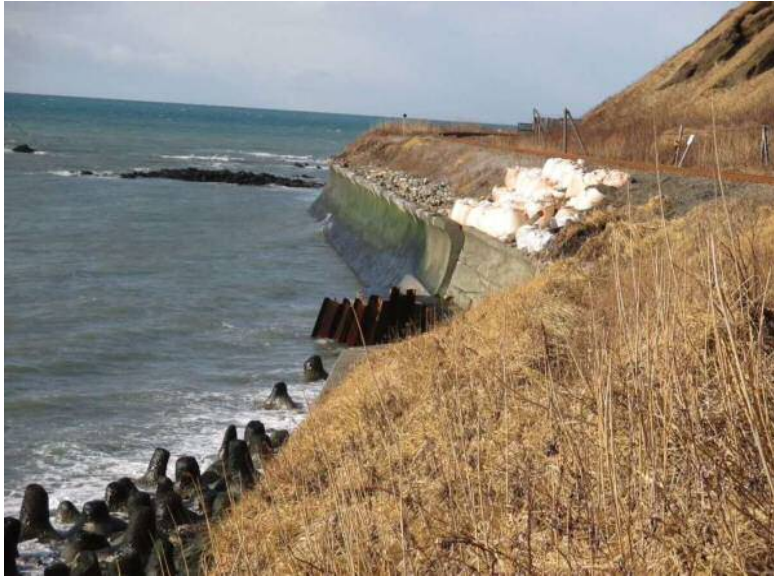
写真1 全景(終点・様似方から)