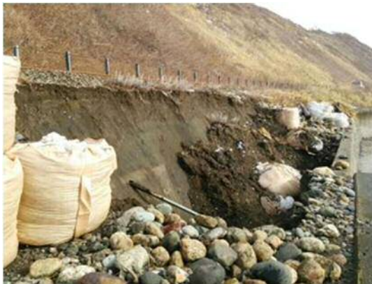
写真 1 盛土流出状況