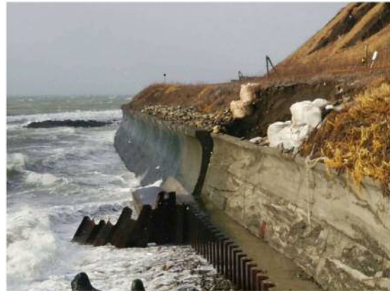
写真 2 護岸根固め工損壊状況