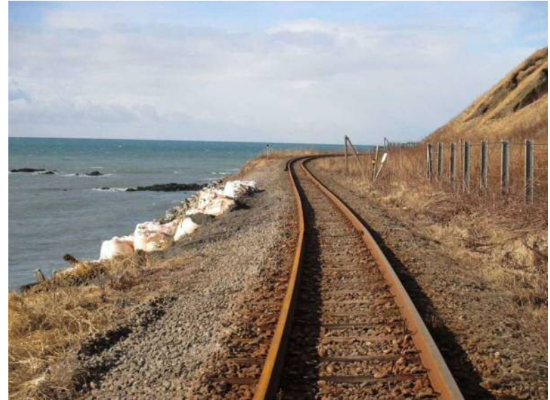
写真2 全景(終点・様似方から)