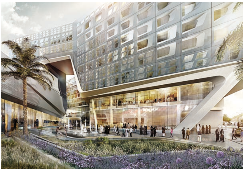
De los 61 hoteles de Meliá en proyecto, 28 se ubican en Europa, Oriente Medio y África, entre ellos el ME Doha, cuya apertura está prevista para 2017.

Si el pasado año el Ranking HOSTELTUR de cadenas hoteleras con más de 1.000 habitaciones reflejaba la apuesta de los grandes grupos por la desafiliación para seguir creciendo, en esta edición se constata que el momento de consolidar ese crecimiento ha llegado, especialmente en el ámbito internacional.