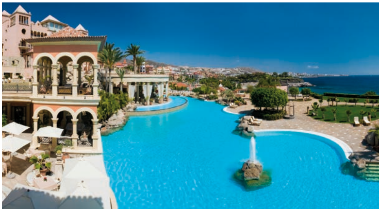
Iberostar se convierte en la tercera cadena española por ingresos tras aumentarlos un 29%. En la imagen el Iberostar Grand Hotel Mirador.

veces viene definido por el tamaño de la empresa. Y es que, en líneas generales, mientras los grandes grupos optan por crecer fuera de España, entrando en muchos casos en nuevos destinos, los de menor tamaño prefieren reforzar sus posiciones en territorio nacional.