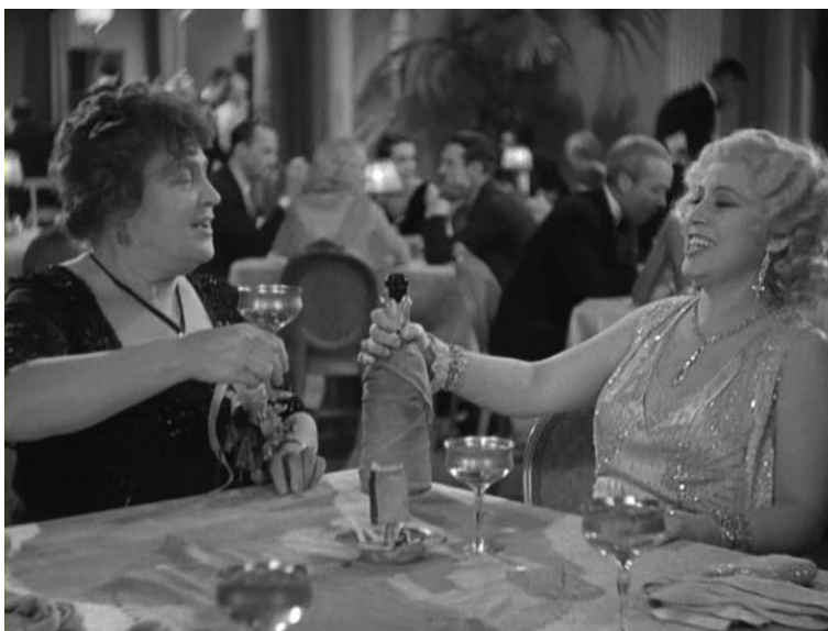
[FIGURA 1] Maudie y Miss Jellyman brindando

ex-boxeador que intenta redimirse está tomando clases de comportamiento social con la solterona Miss Mabel Jellyman (una mujer colocada en el estereotipo de la solterona institutriz interpretada por Alison Skipworth). En la primera escena, están cenando el ex-boxeador, Miss Jerry Healy (la heroína de la película) y Miss Jellyman, cuando llega Maudie, una amiga “de la noche” del ex-boxeador. Lo primero que ocurre es que Maudie emborracha a Miss Jellyman, que termina hablando de amor “a primera vista”, sin que quede claro si se refiere a su alumno, el ex-boxeador, o la recién llegada (y escandalosa, entra en escena a los gritos) Maudie. Miss Jellyman y Maudie quedan solas cuando la pareja protagónica se retira, bebiendo y con Miss Jellyman hablando de deshacer sus inhibiciones y su vida de 27 años de tristeza .