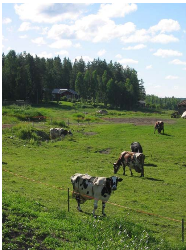
Tuomiperä kesällä 2003, Marika Ävist