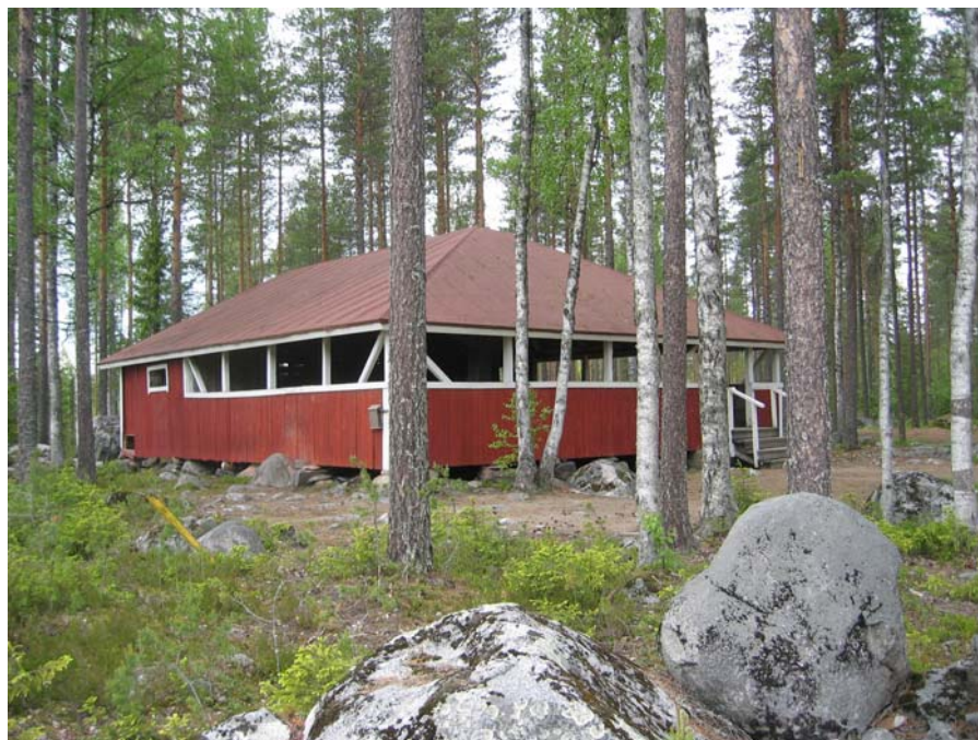
Niinikankaan lava 50v toukokuu 2003 (suojelukohde)

15.10.2003 Kalakankaan kyläyhdistys Kylävalakiat hanke Kyläenergialla Nokka Nousun hanke