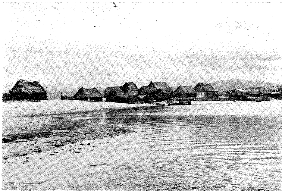
Aspecto actual del poblado de Barra de Navidad, Jalisco.