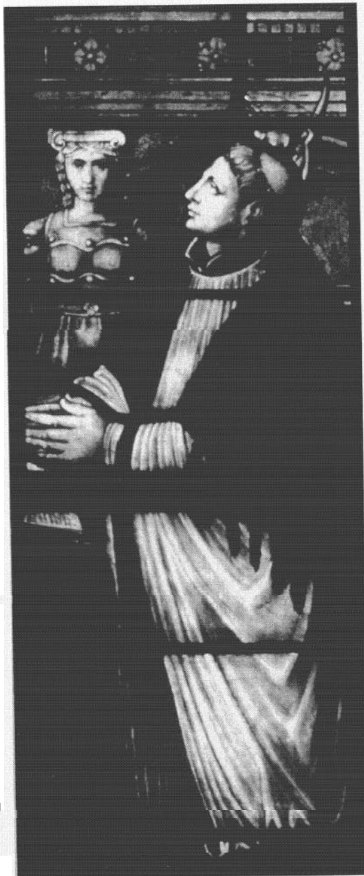
Een van de priors van het Margarethaconvent. Robert Jansz., schonk tussen 1556 en 1559 een gebrandschilderd Glas aan het Regulierenconvent aan de Raam. Zó is zijn vortrebewaard gebleven en te zien in de Van der Vormkapel achter de St.-Janskerk (Glas 62). Fonds Goudse Glazen.

Over het dagelijks leven in het Margaretha-klooster is niets bekend. Uit andere bronnen kan men er zich wel een voorstelling van maken. De minimumleeftijd waarop een meisje in het klooster mocht treden, was 13 jaar; om geprofest te worden moest zij de leeftijd van 15 jaar hebben bereikt. Hoewel er aanvankelijk geen weelde heerste, nam het kloosterbezit door schenkingen en legaten voortdurend toe.