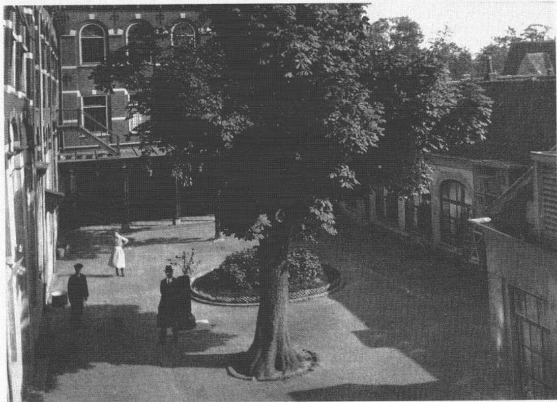
Tweemaal het sfeervolle plein in de tijd dat het complex aan de Spieringstraat onderdak bood aan vele wezen (ca. 1910).