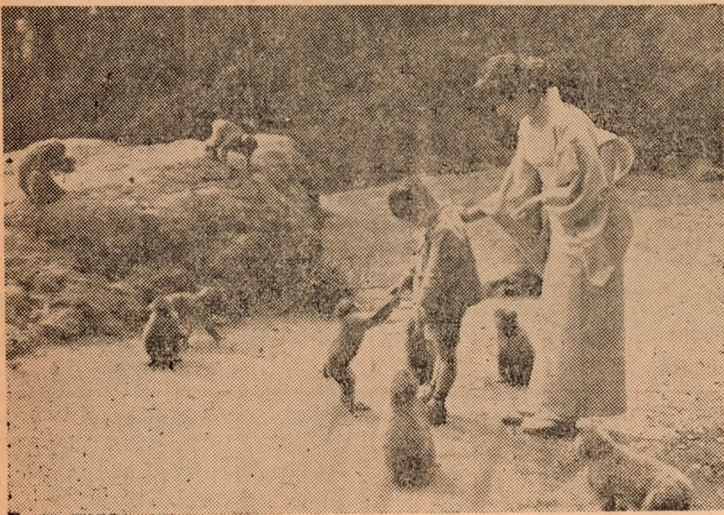
猿を愛する人たち