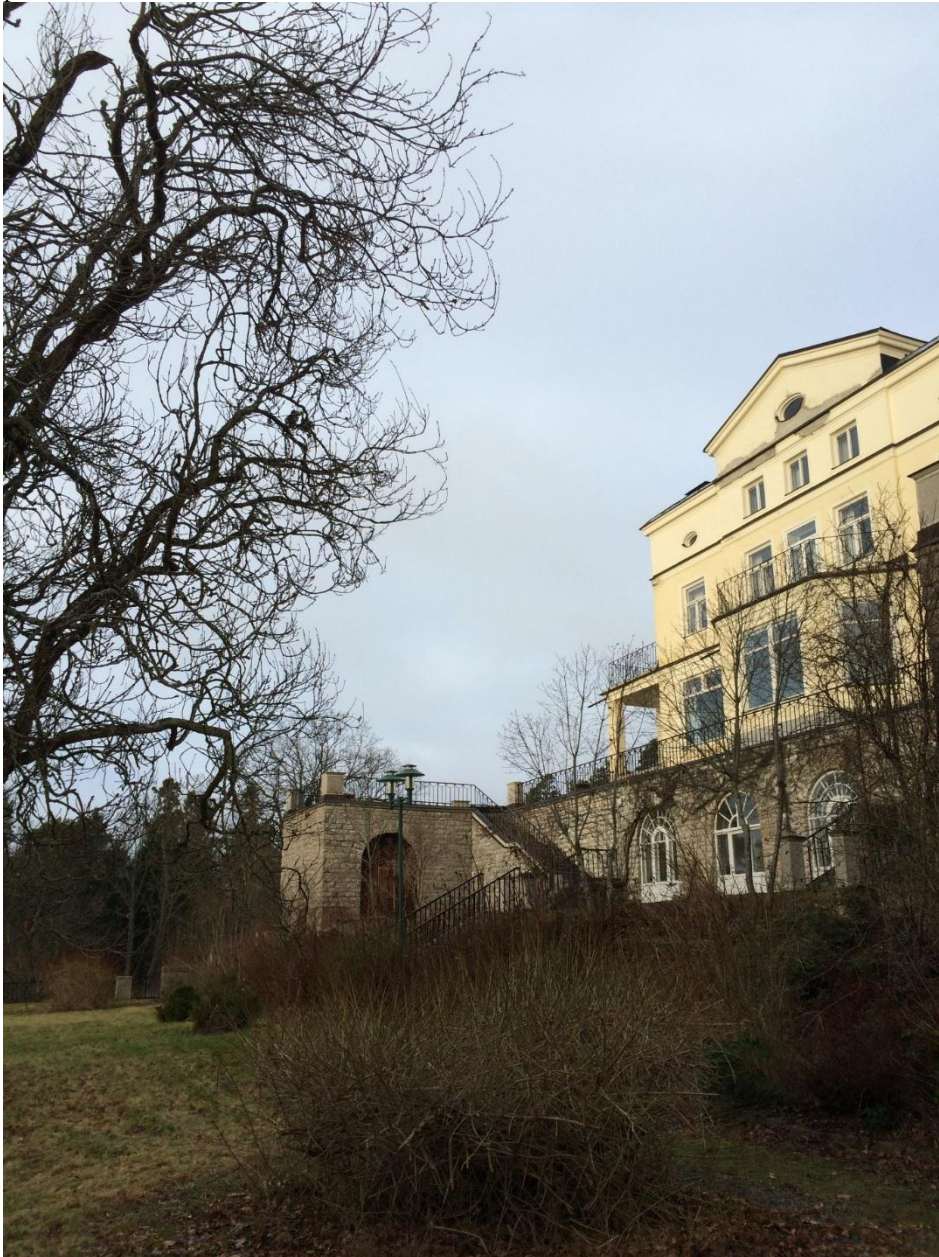
Sommarvillan i Granninge. Fasad och terrass från söder.