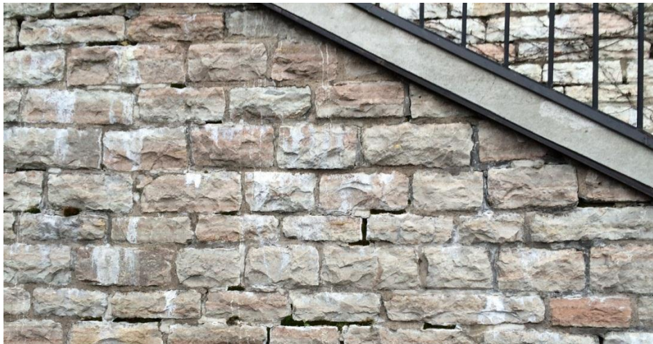
Detalj av terrassens grovbuggna kalkstenar.