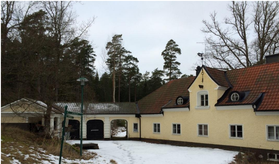
Stallen från nordost.