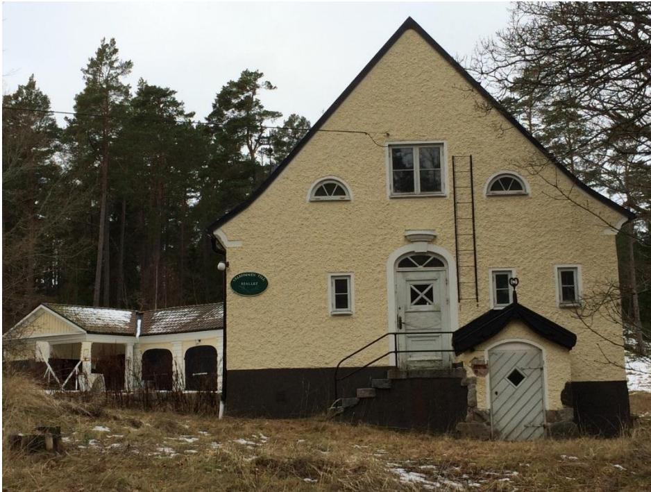
Stallet från öster med profilerad takfot och lätt svängt sadeltak.