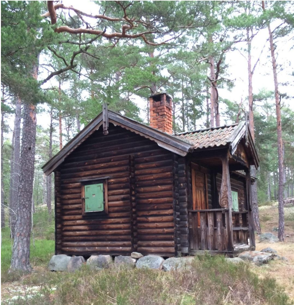
Den nationalromantiska lekstugan inramas av tallskog. Kontursågade vindskivor och dekorativa fönsterluckor är några av de delar som bidrar till karaktären.

Lekstugan på Graninge uppfördes år 1916 i tydligt nationalromantisk stil. Byggnaden är uppförd av timmer med en förstukvist som dekorerats med utsnidade, blyspröjsade fönster med fönsterluckor liksom historiserande beslag. Invändigt finns ett välbevarat kök med väggfasta skåp bemålade med allmogeinspirerat måleri. I köket finns även spishäll och järnspis (denna har dock försvunnit vid ett senare tillfälle). I lekstugan finns därtill ett rum med en väl genomtänkt interiör. Taket är bemålats med samma typ av allmogeinspirerat måleri som köksluckorna. Samma måleri återfinns även i stugans möblemang.