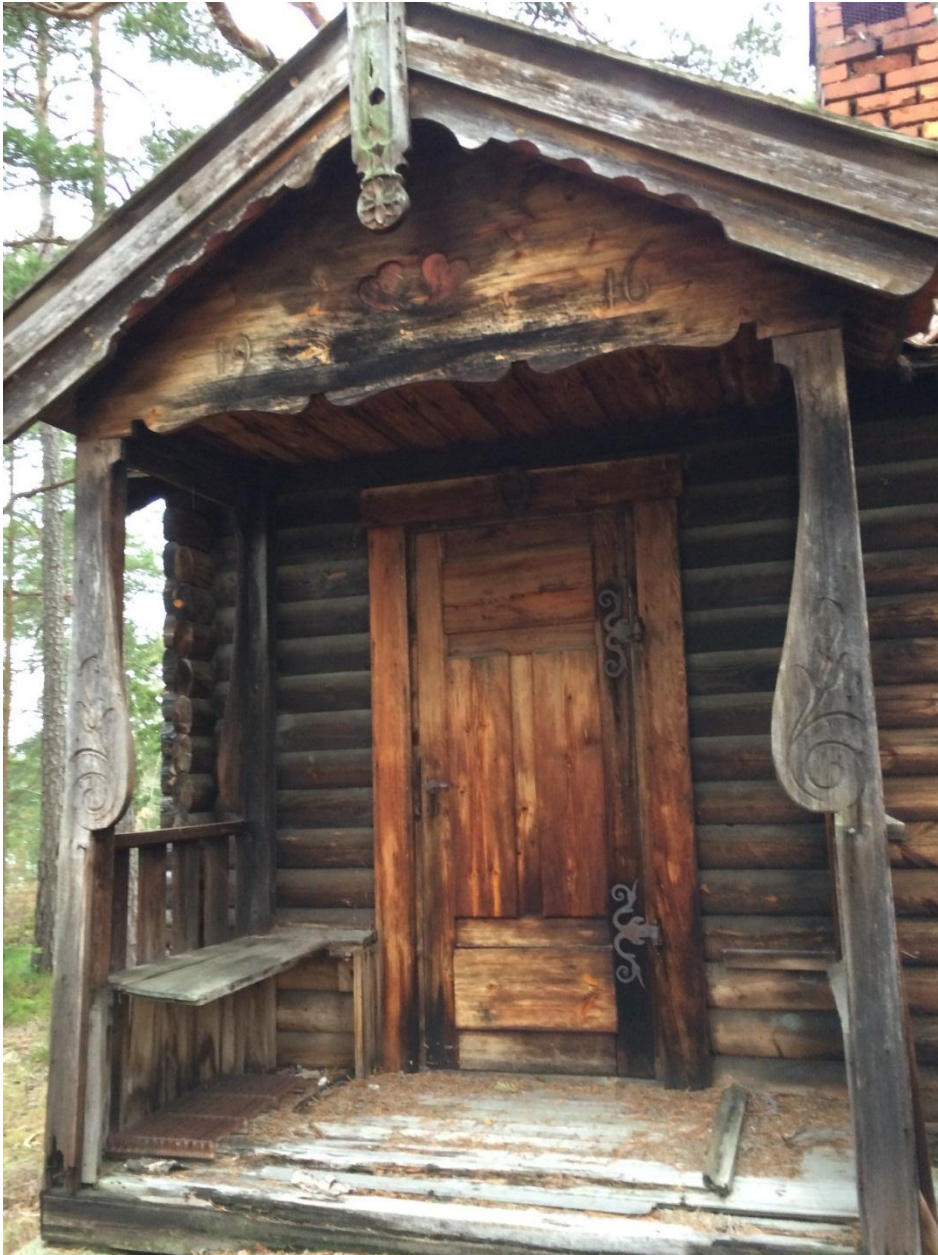
Verandan är försedd med riket utskuren dekor som tidigare varit målat i bl.a. grön och röd kulör.