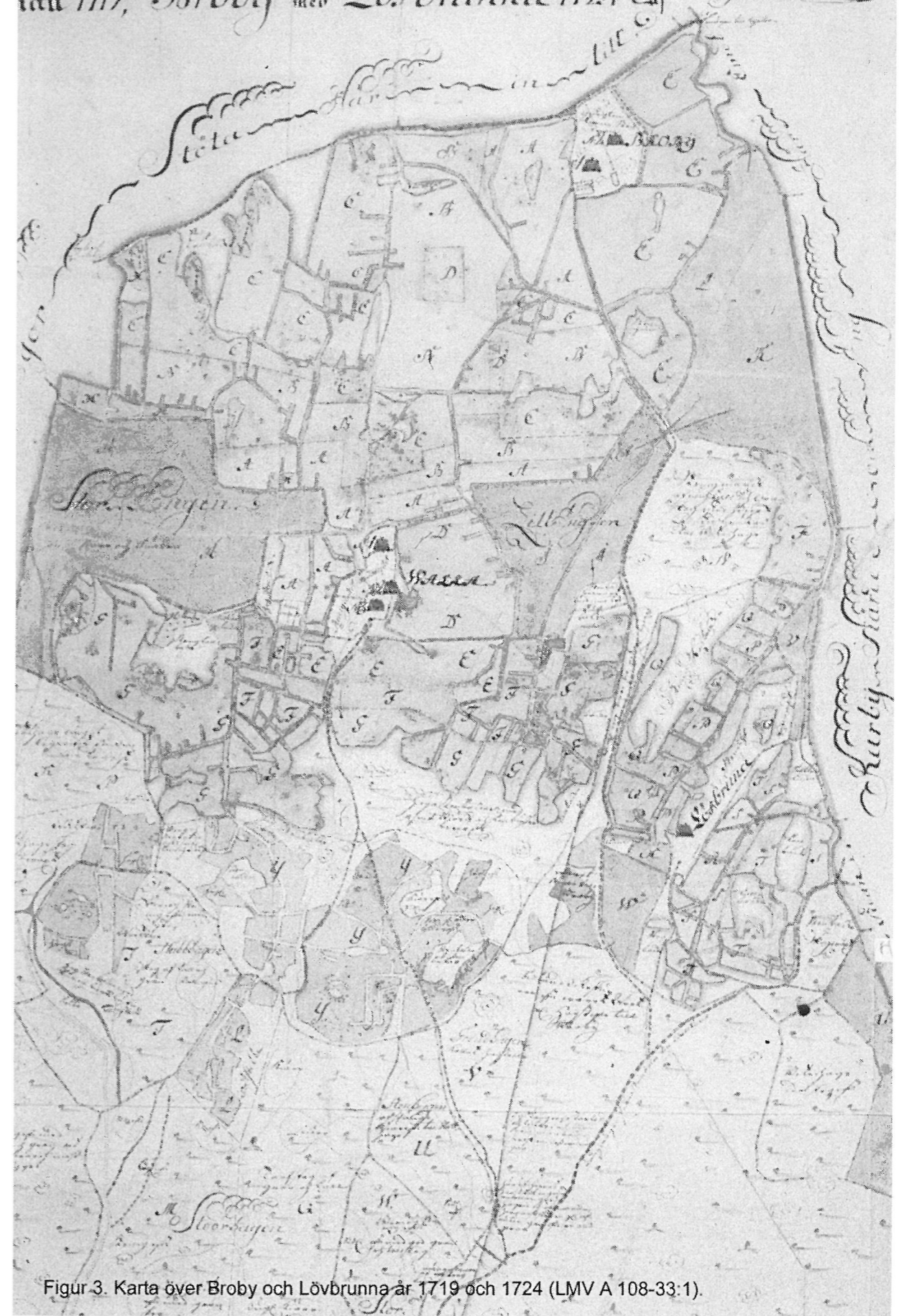
Figur 3. Karta över Broby och Löfbrinna år 1719 och 1724 (LMV A 108-33:1).

Holms Lahn, Danderi Skiepslag, Tåbi år 1719, Broby med Löfbrinna 1724 af Jacob Braun