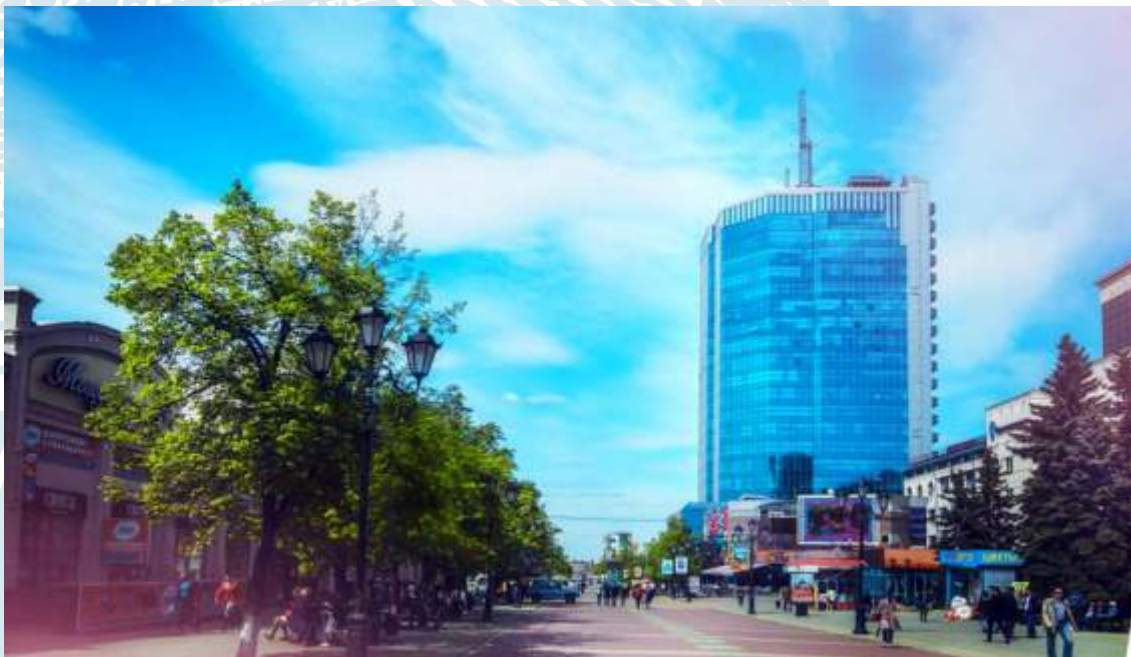
Вид с ул. Кирова на АКЦ «Челябинск-СИТИ»

Встречи, переговоры, пресс-конференции, семинары, работа в офисе, бизнес-ланчи, фитнес, ужины, шопинг, досуг — все из чего складывается жизнь делового человека представлено в АКЦ «Челябинск-СИТИ».