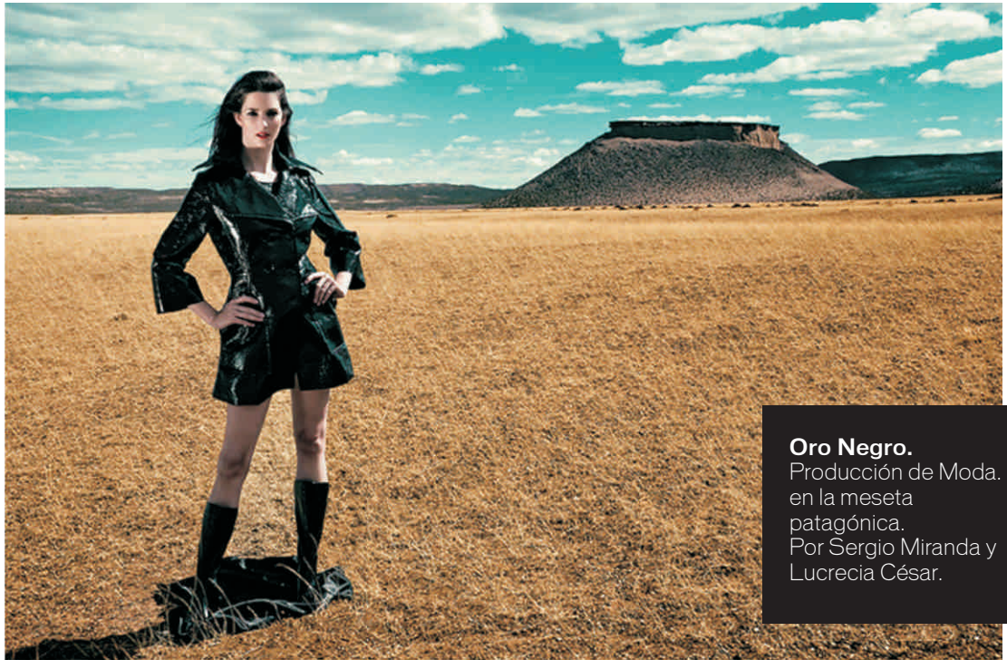
Oro Negro. Producción de Moda. en la meseta patagónica. Por Sergio Miranda y Lucrecia César.

A través de un diálogo plural, Noche Polar desarrolla paralelamente nuevos canales de comunicación con el fin de extender la capacidad interactiva de los “productos polares”. En la actualidad, el Grupo se encuentra desarrollando una comunidad en las redes sociales y su portal web (nochepolar.com) además de realizar todos los meses diferentes acciones de promoción, organización de eventos y patrocinio de actividades culturales.