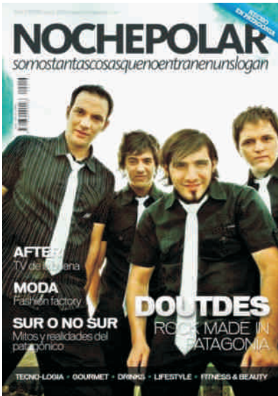
DOUTDES ROCK ENERO