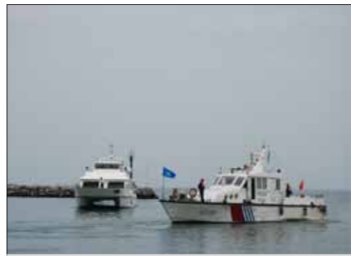
“五一”期间，广东辖区水上出行秩序良好