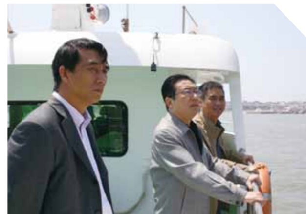
视察莆田海事局湄洲岛海事处。

此次学习考察是我局开展“科学发展当先锋”主题实践活动的一项重要内容，对全局的主题实践活动必将起到有力的促进作用。