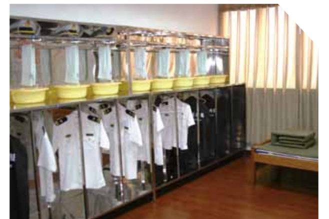
重庆海事局半军事化管理一幕——整洁的内务。