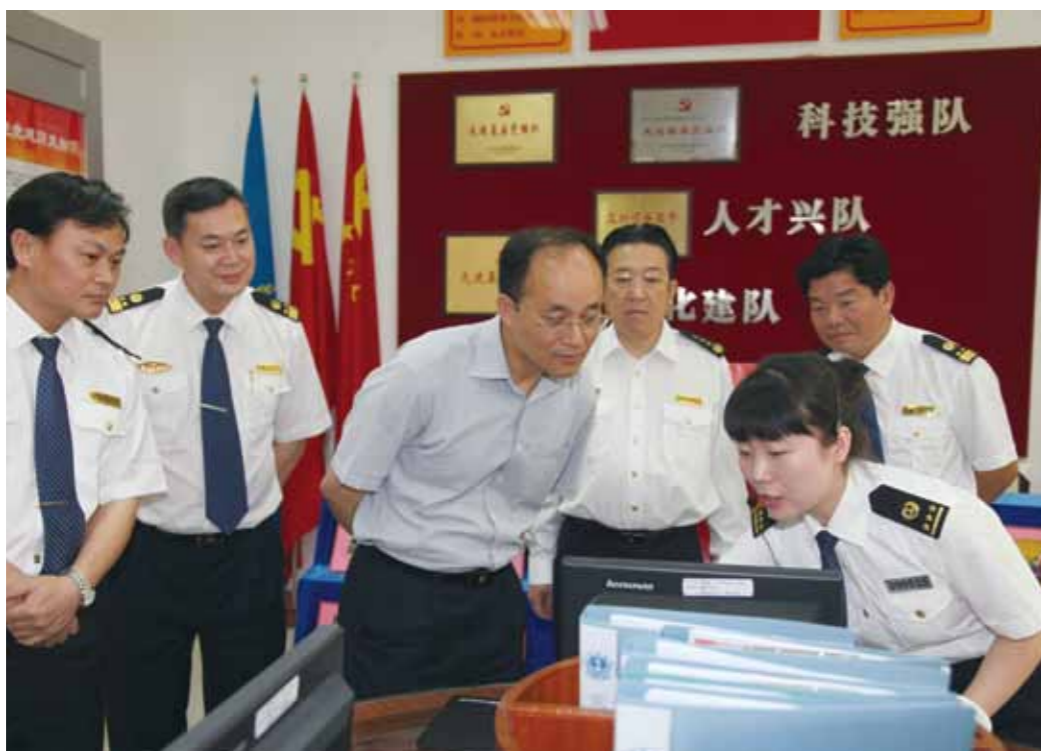
▶ 5月5日，交通运输部海事局党组书记许如清在广东海事局党组书记刘恒伟的陪同下，莅临珠海高栏海巡基地视察巡查执法支队党建工作，寄语广东海事要以“四个继续”深入推进创先争优活动。