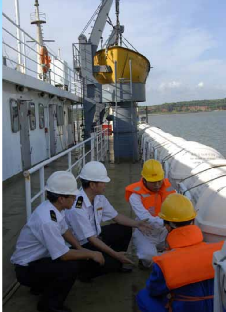
加强对琼州海峡客滚船现场监管。