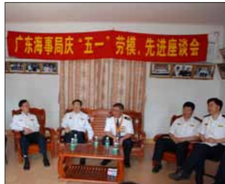
局工会召开“五一”劳模、先进座谈会