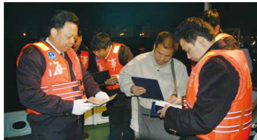
海事人员进行现场监管。

肇庆港口海事处在开展创先争优活动中，公开作出“保障平安、有求必应、杜绝腐败”的承诺，充分发挥基层党组织的战斗堡垒作用和共产党员的先锋模范作用，以促进社会和谐作为活动的主线，在实践中推动科学发展、促进社会和谐、服务人民群众，努力使党支部成为辖区和谐之基。