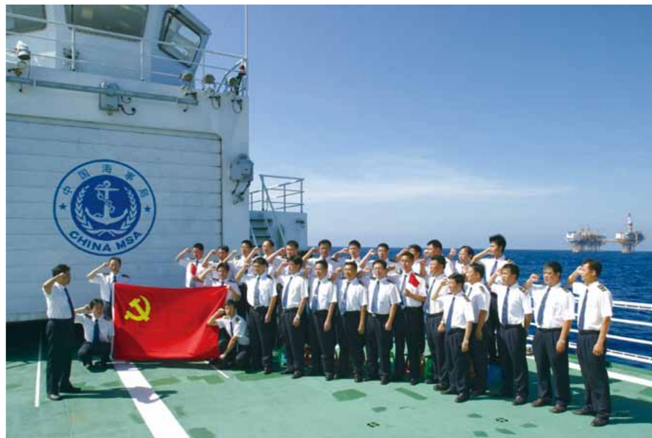
“海巡31”全体船员重温庄严的入党誓词。

“海巡31”党支部组织船上人员参观了西沙海洋博物馆，让大家重温历史，铭记海洋权益维护的成果来之不易。在南沙永暑礁，大家亲切地和驻岛官兵交谈、合影、留念，