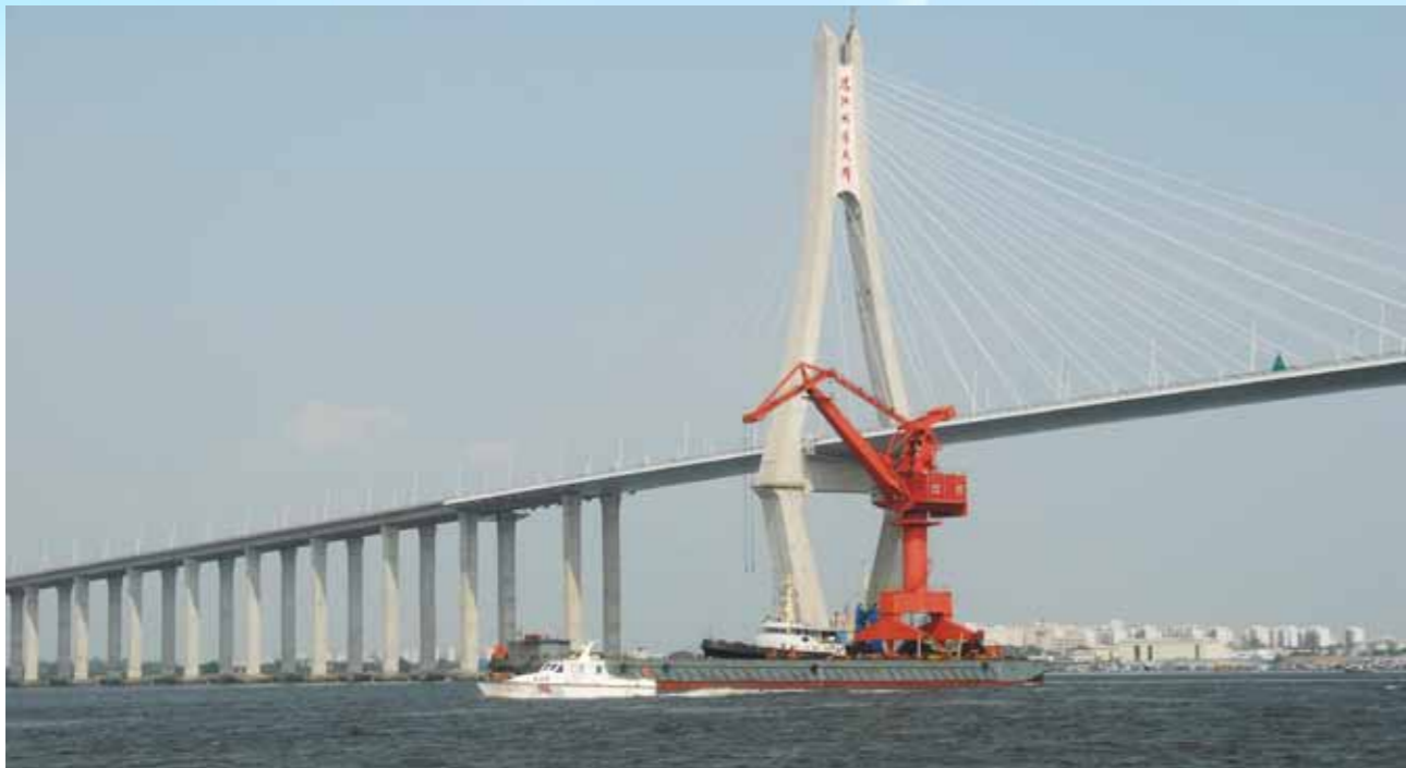
为施工船舶清道护航。

吞吐量年均以两位数增长的情况下，湛江海事局抓规律、保安全，努力践行卓越服务的理念。