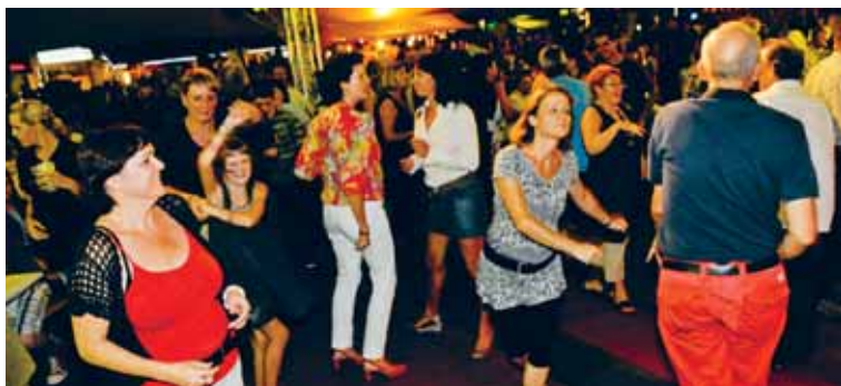
Die Unterhaltung mit Tanzvergnügen breitete den Besuchern der Oldies Night am 21. August sichtlich Spass.