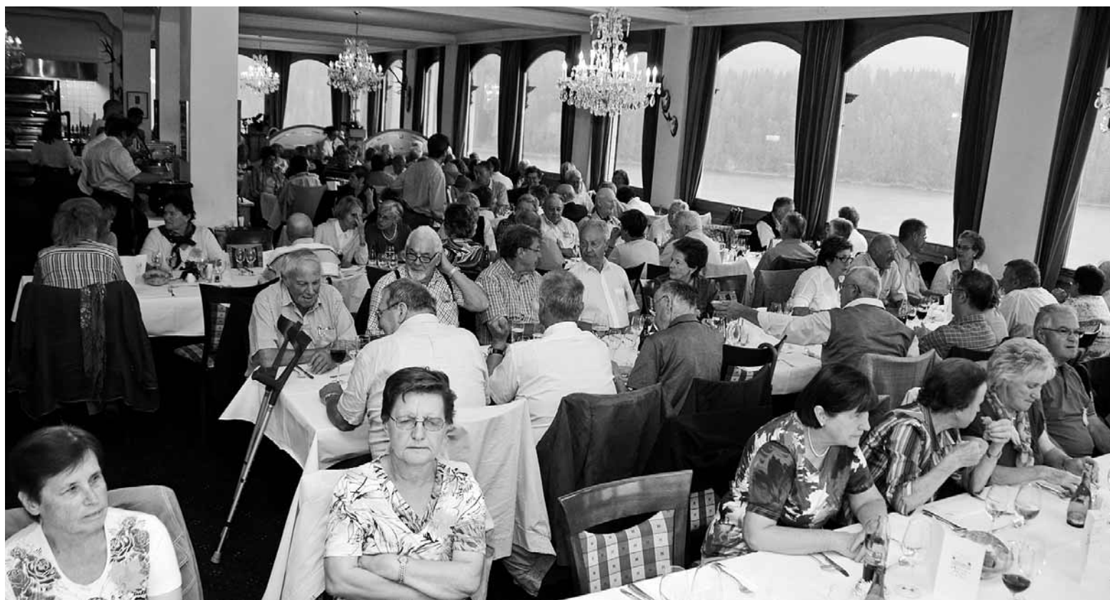
Einen herrlichen Ausblick auf den See hatten die Teilnehmer beim Mittagessen im Waldhotel am See in St. Moritz.

Die Rückfahrt mit den Reisebussen über den Julier-Pass war nochmals hitverdächtig. Es boten sich wunderschöne Ausblicke, sogar die