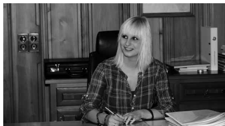
Die erste Bürgermeisterin von Vaduz?