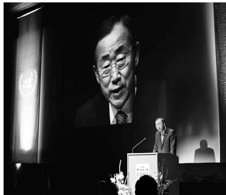
UNO-Generalsekretär Ban Ki-moon im Vaduzer-Saal.