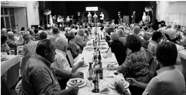
📌 Das Abendprogramm im Vaduzer-Saal war abwechslungsreich und humorvoll.