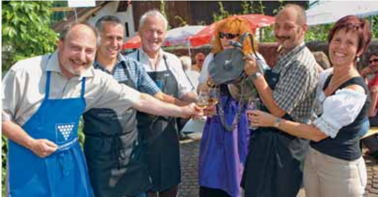
Bereits zum dritten Mal führten die Vaduzer Winzer das Truubagässlerfest am 26. Juni durch.