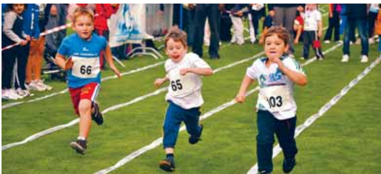
Beim Spiel- und Sporttag wurde der «schnällscht Knöpfli» ermittelt und es gab Gelegenheit, bei vielen Sportvereinen reinzuschnuppern.