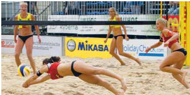
Vom 5. bis 8. August kamen die Zuschauer in den Genuss von spannenden Beachvolleyball-Szenen.