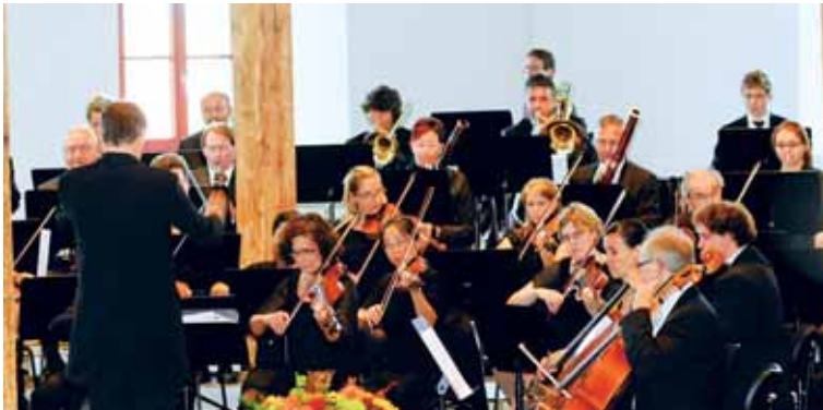
Konzert des Orchester Liechtenstein-Werdenberg am 12. September.