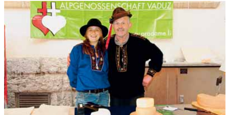
Käseverkauf von der Alp Pradamee am Herbstkochfest.