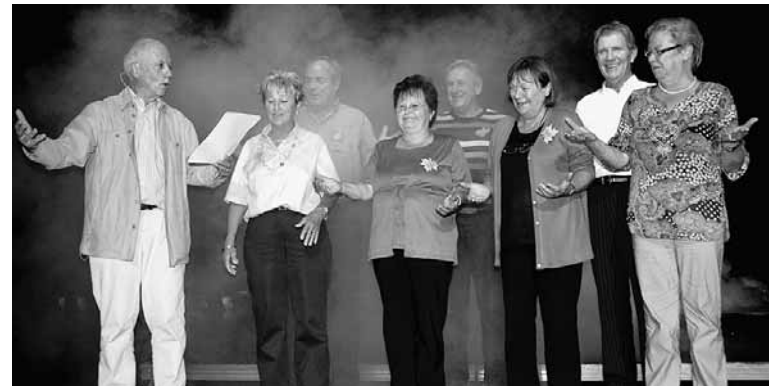
📌 Die Teilnehmer des Jahrgangs 1946 waren zum ersten Mal dabei und wurden im Rahmen einer Zeremonie in den «Club der Weisen» aufgenommen.