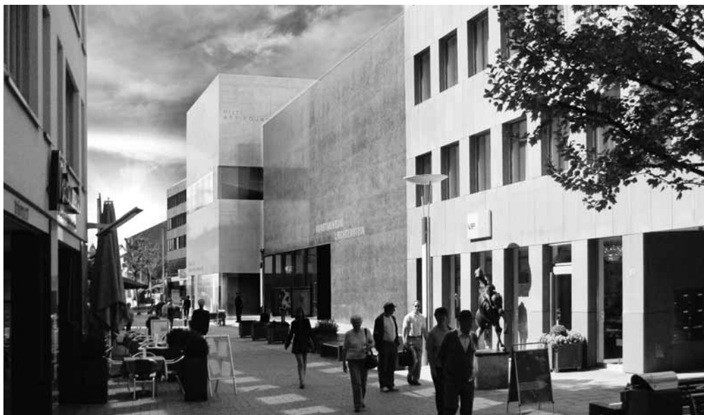
Im Städtle – Visualisierung Morger + Dettli Architekten AG, Basel

Die Hilti Art Foundation beabsichtigt, ihre Sammlungsbestände vermehrt der Öffentlichkeit zugänglich zu machen. Mit Huber Uhren Schmuck wird ein gemeinsames, neues Gebäude im Städtle neben dem Kunstmuseum Liechtenstein realisiert.