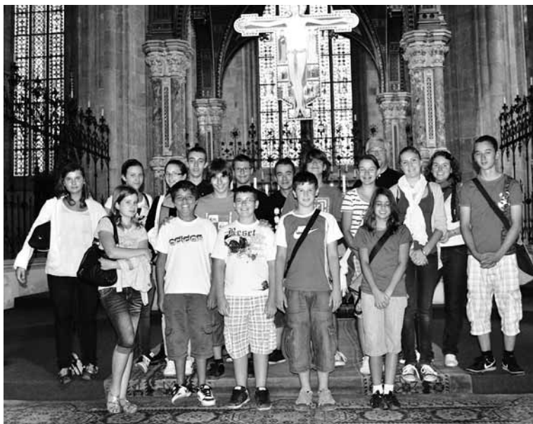
Die Dom-Ministranten von St. Florin