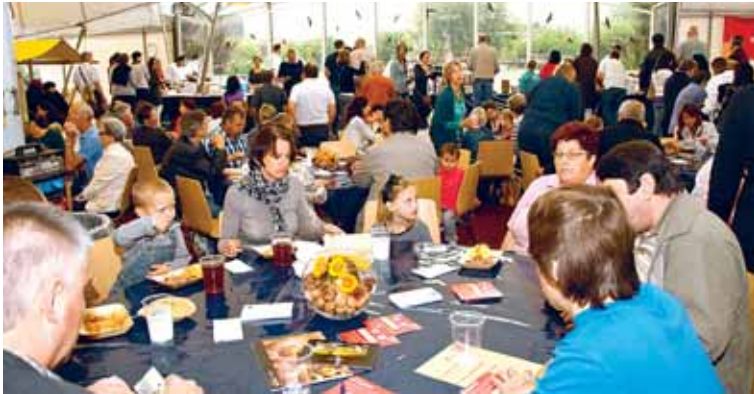
Ein Publikumsmagnet war das Herbstkochfest am 4. September.