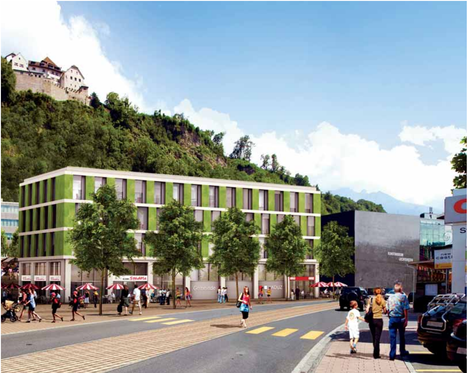
Café- und Geschäftsräumlichkeiten im neu geplanten Verwaltungs- und Geschäftshaus an der Äulestrasse.