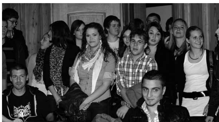
Interessante Führung durch das Rathaus.