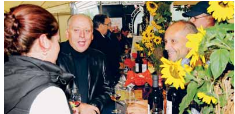
Erstmals fand das Winzerfest an einem Freitag (17. September) statt.