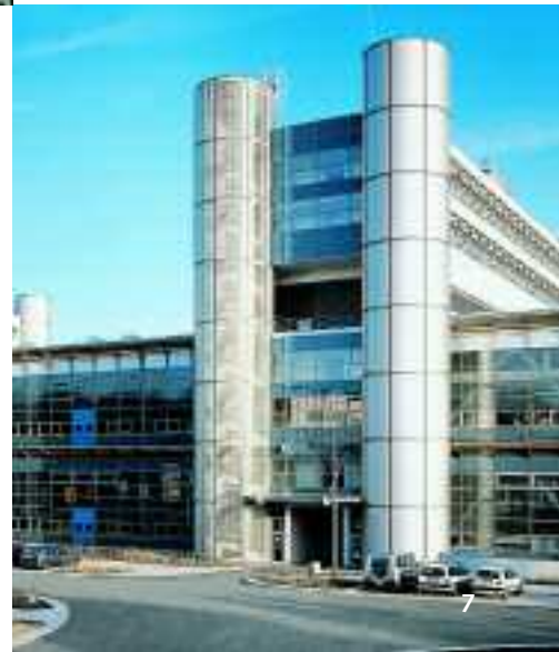
Flughafen, Hamburg, Deutschland, Serie KerAion