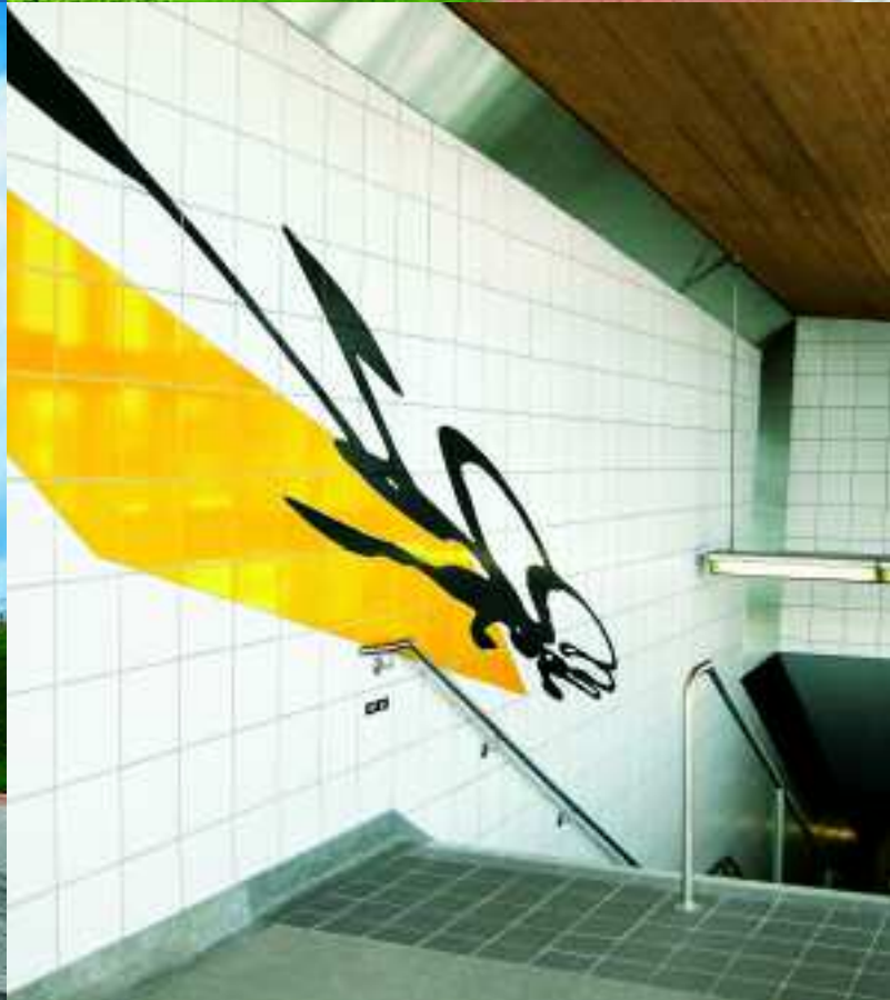
Korea-Pavillon, Expo 2000, Hannover, Deutschland, Serie KeraTwin