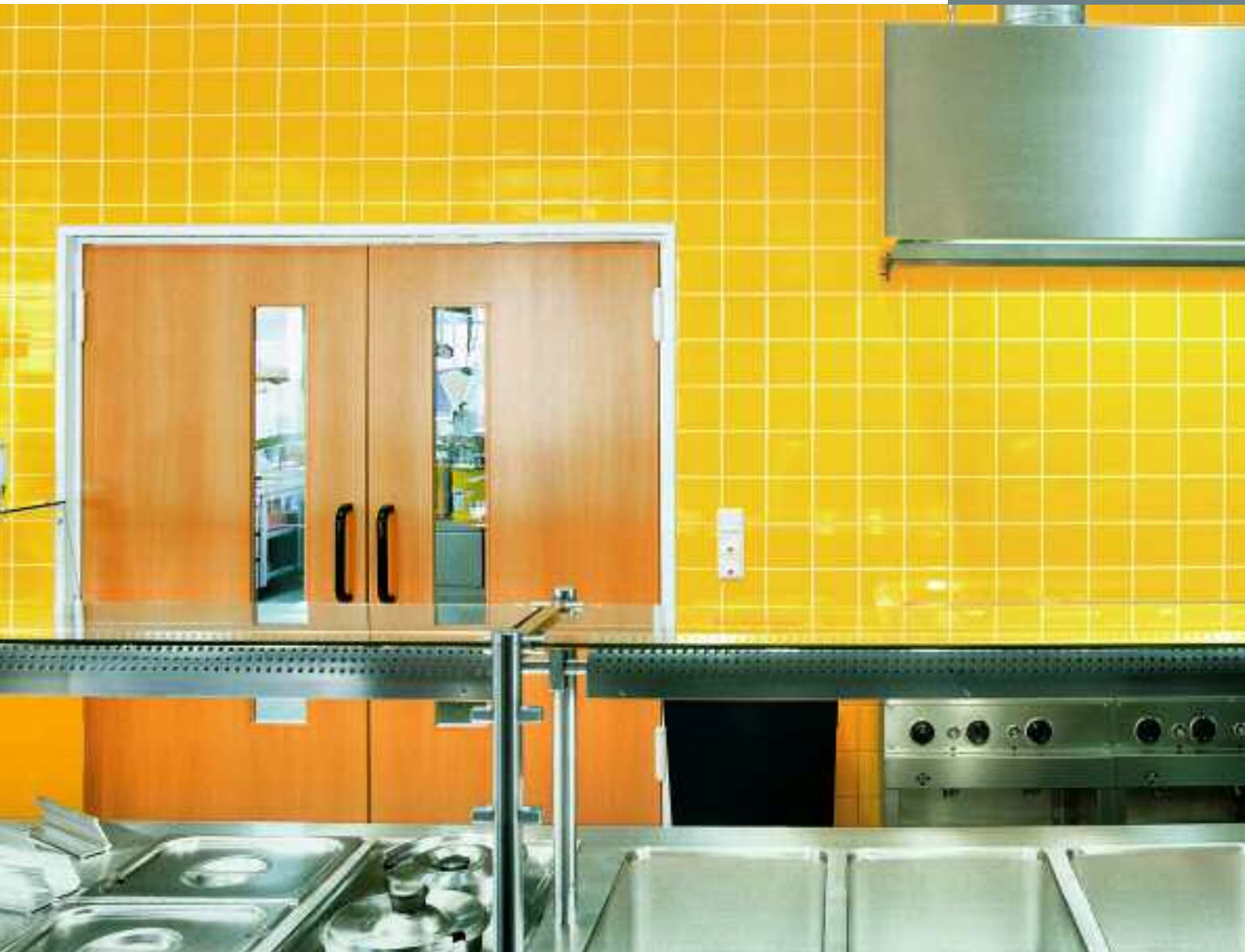
Mensa, Universität, Bremen, Deutschland, Serie Chroma