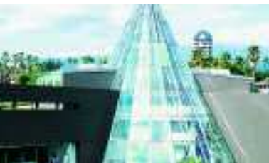
Teddybear Museum, Jeju Island, Korea, Serie KerAion