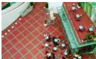
Yle Isopaya, Helsinki, Finnland, Serien Naturkeramik, Quantum

Ob Amt, Kirche oder Bildungszentrum – alle Bereiche, in denen viele Menschen aufeinandertreffen, werden stark beansprucht. Planer und Architekten, die auf Agrob Buchtal setzen, profitieren hier von vielen Pluspunkten. Zum einen überzeugt die Keramik durch Strapazierfähigkeit. Auch nach jahrelanger Nutzung behalten Oberflächen und Farben ihre Ausdruckskraft. Zum anderen ermöglicht ein durchdachtes, vielseitiges Angebot an Formteilen wie Sockelleisten, Hohlkehlen, Radialleisten oder Kehlsockel ästhetische Konzepte, die in jedem Detail überzeugen. Auch bei Nässe und Verschmutzung sorgen differenzierte trittsichere Lösungen für einen optimalen Auftritt. Wie auch immer die Stilrichtung aussieht, mit dieser Architekturkeramik lassen sich Räume gestalten, die schön sind – und schön bleiben. Langfristig gesehen ist das die beste Visitenkarte für öffentliche oder institutionelle Träger.