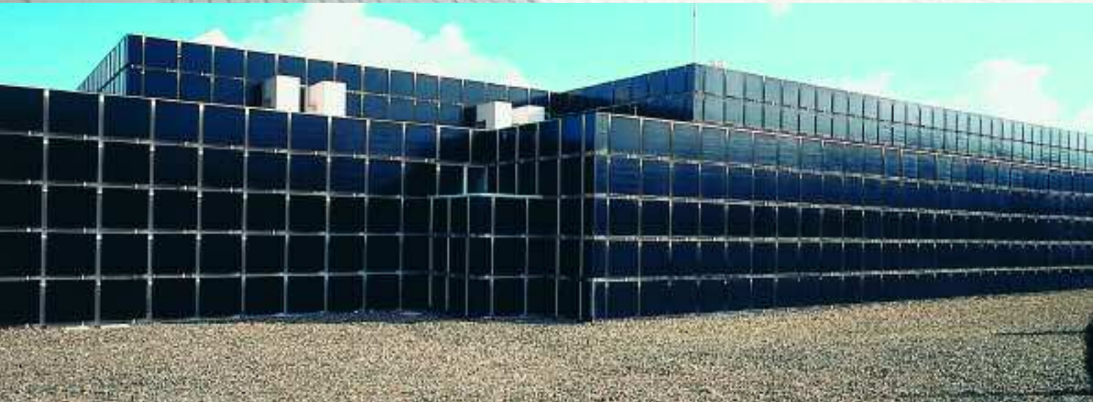
Foto oben: Hong Kong University, Hong Kong, Serie Chroma / Foto unten: Musee d'art moderne, Saint-Etienne, Frankreich, Serie KerAion