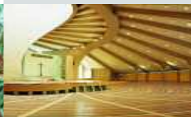
Kirche, Riva del Garda, Italien, Serie Quantum