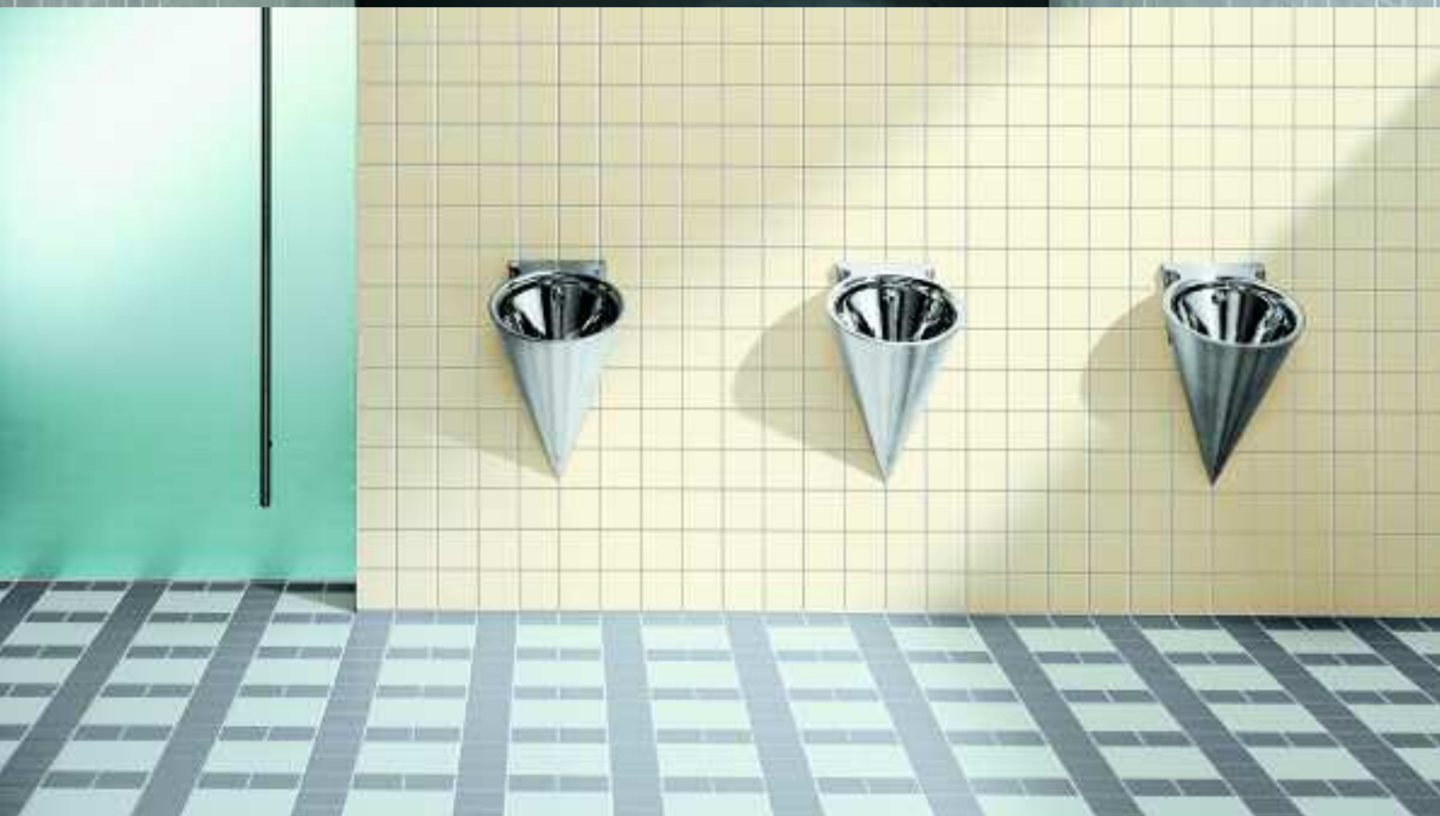
Universität Dortmund, Deutschland, Serie Geo / Serie Plural zwei