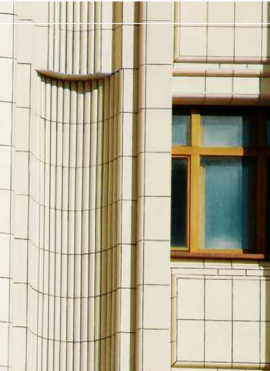
Außenministerium, Moskau, Rußland, Serie KerAion