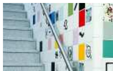
Treppenhaus, Universität, Bremen, Deutschland, Serie Chroma

Realisation individueller Konzepte. Zum Leistungsspektrum zählen Verlegepläne, außerdem Mengenermittlungen, Leistungsverzeichnisse, Ausschreibungstexte oder die objektspezifische anwendungstechnische Beratung vor Ort. Außerdem steht Ihnen auf Wunsch auch ein Ansprechpartner vor Ort zur Verfügung. Detaillierte Informationen zu sämtlichen Produkten unseres Sortiments finden Sie in unserer Publikation „Lieferprogramm“.