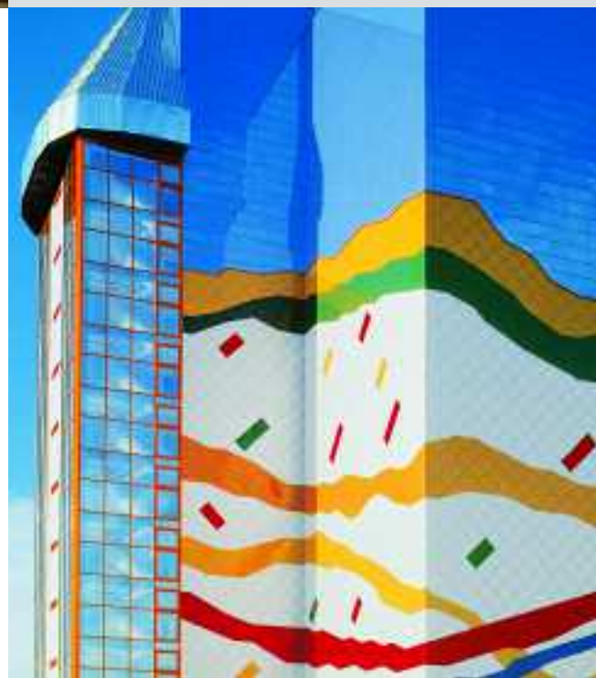
Staatsarchiv, Prag, Tschechien, Serie KerAion und projektspezifische Individualartikel

Keramik hat als Baustoff Tradition in der Architektur. Und das mit gutem Grund. Außenwandbekleidungen mit keramischen Platten bieten eine Fülle an produkt-spezifischen Vorteilen wie Langlebigkeit oder Widerstandsfähigkeit gegen Umwelteinflüsse. Sie lassen sich perfekt mit anderen Fassadenmaterialien wie Glas oder Stahl kombinieren. Außerdem vereinen die vorgehängten, hinterlüfteten Fassadensysteme exzellente technische Merkmale mit hervorragenden klimatechnischen Eigenschaften. Aber auch in ästhetischer Hinsicht überzeugen keramische Fassaden. Vielfältige Formate, Oberflächen und Farben eröffnen einen großen Gestaltungsfreiraum. Und dank jahrzehntelanger Erfahrung und Produktionsflexibilität werden die Möglichkeiten sogar nahezu grenzenlos: Jahr für Jahr realisiert Agrob Buchtal zahlreiche projektspezifische Individualfertigungen. So geben keramische Außenwandbekleidungen jedem Gebäude einen unverwechselbaren Ausdruck. Keine Lösung ist wie die andere. Jede Fassade ist ein einzigartiges Original.