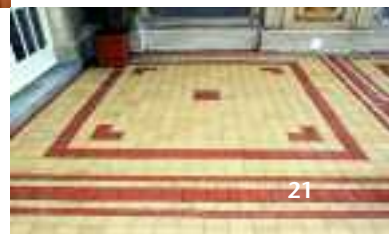
Schmuckhof, Bad Kissingen, Deutschland, Serie Buchtal Piazza