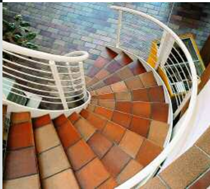
Freibad, Obercunnersdorf, Deutschland, Serie Naturkeramik