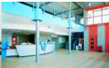
Sporthalle de Uithof, Utrecht, Niederlande, projektspezifische Individualartikel