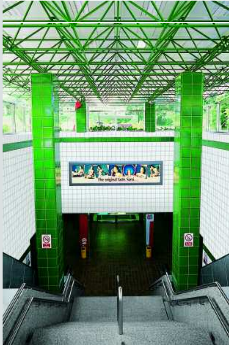
Novena Station 2, Singapur, Serie Chroma

In Flughäfen, Bahnhöfen und U-Bahn-Stationen dienen Farben als Leitsystem für Reisende und Besucher. Prädestiniert dafür sind die konsequent-logischen Systeme Chroma und Plural. Die zahlreichen Töne lassen sich immer wieder neu kombinieren. Helle und sanfte Nuancen werden ergänzt durch kraftvolle Signalfarben. Aufeinander abgestimmte Wand- und Bodenserien ermöglichen durchgängige Lösungen. Die gestalterischen Ausdrucksmöglichkeiten sind grenzenlos.