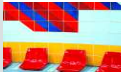
Metro Station, Kairo, Ägypten, Serie Chroma