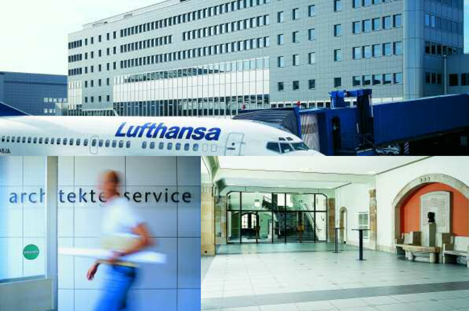
Flughafen, Düsseldorf, Deutschland, Serie KerAion / Festhalle, Landau, Deutschland, Serie KerAion