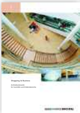
Shopping & Business