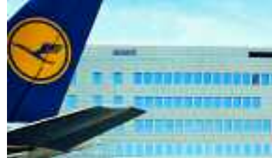
Flughafen, Düsseldorf, Deutschland, Serie KerAion