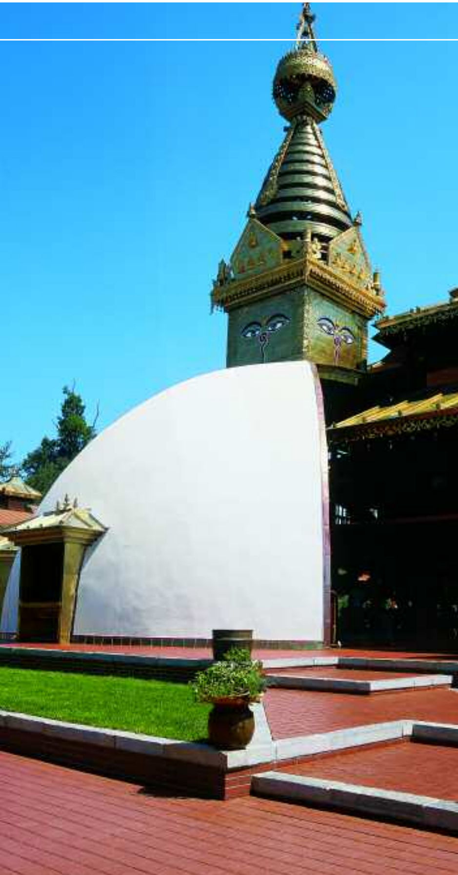
Nepaltempel, Wiesent, Deutschland, Serie Buchtal Piazza