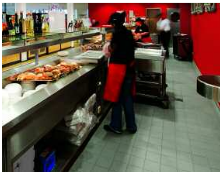
Polizeipräsidium, Bonn, Deutschland, Serie Basis 3