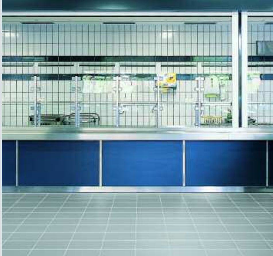
Kantinenbereich, Dempsey-Kaserne, Paderborn, Deutschland, Serien Plural drei (Boden), Plural zwei (Wand) / Fliegerhorst, Schortens, Deutschland, Serien Plural drei, Chroma