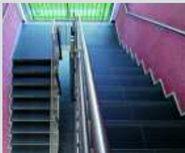
Gymnasium, Dörpen, Deutschland, Serien Geo, Quantum