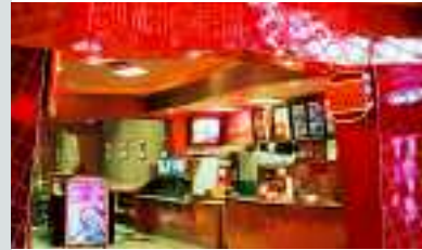
Burger King, Minnetonka, USA, projektspezifische Individualartikel