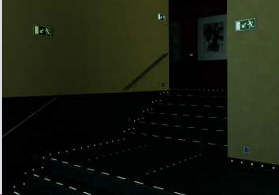
Aranäs Kontor, Kungsbacka, Schweden, Serie Naturkeramik / Lichtspeichernde und nachleuchtende Indikatoren