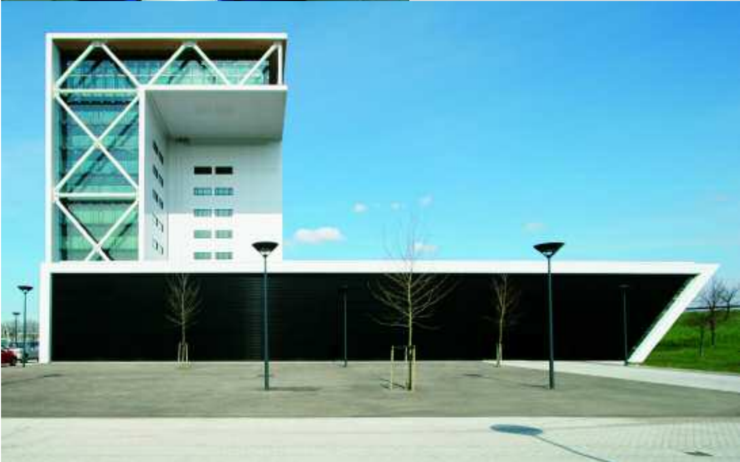
School de Driestar, Gouda, Niederlande, Serie KerAion / Bouwhuis, Zoetermeer, Niederlande, Serie KeraTwin

Fassadensysteme von Agrob Buchtal bewähren sich seit Jahrzehnten unter verschiedensten klimatischen Bedingungen. Die Produktfamilien KeraTwin und KerAion bieten zahllose Möglichkeiten: ob glasiert oder unglasiert, ob modernes Brettformat oder großflächig-repräsentative Abmessung. Selbst für Sanierungen und Restaurierungen, die den Charakter kleinformig bekleideter Fassaden bewahren sollen, gibt es geeignete Lösungen.