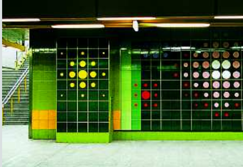
Foto oben: U-Bahn-Haltestelle Poststraße, Köln, Deutschland, Serien Chroma II, Geo / Foto unten: Metro Station, Kairo, Ägypten, Serie Chroma