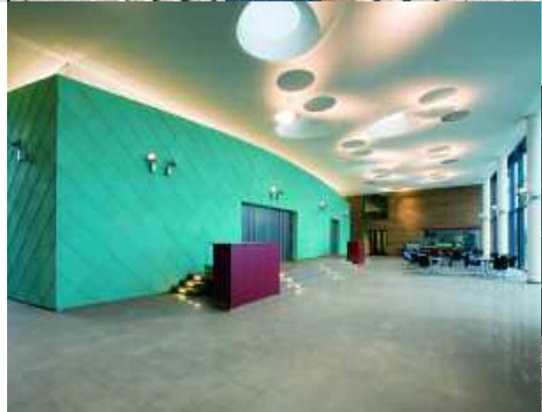
Foto oben: Verwaltungsgebäude Deutsche Telekom, Bremen, Deutschland, Serie Quantum und projektspezifische Individualartikel / Foto unten: Gartenbauzentrum, Ellerhoop, Deutschland, Serie Royal Stone