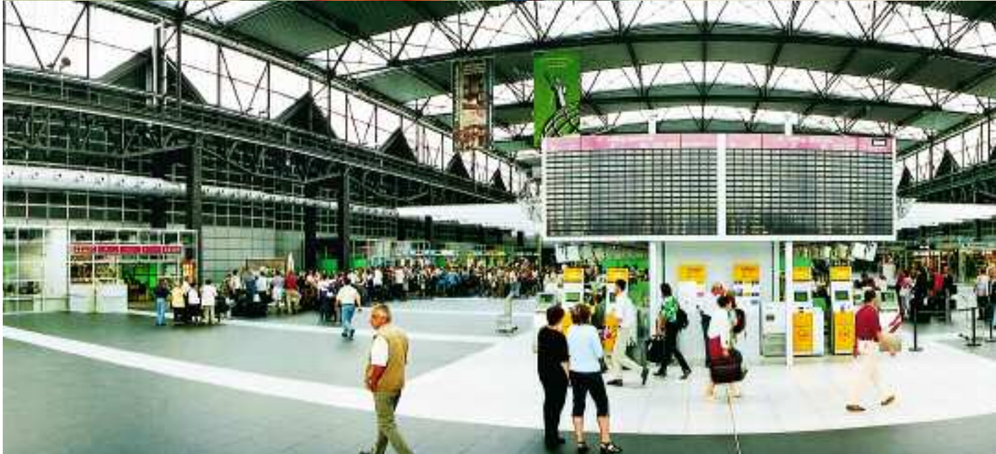
Sheppard Subway, Don Mills Station, Toronto, Kanada, Serie Chroma / Flughafen, Dresden, Deutschland, projektspezifische Individualartikel