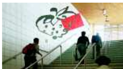
Sheppard Subway, Bayview Station, Toronto, Kanada, Serie Chroma