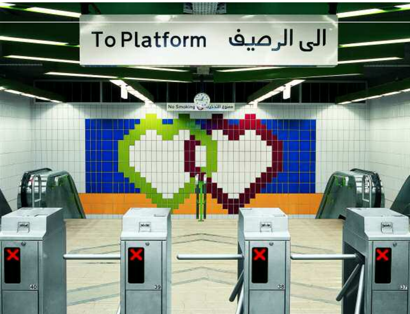
Metrostation, Kairo, Ägypten, Serie Chroma