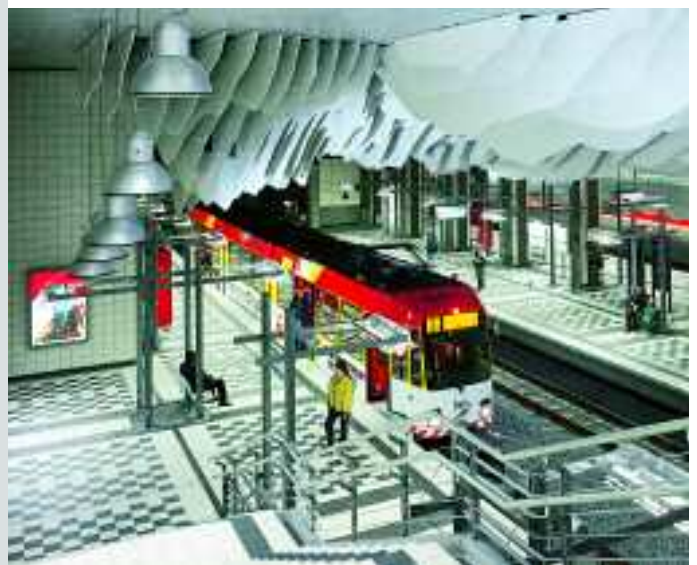
Stadtbahn, Bielefeld, Deutschland, Serie Quantum