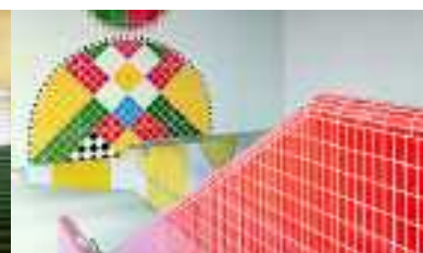
Metro Sport, Antwerpen, Belgien, Serie Chroma