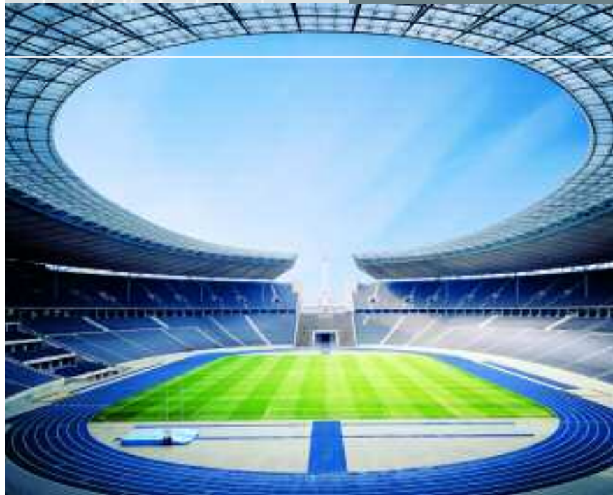
Olympiastadion, Berlin, Deutschland

Die aktuellen Fliesenserien von Agrob Buchtal für Wand und Boden, Fassaden und Vorplätze, Sanitäreinrichtungen und Kantinen helfen die ästhetische Vision umzusetzen. Sie inspirieren Architekten und Planer, neue Wege zu gehen.