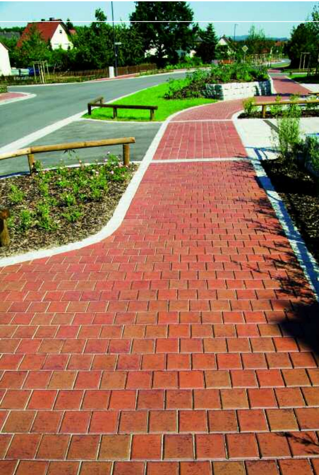
Gehwege, Schwarzenfeld, Deutschland, Serie Buchtal Piazza