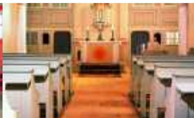
Kirche, Seifertshain, Deutschland, Serie Goldline