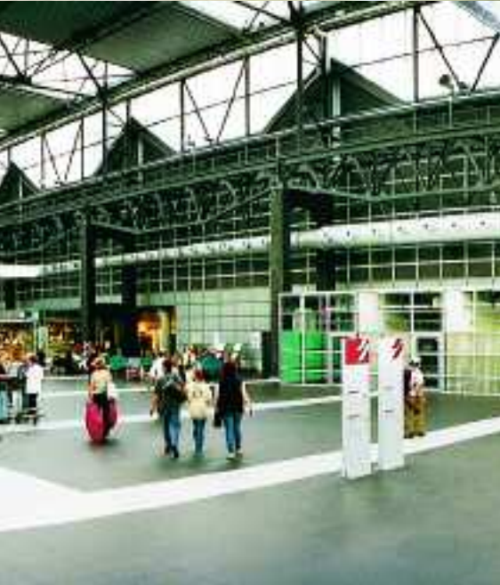
Metro Station, Kairo, Ägypten, Serie Chroma

In das moderne Gesamtbild fügt sich die Architekturkeramik von Agrob Buchtal harmonisch ein. Und der ästhetische Eindruck bleibt auf lange Dauer erhalten. Denn die keramischen Bodenbeläge vertragen unzählige Fußstritte, Kofferkuli, und sogar Gabelstapler hinterlassen auf den geräuscharm befahrbaren Fliesen und Platten keine bleibenden Spuren. Durch vielfältige Trittsicherheitslösungen lassen sich auch Einsatzbereiche mit unterschiedlichsten Anforderungen zu einer gestalterisch schlüssigen Einheit verbinden.