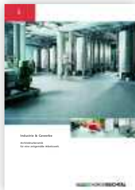
Industrie & Gewerbe