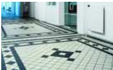
Kreisverwaltung, Prenzlau, Deutschland, Serie Quantum