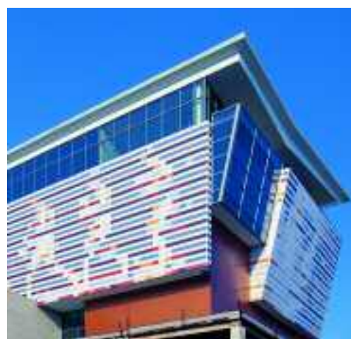
Muhammad Ali Center, Louisville, USA, Serie KerAion