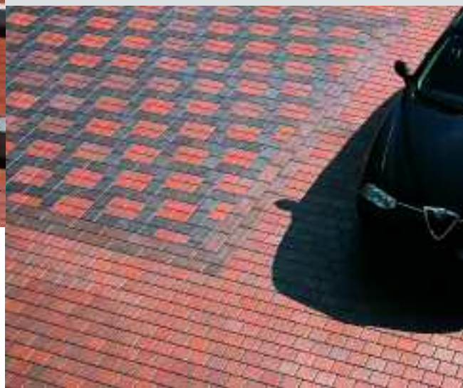
Verwaltungsgebäude, Schwarzenfeld, Deutschland, Serie Buchtal Piazza

Neben der Fassade prägt der Eingangsbereich das Bild von einem Gebäude am stärksten. Mitarbeiter passieren diesen Bereich mehrmals täglich, Kunden und Gäste werden hier empfangen. Viele Fliesenserien eignen sich sowohl für die Verlegung im Außen- als auch im Innenbereich. Eine ideale Lösung für den Außenbereich ist auch der keramische Pflasterstein Piazza: Er überzeugt durch natürliche Anmutung und hohe Robustheit. Auch intensive Sonneneinstrahlung bewirkt keine Farbveränderungen und aggressive Medien wie z.B. Streusalz hinterlassen keine Schäden. Denn Piazza ist nicht einfach nur oberflächlich eingefärbt, sondern durch und durch aus hochwertigem Steinzeug bei über 1100 °C im Tunnelofen gefertigt.