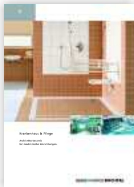
Krankenhaus & Pflege