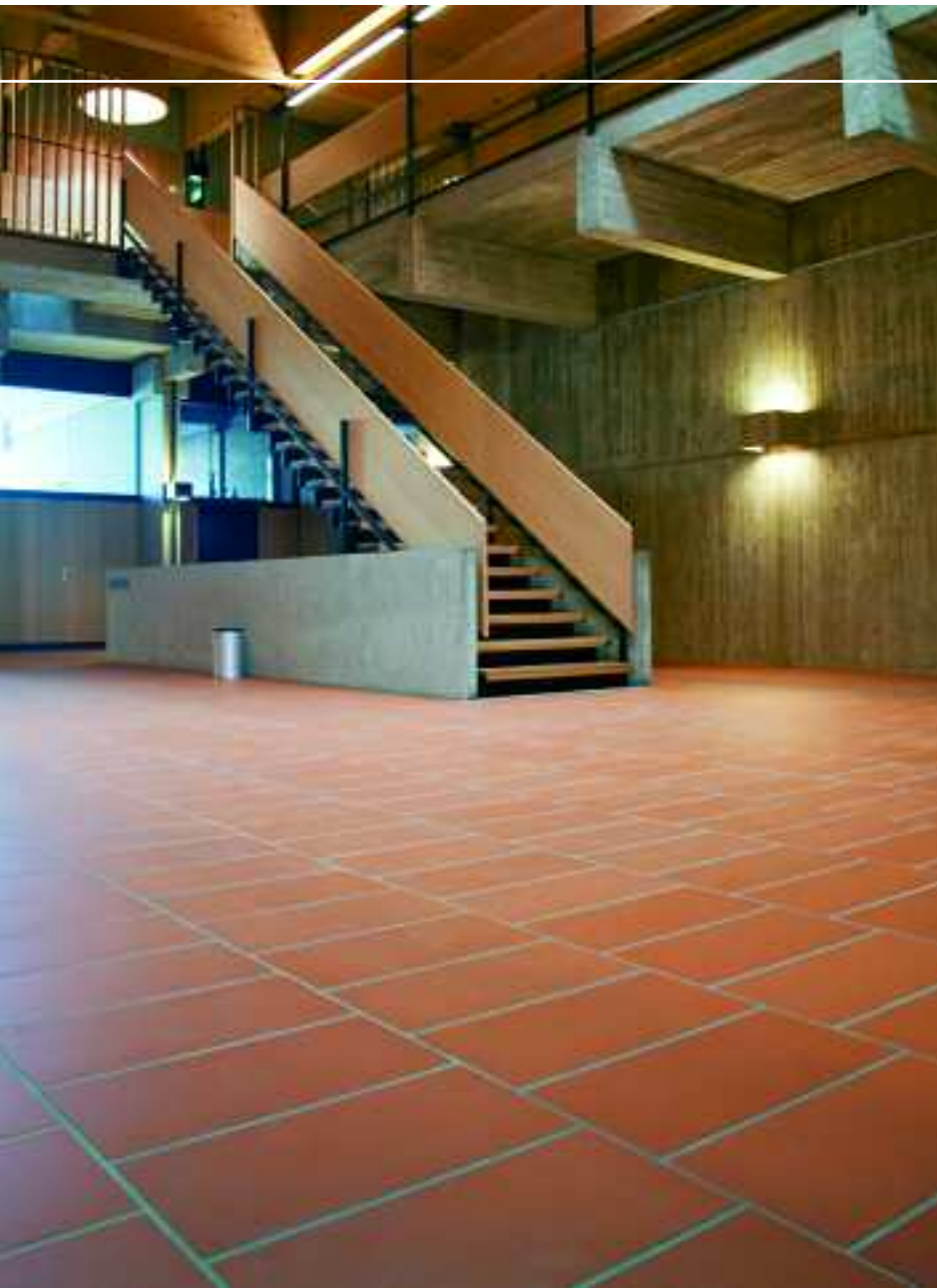
Pfarrzentrum St. Bonifaz München, Deutschland, Serie Naturkeramik