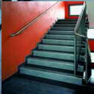
Juri-Gagarin-Schule, Bad Frankenhausen, Deutschland, Serie Geo