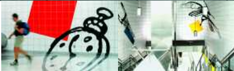
Sheppard Subway, Bayview Station, Toronto, Kanada, Serie Chroma