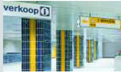
Metro Sport, Antwerpen, Belgien, Serie Chroma