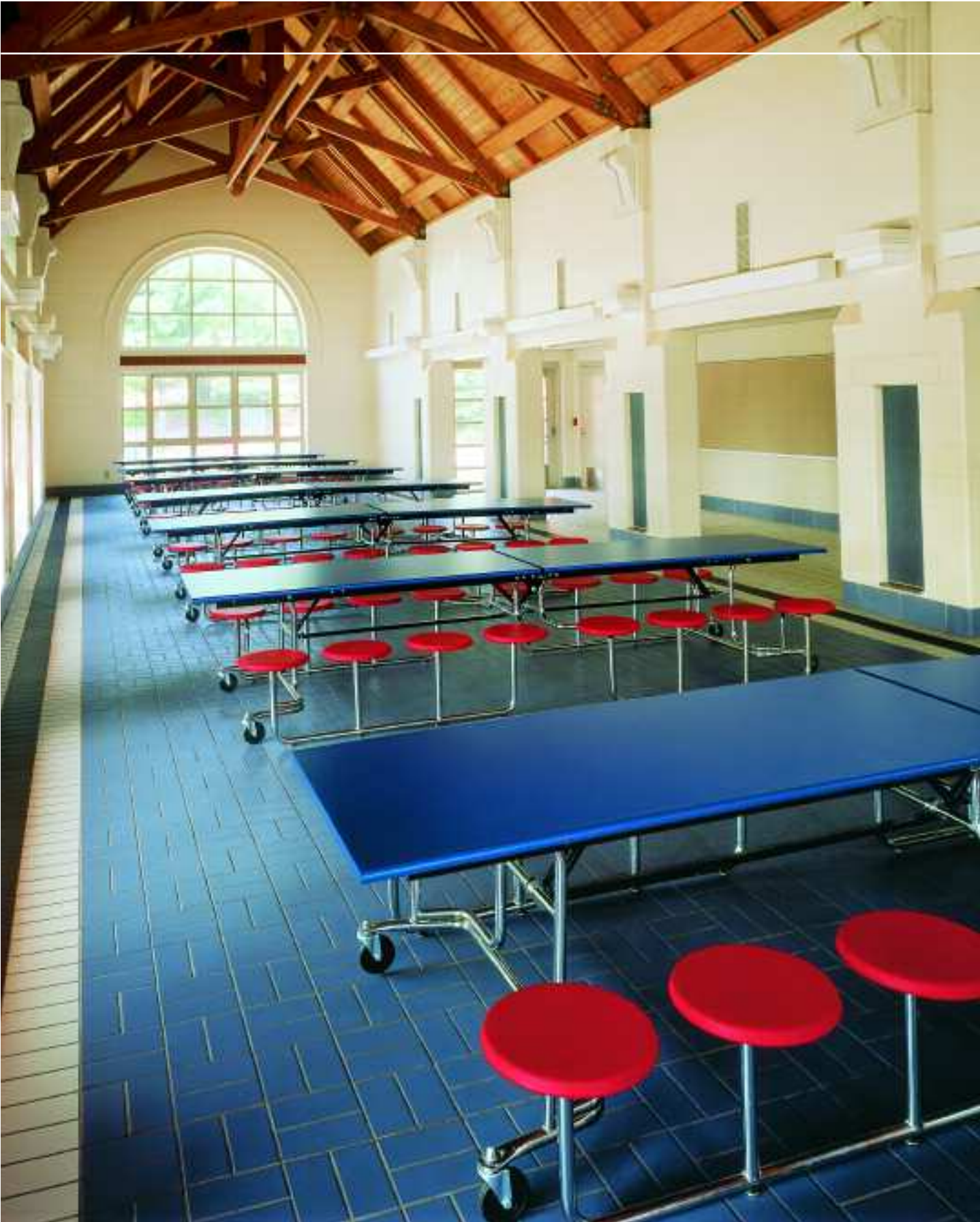
Mensa, Mary Murphy School, Bradford, USA, projektspezifische Individualartikel