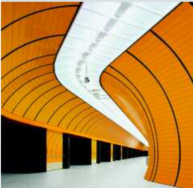
U-Bahn-Haltestelle Marienplatz, München, Deutschland, projektspezifische Individualartikel