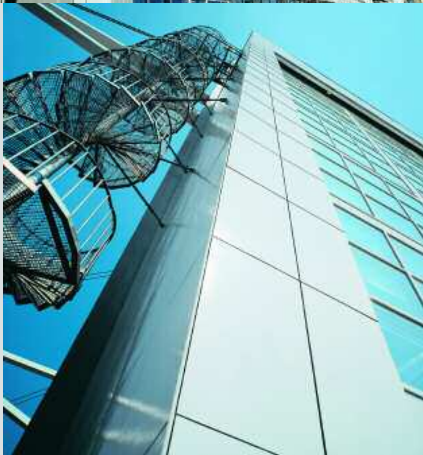
Landratsamt, Pforzheim, Deutschland, Serie KerAion / Flughafen, München, Deutschland, Serie KerAion