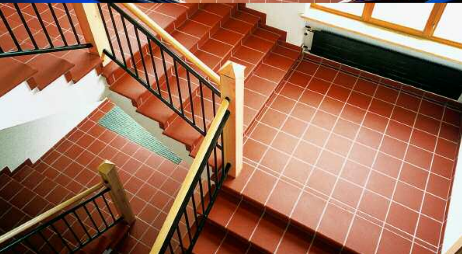
Verwaltungsgebäude, Hagen, Deutschland, Serie Naturkeramik / Serie Naturkeramik