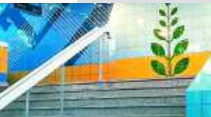
Metrostation, Kairo, Ägypten, Serie Chroma