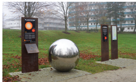
Planetstien starter ved Storåna like nord for Bruelandsenteret.

2. Planetstien er en fin måte å bli kjent med solsystemet på. Samtidig blir det en flott tur langs Storåna og Stokkalandsvatnet. En vandring langs Planetstien vil gi et innblikk i dimensjonene. Sola, Jorda og de øvrige planetene er plassert ut i riktig størrelse og avstand i forhold til hverandre, dvs. at når en beveger seg 1 meter langs stien, tilsvarer det 1 million kilometer ute i verdensrommet. Sola står som ei stor blank kule nede ved Storåna på Skeiane, og på hver planetstasjon er det informasjon og en bronseplate med relief av planeten i samme målestokk som hele planetstien. De fleste planetene er plassert langs Storåna, mens Neptun og Pluto er ved Stokkalandsvatnet.