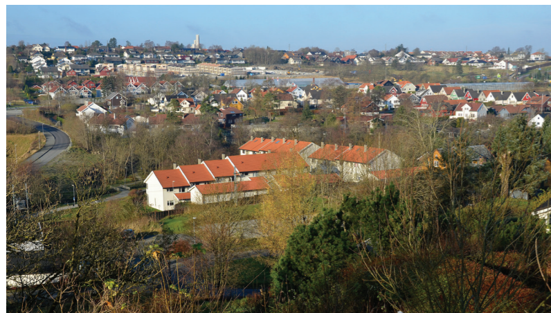
Sandved bydel sett fra Sørbø/Hove.