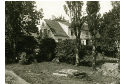
Lensmannsgården på Sandve.