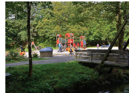
Lekeplass i Sandvedparken.

7. Sandvedparken med balløkke, lekeplass, scenebygg og trimpark er den sentrale delen i det som etter hvert blir Gandsparkene, et parkdrag langs Storåna fra Stokkalandsvatnet til den løper ut i Gandsfjorden. Sandvedparken er navnet på området langs Storåna fra området hvor E39-brua krysser over og ned til der Kvellurve-