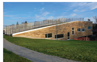
Brueland barnehage er et Norwegian Wood prosjekt

5. Sandveds Hagebruksskole ble startet av Samuel Jonassen