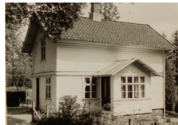
Bestyrerboligen til Statens Planteskole.

4. Statens planteskole ble etablert på Sandve da staten i 1867 kjøpte en del av gården. I årene fram til 1897 ble i alt seks eiendommer på Sandve, Brualand og Austrått kjøpt inn, og i tillegg leide en i perioder også tilleggsjord. Hensikten med planteskolen var å forsyne private og offentlige skogplantefelt med planter. I sin tid var skolen den største i