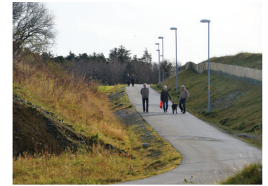
Gang- og sykkelveien langs Rv 44.