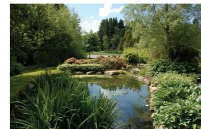
Fra Sandved rensepark.