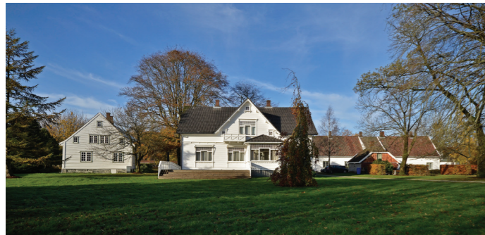
Skeianetunet. Representasjonsbygningen i midten. Eldresenteret til høyre.