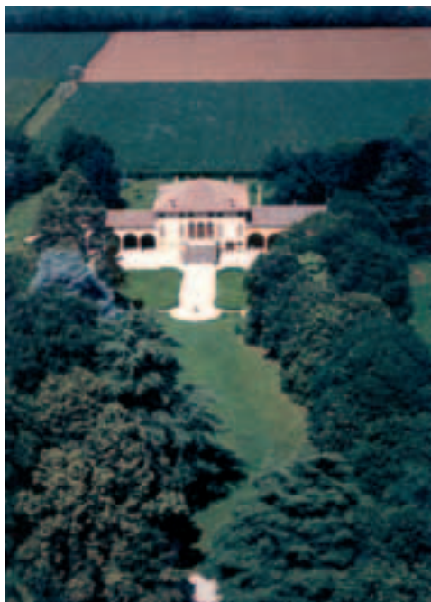
Villa Agostini - Cusignana

Villa Letizia , in via Vittoria, edificio settecentesco di notevole sviluppo lineare, nel cui salone centrale si conservano ancora pregevoli affreschi. Nei pressi della villa si trova un interessante oratorio, dedicato alla Madonna della Salute, che si caratterizzava per la planimetria, la soffittatura e le essenziali decorazioni a stucco. Villa Vianello-Chiodo , in via Vittoria, pregevole esempio di dimora dominicale settecentesca, nel cui lato est sorge una barchessa caratterizzata dal porticato a 5 arcate. Monumenti ai caduti . Giavera è legata storicamente ad