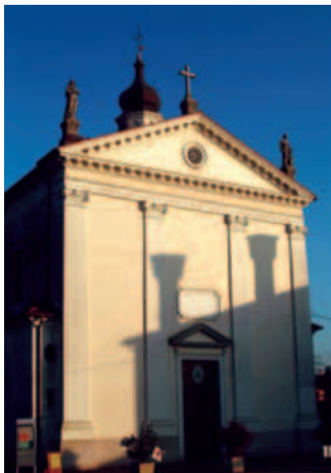
Chiesa di Povegliano

Nella strada che da Povegliano porta a Visnadello furono rinvenute alcune sepolture ed un antico corredo funebre.