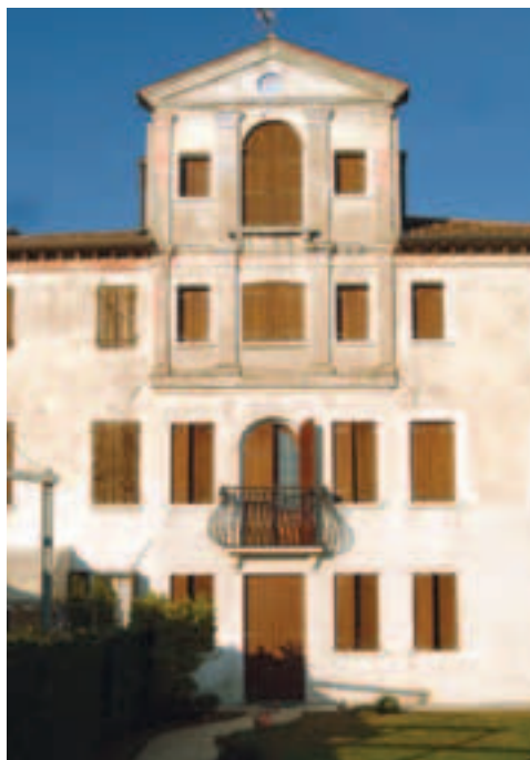
Villa a Santandrà

E' un edificio un tempo adibito ad asilo ed è l'emblema dei caduti e dispersi delle Guerre Mondiali.