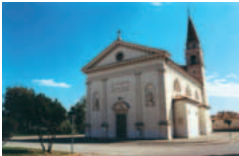
Chiesa Parrocchiale di Cusignana

1892, il Montello fu per metà diviso in quote, che furono assegnate gratuitamente ai bisnenti e per metà suddiviso e venduto in poderi.