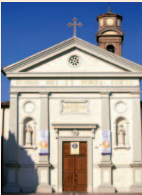
Chiesa di Camalò - Povegliano