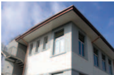
Nuova sede Biblioteca Comunale

magazzini. La casa fu dei nobili veneziani Dolfin tra il '600 ed il '700, mentre una porzione dell'edificio era di proprietà del Monastero di Ognissanti di Treviso; successivamente dimorò la contessa Menegazzi, alla quale seguirono abitanti della zona. Casa Dal Gobbo , Borgo S. Andrea. Abitazione antica su due piani appartenuta ai nobili veneziani Franceschi nel 1700. Una patera posta all'esterno sopra un grande arco raffigurava uno stemma di famiglia. Casa Zanatta , in via Treviso, è un edificio a tre piani, con grande finestra palladiana ad archi e tracce di antiche decorazioni sulla grande facciata. Casa Tesser in via dei Caduti è un edificio dominicale appartenuto alla famiglia dei nobili Carretta nel XVIII secolo. All'interno erano presenti pitture parietali. Villa Bonisiol in via dei Caduti è una casa a tre piani storica con tracce di antiche decorazioni esterne. Non è più abitata da anni perché ormai è compromessa la staticità dell'edificio. Monumento ai caduti Borgo S. Andrea. Si trova nel piazzale antistante la chiesa e raccoglie l'elenco dei caduti e dispersi delle Guerre Mondiali.