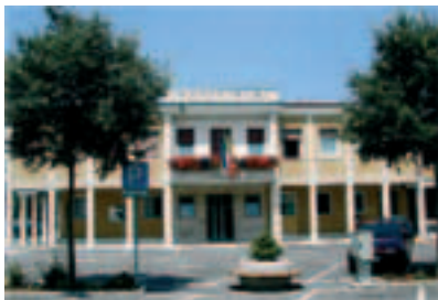
In copertina: Municipio di Givera del Montello