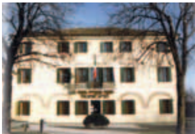
In copertina: Municipio di Povegliano