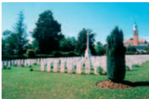
Cimitero inglese

Casa Bonan , Borgo S. Andrea. Nel 1600 fu sede di un convento dei monaci benedettini cassinesi dipendenti dall'abazia di Nervesa, nel 1700 divenne villa di campagna. La facciata mostra un balcone settecentesco nella parte centrale superiore dell'edificio. Abitarono i signori Mantelli nel 1700 e più recentemente le famiglie: Genovese, Tasca, Bonan. Casa ex Menegazzi , Borgo S. Andrea. La casa si trova al centro del paese e mostra l'appartenenza a più famiglie. Alcuni porticati collegano con antichi