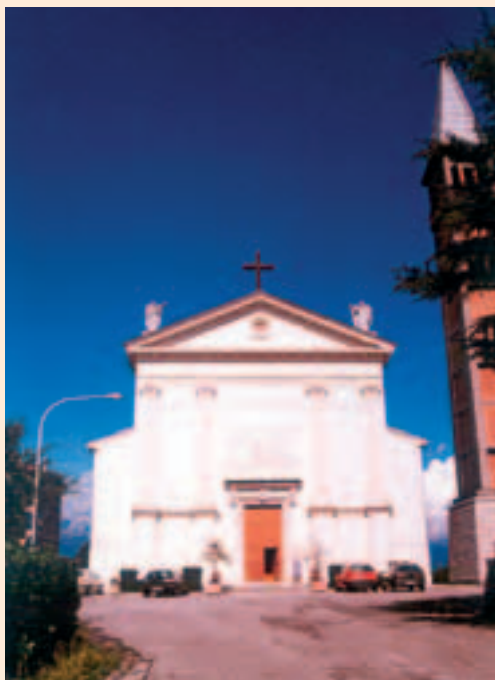
Chiesa parrocchiale SS. Angeli - Gavera del M.