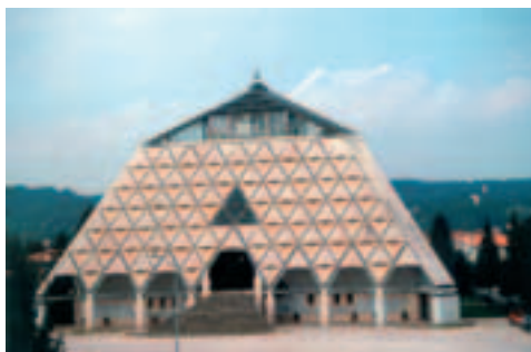
Tempio Regina Pacis

I Provveditori, poi Ispettori, svolsero la loro attività sino alla fine dell'Ottocento, allorché, per effetto della legge Bertolini del