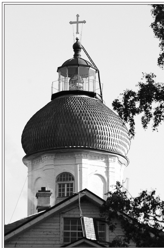
Купол храма-маяка на Секирной горе. Фотография 2011 г.