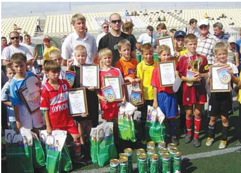
Все участники получили подарки от спонсоров и партнеров турнира