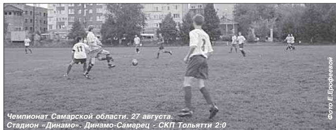
Чемпионат Самарской области. 27 августа. Стадион «Динамо». Динамо-Самарец - СКП Тольятти 2:0