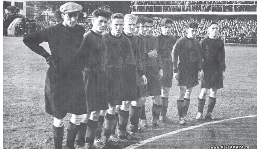
1950 год. Ленинград. Стадион «Динамо».