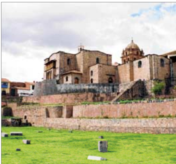
Kusko. Inku Saules tempļa – Korikanča ārsiena ar blakus esošo «Zelta dārzu», kur stāvējušas zeltītās dievu statujas, zeltā darinātie krūmi un puķes.

Tagadējā Peru Republika aptver tikai daļu no kādreizējās inku valsts, kura bija pakļāvusi Čīles, Bolīvijas, Argentīnas, Kolumbijas un Ekvadoras ciltis. Plašo inku valsti 15. gs. vidū bija izveidojis