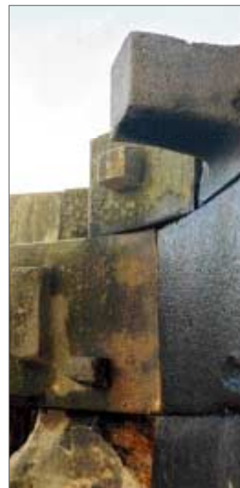
Kusko. Saules tempļa siena ar Saules kalendāra akmens pilastriem.