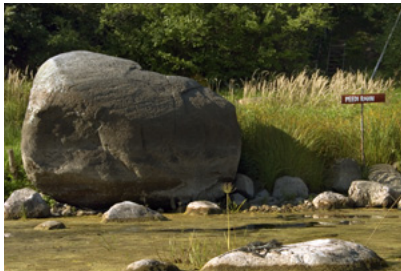
Peedi rahn Muraka külas

Jõesuu-Tori jõelõik on üsna kivine ning kärestikuline. Palgiparvetuse aegadel lõhuti siin mitmed suured rändrahnud, sest palgid takerdusid kivide taha. Mõned suured kivid kalda ääres (nt Linnusitakivi, Peedi rahn jt) annavad tunnistust endistest hiiglastest. Siinkandis on kärestikuks lagunenud Levi veskipais , millest on säilinud jõe vasakul kaldal asuv lagunenud väike maakivist veskihoone. Keset Levi kärestikku asus Moorikivi ehk moorits. Levi külas toodi vanal ajal lapsi