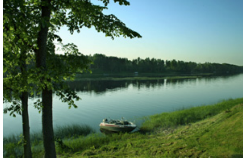
Pärnu jõgi Paikuse kohal

Sindi linnast allavoolu Pärnu jõe vasakkaldale jääb Paikuse ning paremkaldale Tammiste asula. Jõesäng muutub järjest laiemaks ning metsasemaks, siit saab alguse Pärnu linna lähiümbruse metsavöönd , mida kutsutakse ka Pärnu linna “rohelisteks kopsudeks”. Paikuse asula ja Reiu jõe suudme vahel asub kolm muistset kiviaja muistist, mis kutsutakse Sindi-Lodja asulakohtadeks . Võrreldes Pulli leiukohaga on siinsed muistised nooremad, piirkond asustati 7100-6600 aastat eKr. Arheoloogid ning Paikuse vald plaanib Sindi-Lodja asulakohta rajada Eesti esimese kiviaia pargi. Piirkonda soovitakse tulevikus ehitada kiviaia küla, mis koosneks kahest-kolmest elamust ja kõrvalrajatistest. Hooned ja muud rajatised peaksid kujutama ajaperioodi umbes 3500 aastat eKr. Lisaks rajatakse kattega jalgrajad, paatide maabumiskohad, püstitatakse tutvustavad stendid