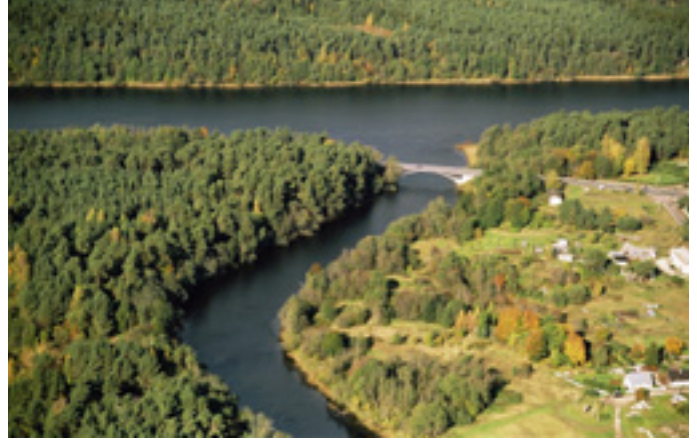
Reiu jõe ühinemine Pärnu jõega