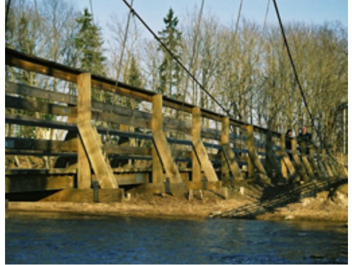
Pärnumaa pikim rippisild Jõesuus

puu võetud looduskaitse alla. Nagu näha, ei pea puu tõusma imetlusväärsete sekka alati seetõttu, et ta on väga võimas. Vastupidi, ta võib ka olla kõikidest väiksem.