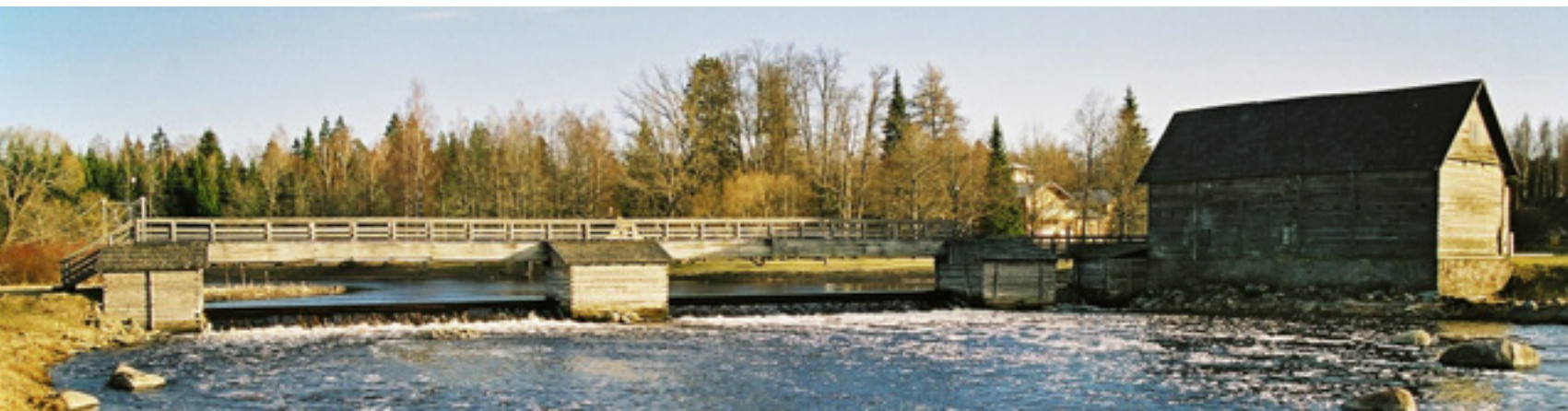
Kurgja veskipais ja veskihoone

Üks suurejoonelisemaid ideid Pärnu jõe kasutamisel tekkis Rootsi suurvõimu ajal, mil sooviti rajada Pärnu-Viljandi-