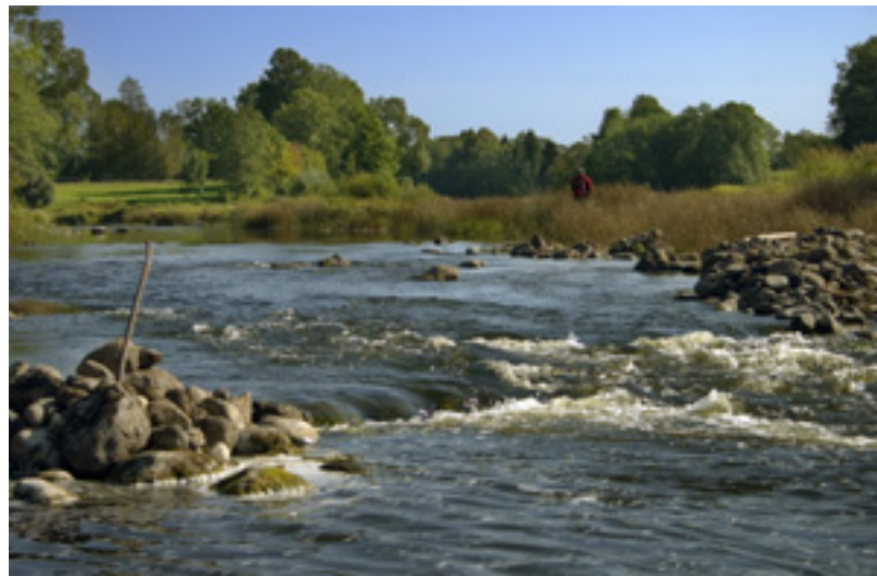
Kärestikuks lagunenu vana veskipais

kihelkonnakeskus. Tori kihelkonnakeskuses asus Tori mõis, mis 16. sajandil oli Pärnu ordukomtuuri peamõis. 1820-ndate aastate teisel poolel renditi mõis Liivimaa rüütelkonnale meriino lammaste ja tõuveiste pidamiseks, 1854. aastal sai peasuunaks hobusekasvatus. Tori alevik hakkas kujunema 19. sajandi lõpus, kandes enne Tõia küla nime. Siin on hästi säilinud kihelkonnakeskuse struktuur ja hooned, neist 23 on riikliku mälestisena arvele võetud. Esiletoomist väärib mõisaansambel, kus on säilinud imposantne värav,