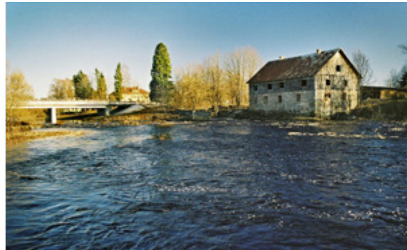
Pärnu jõgi ja Suurejõe veskihoone

Vana Pärnu - Paide maantee äärde kerkinud alev hakkas Vändra mõisa ja kiriku ümber kiiresti arenema 19. sajandi alguses pärast seda, kui Vändrasse rajati klaasivabrik ning metsatöötlemise ettevõtteid. Aegade jooksul on Vändras au sees olnud kodukaunistamise kultuur. Hästi on säilinud ajaloolise peatäna, Vana täna, arhitektuurne