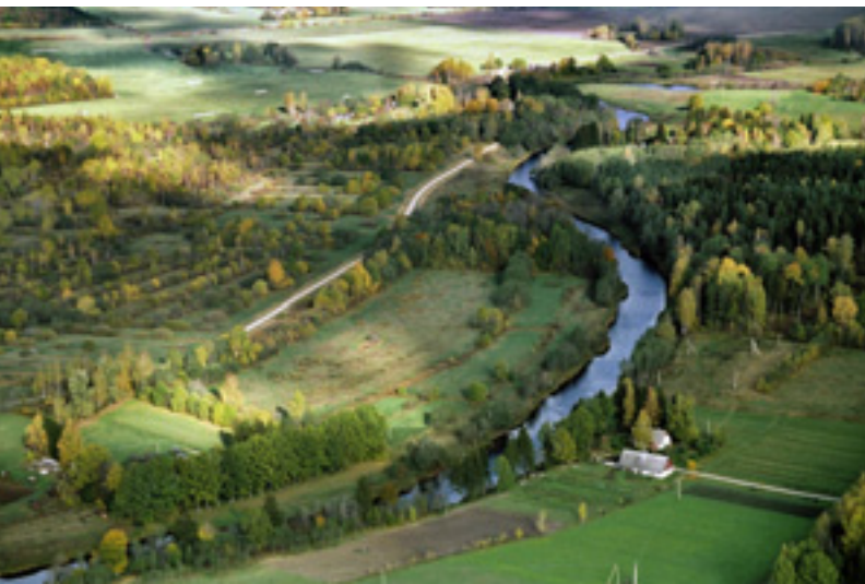
Pärnu jõgi Kullimaa külas

ja Kullimaa külas asuvad mitmed matmiskohad ning ohvrikivi "Kurikivi". Kullimaa külas ühineb Pärnu jõega Väandra jõgi.