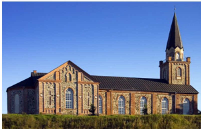
Püha Jüri luteri kirik Toris ▶