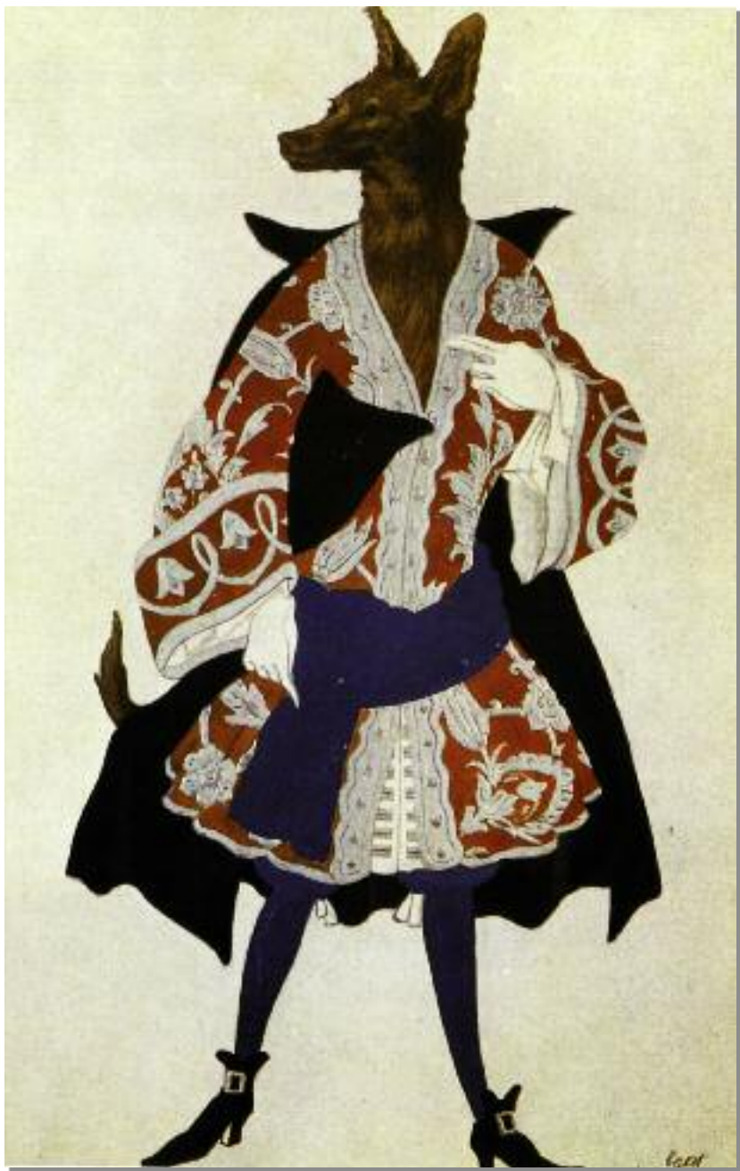
Léon Bakst (Lev Samojlovič Bakst; 1866-1924), figurino (il lupo) per La bella addormentata all'Alhambra di Londra, 1921 (Ballets Russes). Al divertissement del terzo atto del balletto (le nozze di Aurora e del principe) partecipano i personaggi delle fiabe: il gatto con gli stivali, l'uccello azzurro e la principessa Florina, cappuccetto rosso e il lupo, Cenerentola e il principe, Pollicino e l'orco. Nella versione di Márcia Haydée vi sono anche Hänsel e Gretel, Barbablù e sua moglie, Aladino e Jasmine, Colombina e Arlecchino, la principessa e il ranocchio, Bella e la bestia, Raperonzolo e il principe, Biancaneve e i sette nani, Ali Babà e i gioielli.