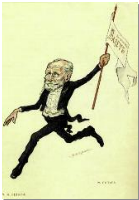
Marius Petipa (1818-1910) in una caricatura (1903) di Nikolaj (1869-1929) e Sergej (1875-1905) Legat.