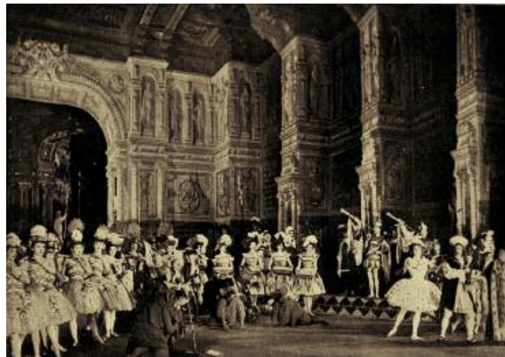
Un'immagine del prologo della prima rappresentazione assoluta della Bella addormentata , San Pietroburgo 1890. La foto coglie l'ingresso della fata malvagia Carabosse (impersonata da Enrico Cecchetti, 1850-1928, che nel terzo atto ricopriva anche il ruolo dell'uccello azzurro).