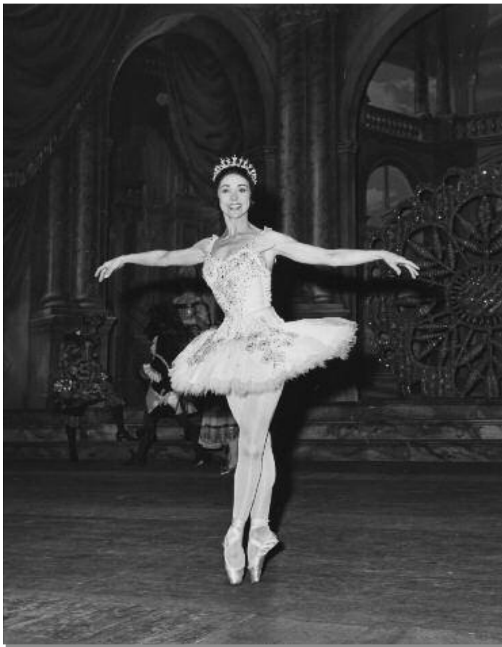
La bella addormentata al Teatro La Fenice di Venezia, 1968 (London's Festival Ballet); coreografia di Ben Stevenson, scene e costumi di Norman McDowell. In scena: Margot Fonteyn (Aurora).