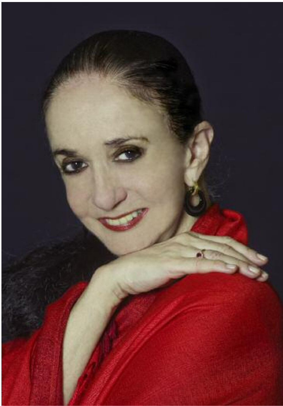
Márcia Haydée. La sua Bella addormentata , rappresentata la prima volta allo Staatstheater di Stoccarda nel 1987, viene presentata al Teatro La Fenice di Venezia, 2011.