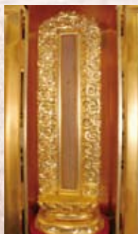
唄多羅葉 アダムズが東南アジアから持ち帰ったといわれる。(浄土寺所蔵) The Baitarayo, said to have been brought by Adams from Southeast Asia (property of Jodoji Temple)