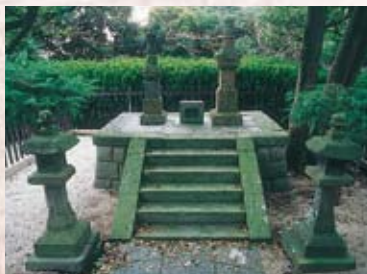
三浦安針墓 William Adams' grave

もうひとつ、『新編相模国風土記稿』には「安針は朝鮮の人。日本に帰化して三河に住み、砲術を得意にし、その術を諸士に伝えている」とあり、『相中留恩記略』に近い記述もあるのですが、その後に『長崎大 たいき 記』や『長崎実録大成』などを引用して、イギリス人であることを説明しています。