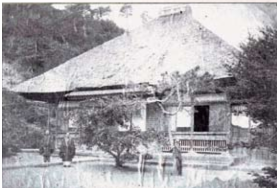
ウォルターズが1872年に撮影した浄土寺 (写真提供：浄土寺) Jodoji Temple, photographed by James Walters in 1872 (photograph property of Jodoji Temple)

Excited, Walters proceeded to Jodoji, where the high priest showed him to Adams' grave. The high priest also reported that other foreigners had visited the site before, and one had even made sketches of the surrounding area.