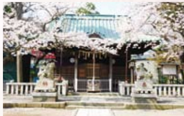
アダムの屋敷跡とされる鹿島神社 Kashima Shrine, built upon the approximate site of Adams' home

Opinions are divided as to why Ieyasu selected Hemi for Adams' fiefdom, but we can be sure it was related to Uruga's position as the only trading port in Eastern Japan. There is also a place in Uruga long called the Anjin Yashiki, so it is possible that Adams moved back and forth between Uruga and Hemi.