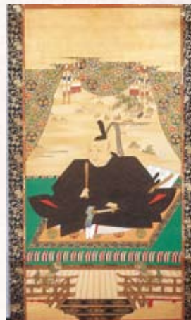
東照大権現像（徳川家康像） （財団法人 徳川記念財団蔵） The statue of Toshō Daigongen, or Tokugawa Ieyasu (property of the Tokugawa Memorial Foundation)

The Catholics eventually saw that no matter how they tried to ruin the highly resourceful Adams, nothing would break Ieyasu's trust in him. When they came to this realization, they changed their minds without turning a hair and began trying to ingratiate themselves with Adams, desiring merely to make a favorable impression on Ieyasu. Thus, Adams' position as Ieyasu's diplomatic counselor continued secure.