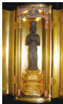
念持仏 アダムズが持ち歩いたといわれる。(浄土寺所蔵) The Nenji Butsu, said to have been carried by Adams (property of Jodoji Temple)