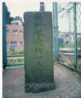
安針塚への道標 (大正時代に設置。写真は J R 横須賀駅前のも。他に 2 基あり。) Sign for Anjinzuka (Erected during the Taisho era. In addition to this sign in front of JR Yokosuka station, there are signs in two other locations.)

Adams' tomb, Anjinzuka, is said to be built in adherence to his last will and testament, which requested burial in a high place with a view of Edo, that he might continue to repay the shogun's kindness and to watch over Edo even after his death.