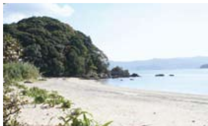
リーフデ号が漂着した臼杵市佐志生の浜と黒島 Usuki City, where the Liefde drifted ashore: Sashiu Beach and Kuroshima Island

リーフデ号が日本へ漂着したのは、1600年4月19日でした。これは西洋の旧暦の日付であり、新暦では4月29日、和暦では慶長5年3月16日となります。日本では関ヶ原の戦いの半年ほど前のことでした。