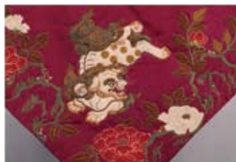
按針町から寄進された打敷（浄土寺所蔵） An uchishiki (ceremonial cloth spread in front of a Buddha statue) dedicated from the people of Anjin-cho (property of Jodoji Temple)

このように按針町の人々が、外国人であった三浦按針を、かくも長きにわたって敬意と感謝を捧げ続けたのには、ある理由があったと思われます。