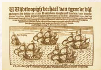
リーフデ号ほか4隻の商船団 リーフデ号は右下

The Liefde and its accompanying fleet of four commercial vessels, with the Liefde on the lower right