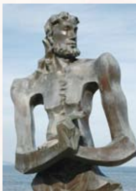
静岡県伊東市にある アダムズの胸像 Bust of Adams in Ito City, Shizuoka Prefecture

この話について『相中留恩記略』 そうちゅうりゅうおん きりやく には、アダムズが「砲術に妙を得、その術を諸士に相伝す」とあり、これによって家康に はいまつ 拝謁し、逸見に領地をもらうことになったと記されています。