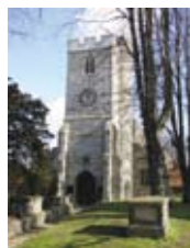
アダムズが洗礼を受けた聖メアリー・マグダレン教会 Saint Mary Magdalene Church, where Adams was baptized

三浦按針の故郷、ジリングラム市と横須賀市は1982（昭和57）年4月8日に姉妹都市提携をしました。その後、ジリングラム市がロチェスター市ほかと合併し、メッドウェイ市となり、再度、1998（平成10）年8月26日に姉妹都市提携を結びました。旧ジリングラム市との姉妹都市提携から、2012（平成24）年で30周年になります。