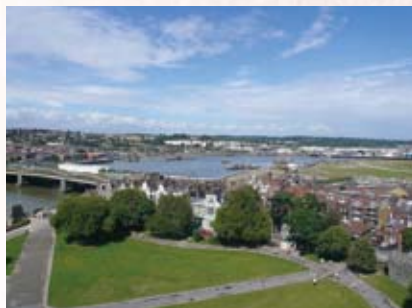
ジリングガムの風景 (現メッドウェイ市) View of Gillingham (current Medway City)

The Liefde alone eventually drifted ashore in Usuki, Oita Prefecture. Some believe the arrival here was not accidental but planned; in any case, by good fortune Adams arrived in the country he had decided upon during the voyage as his destination.