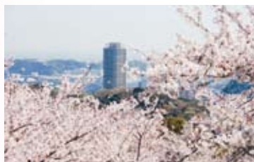
桜の名所ともなっている塚山公園 Tsukayama Park, famous for its cherry blossoms

塚山公園では第2次世界大戦前から、毎年「按針祭」が行われていましたが、1935（昭和10）年頃から中止となりました。戦後は1948（昭和23）年6月に復活第1回按針墓前祭を行い、以後、横須賀市ではアダムズの業績をたたえ、四大国際式典の一つとして、毎年4月8日に「按針祭」を開催しています。