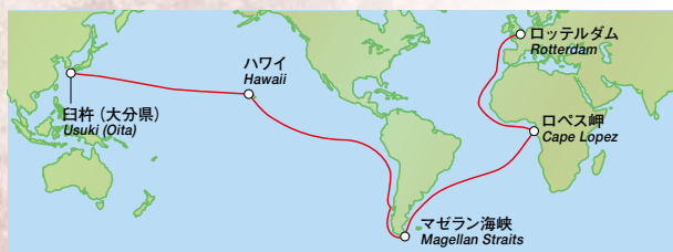
リーフデ号の航路 The route of the Leeufde

リーフデ号が大分県 うすき の臼杵に着いたのは漂着ではなく、来航であったという意見もありますが、運良くたどり着いた場所が、航海の途中で目的地とした日本であったという表現が正しいのではないのでしょうか。