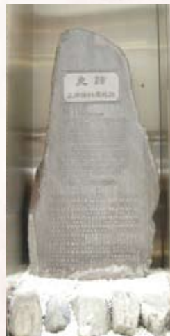
日本橋にある 三浦按針屋敷跡の記念碑 Memorial stone at the site of the Anjin Yashiki in Nihonbashi

In the diary of Richard Cocks, captain of the British trading post, we find that Adams had between 80 and 90 laborers as retainers, and that he was the first foreigner to be awarded a fiefdom in Japan. It is also written in the Shinpen Sagami-no-kuni Fudokiko that his home in Hemi lay south of Jodoji Temple.