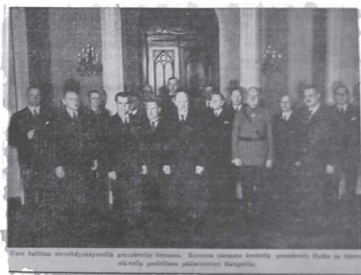
Kansan Lehti 9.1.1941