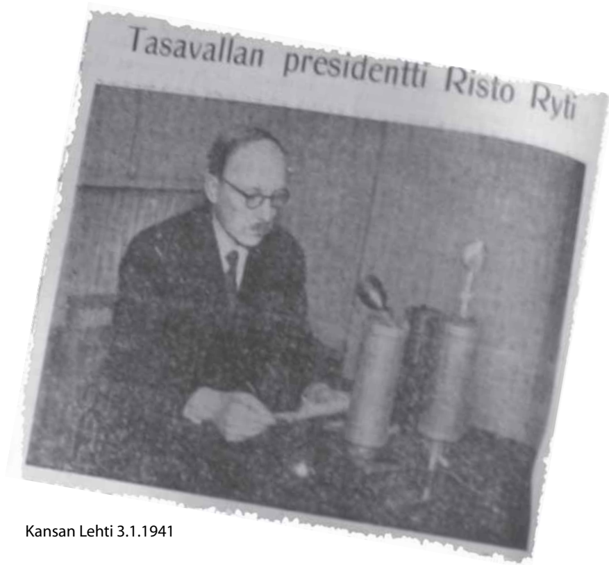
Kansan Lehti 3.1.1941