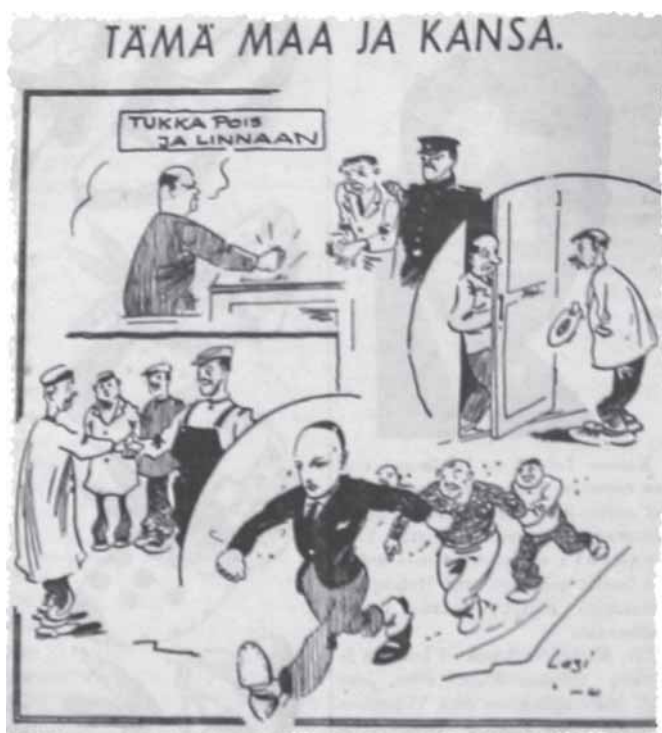
Kansan Lehti 20.5.1941

Poliitikko Rytin päätösten takaa on löydettävissä lähes aina talousmies Rytin perustelut eri päätöksille. Varsinkin erilaisissa talouskomiteoihin liittyvissä asioissa Rytin kannat on kirjattu ylös moneen kertaan. Unohtaa ei kuitenkaan saa Suomen sodanaikaista riippuvuutta Saksasta – varsinkin elintarvikkeista – ja sitä, että rauhaa etsittäessä aina varmistettiin viljatoimitusten saaminen joltakin muulta taholta kuin Saksasta. Ryti pohti tarkoin myös näitä tekijöitä yhdessä poliittisten tekijöiden kanssa. Viimein rauhanneuvottelujen käynnistyttyä todenteolla, tämä asia oli hoidettu yhteisymmärryksessä Ruotsin kanssa. Taloudelliset aspektit olivat siten läsnä vahvasti koko sodan ajan.