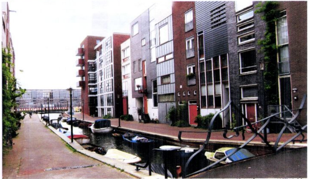
Seranggracht Amsterdam

'Een gevelsteen moet iets zeggen over jezelf'