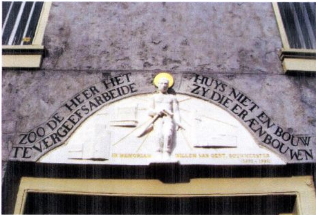
Gevelsteen Toon Rijkers (2012) Zoo de Heer het huis niet en bouw, Varkensmarkt 1, Amersfoort.

Recent werk van de Wageningse beeldhouwer Toon Rijkers was in deze rubriek al eerder te zien. In een monumentaal pand in het centrum van Amersfoort werd op 7 mei j.l. een nieuwe steen van zijn hand onthuld. Hij geeft er zelf een toelichting bij.