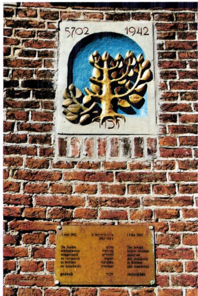
Gevelsteen Herman van Elteren (2005) Nieuwe Steeg, Monnickendam.

Geraadpleegd: Harry Voogel (2003) Huizen en Gevelstenen in Monnickendam . Uitgave van Vereniging Oud Monnickendam. www.maastrichtsegevelstenen.nl wiki.theaterencyclopedie.nl