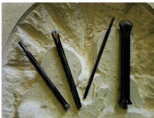
Verskillende rondgeslepen cesseels (foto HtM)

In mijn tijd als leerling en uitvoerder, vijftig jaar geleden bij de Amsterdamse Stadsbeeldhouwer Hildo Krop, gebruikten we vrijwel alleen het puntijzer als beitelmee te hakken. Die beitels werden nooit geslepen want dat was zonde vanwege het verlies aan materiaal, maar om de paar we-