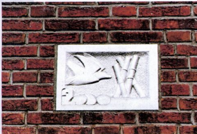
Gevelsteen Ria (2000) Seranggracht 10, Amsterdam

Aansluiten bij de sfeer van de Amsterdamse grachten met hun verscheidenheid aan burgerhuizen die samen toch voor een groots geheel zorgen, was in 1995 het uitgangspunt van het masterplan van Sjoerd Soeters voor het Java-eiland. De Seranggracht is een van de dwarsgrachtjes met individuele grachtenhuizen die het haveneiland doorsnijden. Op nummer 10 zorgt een gevelsteen voor extra individualiteit.