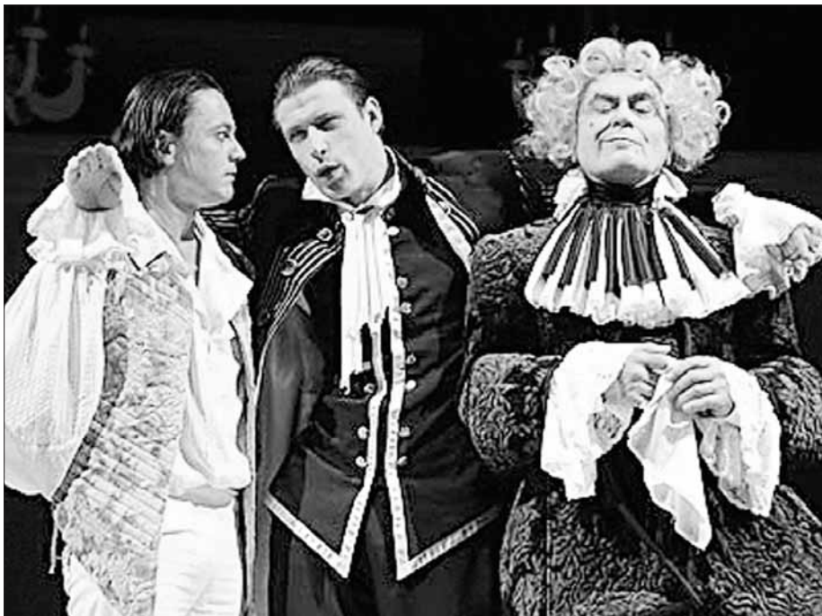
A Figaro házassága jelmeztervezőjeként Merő Béla rendezővel dolgozott együtt

– Egyszer nyilatkozta, hogy nem szereti a művészeti világban uralkodó trendeket, mert ez könnyen együtt jár a más módon utat kereső művészek elmellőzésével.