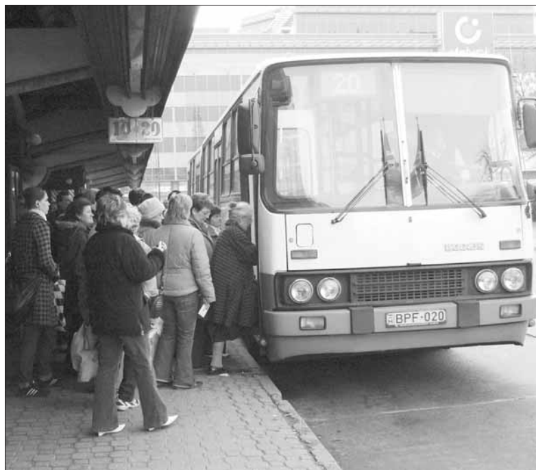
Az utasok is szeretnék, ha a 20-as járat sűrűbben közlekedne