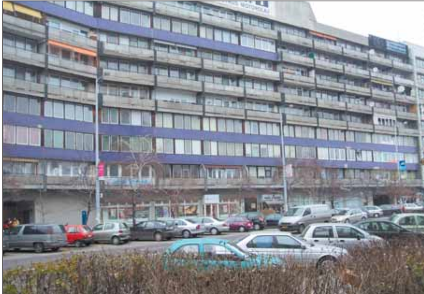
Az épület aligha lenne nyerő egy ház-szépségszeresenyen

Zajlik az élet a Szalagházban. Egy fiatalasszony kislányával most száll be a liftbe, hogy az egyik felső emeletig utazzon. Mialatt zúg a felvonó, elmondja: szeret itt lakni. Más házakhoz képest a Szalagban mérsékeltbbek a kiadások. Átalánydíjas