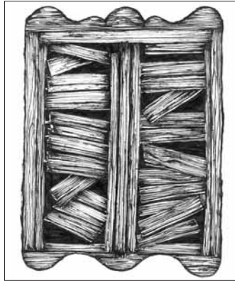
Grafika: Kádasi Laura

A világ, amelyet ti álmodtok, és amelynek megvalósításán fáradoztok életteret és rettenetes. A ti világotok fogja elhozni az új borzalmakat – de erről majd később. Most először erről a „nemzet mondunk a szocializmusra” nevű kampányról. Tudod János, ha lenne kedvem és időm, szívesen beszélnek most arról, hogyan lettetek ti gazdagok. Milliárdosok. Te és a volt főnököd, harcostársad, akit szintén gyűlölök. Beszélnek arról, hogy ti az állam – bizony János, az ALLAM! – pénzén lettetek azok, amik. Állami pénzeket, ingatlanokat nyúltatok le, felhasználva a régi, pártállami kapcsolatokat. Te, aki egyházi középiskolában végeztél, végül a KISZ KB zsozsóján és tagjain lettél „nagy”... Illetve, hát ilyen kicsi. Ilyen morális törpe. Ilyen moral insanity. Állami pénzek, ingatlanok, kapcsolatok nélkül, az Apró-klán (ez a mi Cosa Nostránk!) segédleme nélkül ti semmik sem lennétek. Ugyanis tehetségetek, az egyetlen valódi tehetségetek csupán a gátlástalanság és az erkölcstelenség, valamint a lenyűgöző