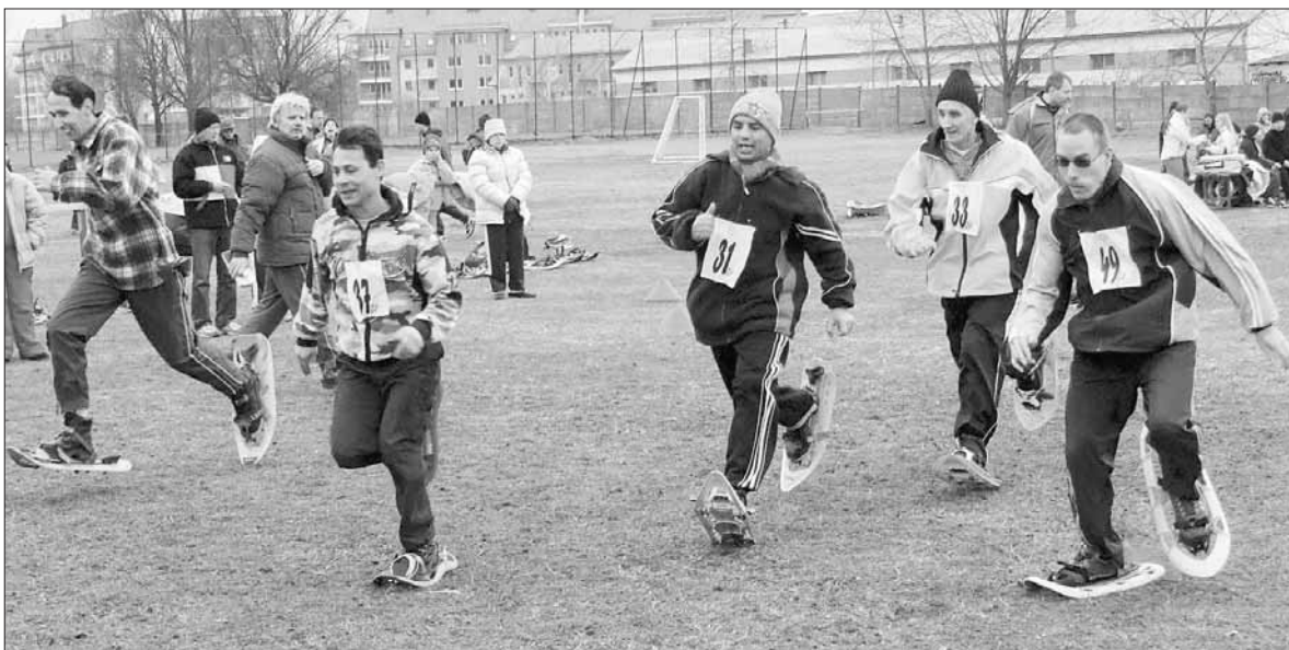
A házigazda Humán Rehab SE versenyzői összesen huszonhárom érmet szereztek

A versenyt Jády György, a Magyar Speciális Olimpiai Szövetség országos igazgatója nyitotta meg. A nyolc csapat hatvan versenyzője természetesen a nem mindennapi időjárás ellenére is felvette a különleges futótálpakat, és mindhárom távon – ötven, száz és kétszáz méteren – összemérte tudását. A házigazda egyesület tizenhat futója kiállóan szerepelt. A lányok az ötven méteres távon két arany- és két ezüst-, száz méteren két arany-, há-