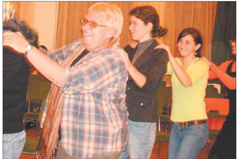
Nemcsak tanultak, barátságokat is kötöttek a program résztvevői

A hallgatók háromfős csoportokba dolgoztak úgy, hogy mindhárman