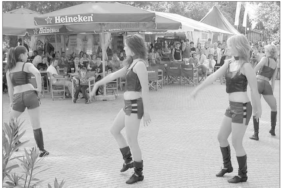
Ez még nem a többmillió haszon ünneplése, felvételünk a Gólsátor megnyitóján készült