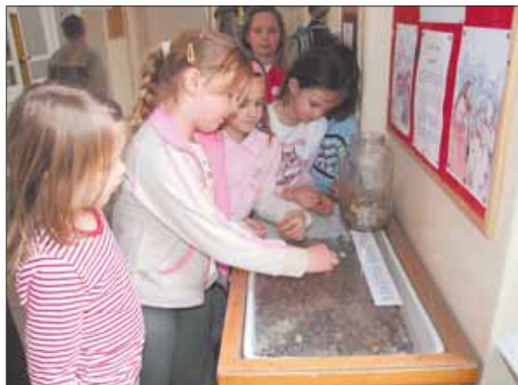
A Szent Imre Általános Iskolában jótékony célra gyűjtenek