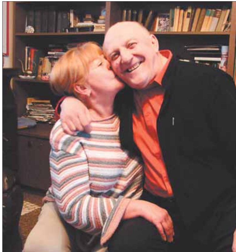
Harmincöt év házasság után is szeretetben élnek

– Amikor annak idején a televízióban a reklámok kezdtek megjelenni, sok színész hevesen tiltakozott az effajta szereplés ellen, mondván, hogy az nem művészi feladat, szó-