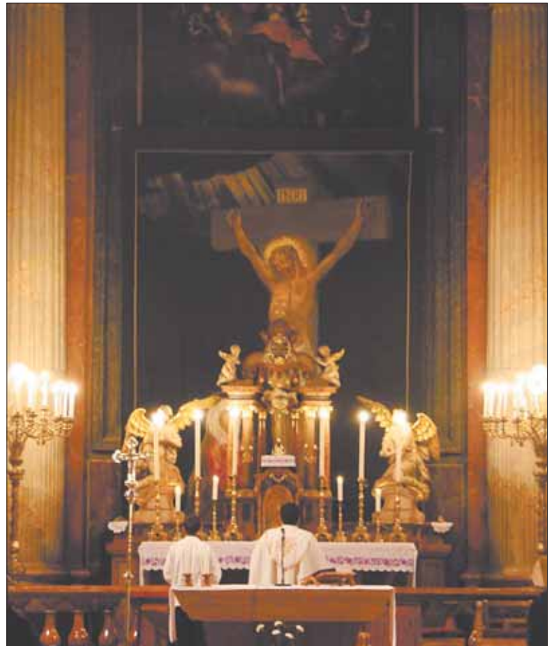
Hamvazószerda előestéjén húzták fel a böjti leplet a Nagytemplom oltáránál

A római katolikus egyház előírásai szerint a templomokban az oltárt nagyböjti lepellel szokás letakarni, amely legtöbbször a keresztre feszített Jézust ábrázolja – ez is a bűnbánati időre emlékeztet.