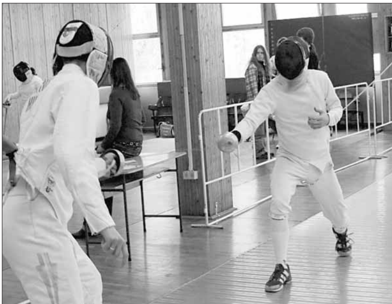
Egyre sikeresebbek városunk vívói

– Habár a hivatalos bejegyzésünkre csak 2006-ban került sor, első igazán nagyszabású versenyünket már 2005-ben megrendeztük, I. Összefgyvernemes Felnőtt Vidék Vívóbajnokság néven, a szövetség támogatása mellett. Erre a versenyre összesen tizenhat csapat kilencven indulója nevezett. Mivel a KTE kereitei közt nem voltak megteremthetőek a magasabb szintű vívómunka feltételei, ezért 2005 szeptemberében az edzőmunkák az Angolkisasszonyok Ward Mária Leánygimnáziumának tornatermében folytatódtak, már önálló egyesületi formában. Elismerésünket jelzi, hogy az elő-