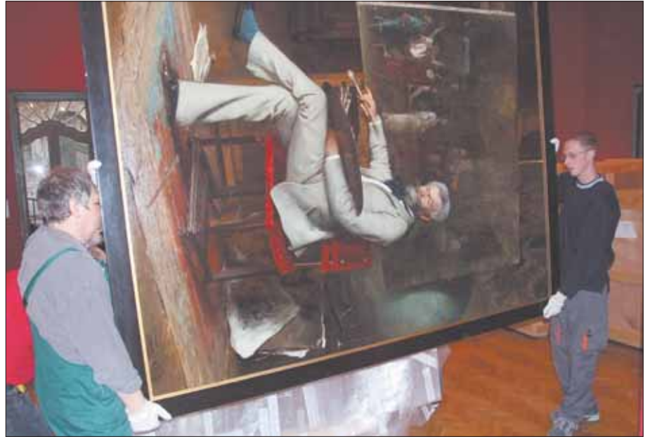
A kiállítások darbjai a hét első napjaiban érkeztek Kecskemétre

A Pákh Imre tulajdonában lévő harmincnégy kép mellett a Katona József Múzeum, a Nemzeti Galéria és a békéscsabai múzeum két-két Munkácsy-képe is a látogatók elé kerül február 15-étől. A néhány nap múlva nyíló kiállítások darbjai a hét elején érkeztek Kecskemétre, köztük mintegy negyven darab korabeli Mun-