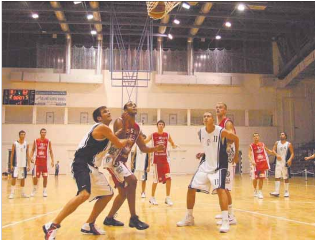
Az ősszel kétszer is sikerült legyőzni a szolnokiakat, most triplázásra készül a Zsoldos-legénység

sodosztályú veszprémiekkal szemben egyértelmű elvárás is volt. A hét győzelemmel és nyolc vereséggel a nyolcadik helyen tanyázó Univereseknek sem volt könnyű dolguk a szerdai játéknapon, amikor a kilencedik helyezett Sopron otthonában léptek pályára. A lapzártánk után kezdődött találkozó kimenetele nagyban befolyásolja a szombati mérkőzést is, hiszen a nyolcadik helyért küzdő Kecskemétnek semmiképp sem fér bele két egymás utáni vereség a mérlegbe, nem túlzás tehát azt állítani, sorsdöntő hét ez az Univer együttese számára. Szerencsére sé-