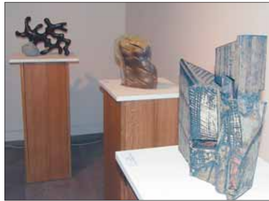
MUSEION No. 1., vagyis a Múzsák kertje a IX. kerületi Üllői úton