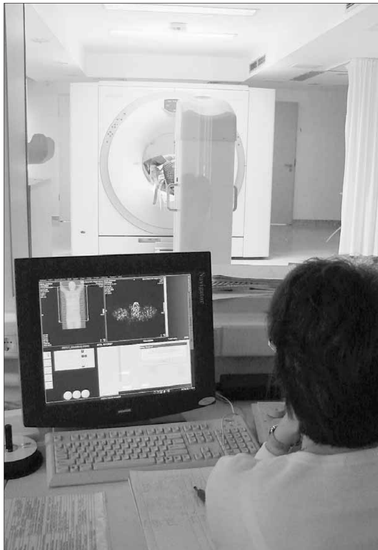
Pontos képet kaphatnak az orvosok a daganatokról a PET/CT segítségével

a meghatározott terápiás protokollja, ami segíti az orvosok munkáját – ettől egyedi esetekben természetesen eltérhetnek. Akinél egyébként rákot diagnosztizálnak, annak ingyenesek a vizsgálatok és kezelések, nem kell vizitdíjat fizetnie, és a gyógyszereket is térítésmentesen – esetleg dobozdíj ellenében – kapja.