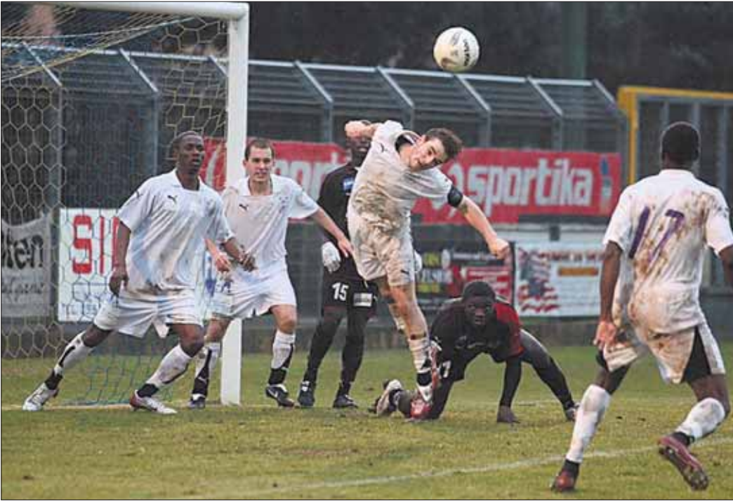
Az újpestiek olaszországi edzőtáboruk után Kecskeméten lépnek pályára

Szombaton Magyarország egyik legerősebb együttesével, az Újpesttel mérkőzik meg a KTE labdarúgócsapata. A 13 órakor kezdődő felkészülési találkozó remek erőfelmérőnek ígérkezik, és a Honvéd ellen látottak alapján bizony nem esélytelenek Némediék. Az elmúlt hétvégén Békéscsabán, a III. Láza János műfüves emléktornán szerepeltek focistáink, ahol a Belényesi Biharul SK (román III. o.), a Békéscsaba 1912 Előre SE (NB III.) és az Orosháza FC (NB II.) indult még. Az első mérkőzésen a házigazda Békéscsaba a Belényest legyőzve jutott a döntőbe, a második elődöntőben a KTE a rendes játékidőben 2-2-es döntetlent ért el az Orosházával szemben. Jöhettek a tizenegyesek, amelyben drámai izgalmakat követően a békés megyeiek bizonyultak