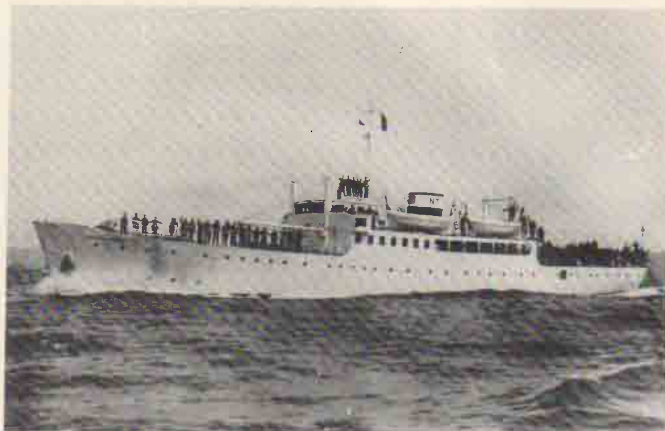
La motonave 'Giuseppe Orlando'

lando di Livorno, durante l'occupazione operaia, il piroscalo Cortellazzo al quale, inizialmente, fu dato nome Somarello dal maestro Pietro Mascagni.