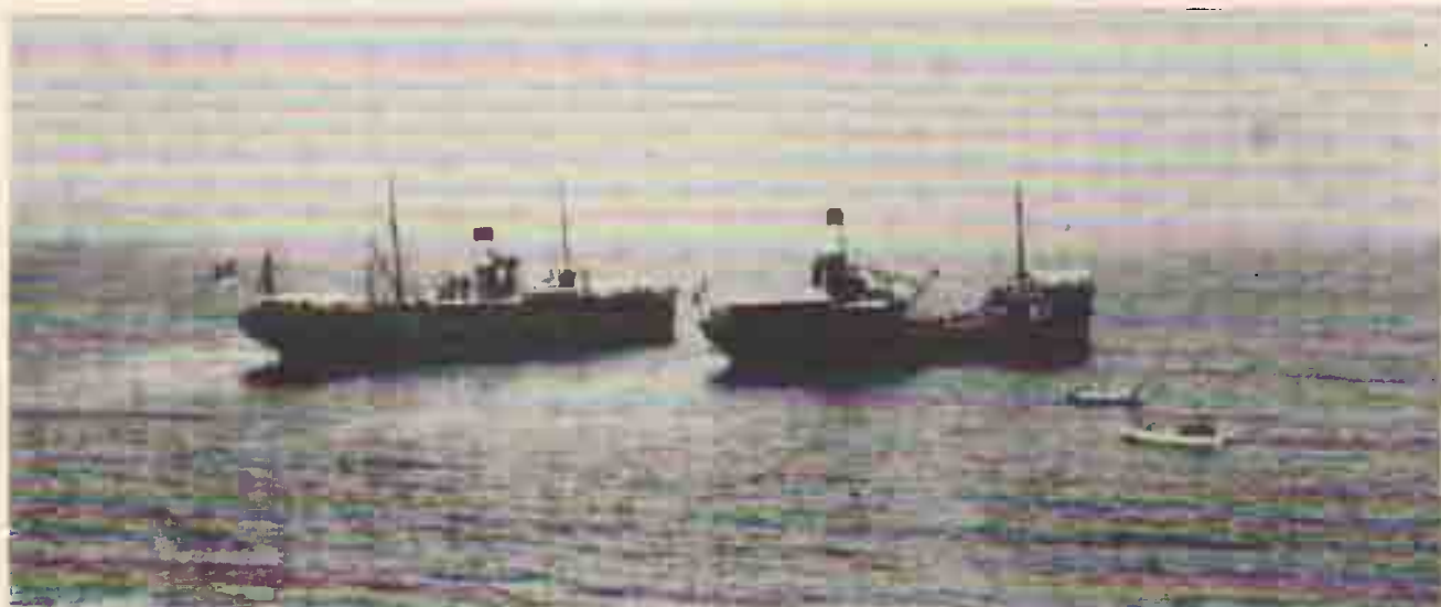
I piroscafi 'Cappellini' e 'Cortellazzo' in navigazione nel Canale di Piombino

L'On. Cassuto, Deputato del 1° Collegio di Livorno, giocherà un ruolo molto importante nei rapporti col Governo e col Parlamento per la causa dei trasporti marittimi anche se non riuscirà ad ottenere tutto quello che richiede. →