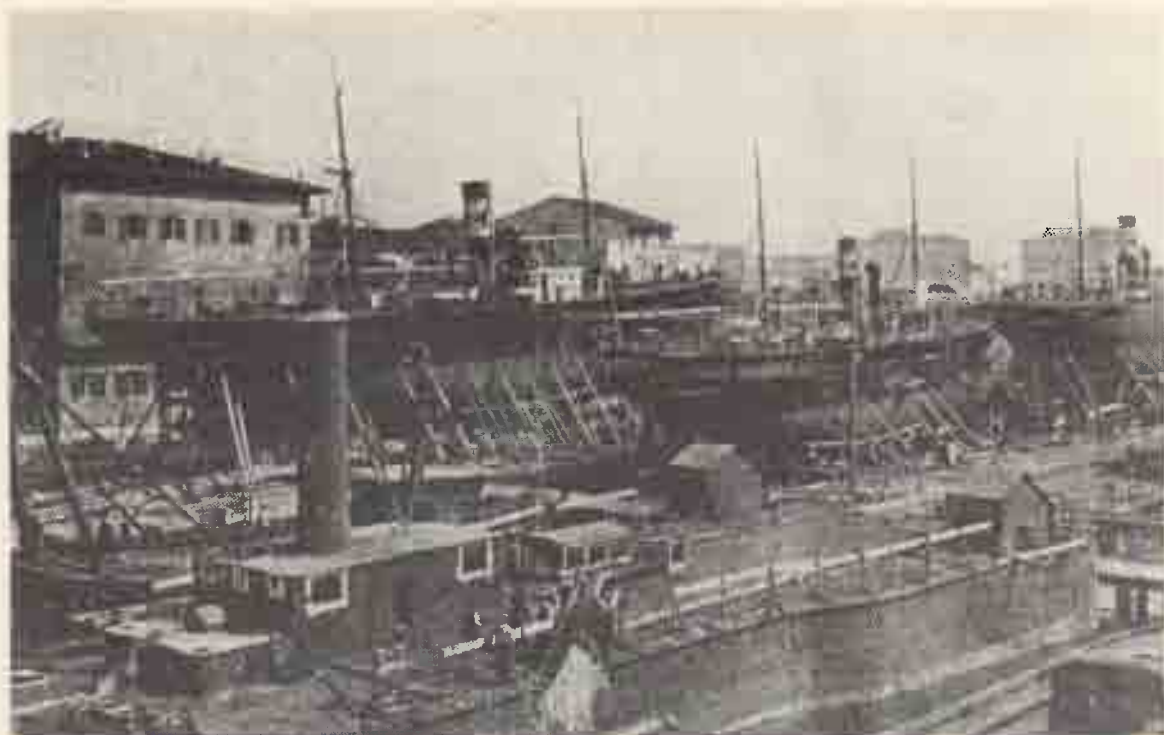
I piroscafi 'Cappellini', 'Guerrazzi', 'Elba II' pronti per il varo nel Cantiere Orlando di Livorno