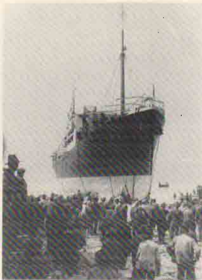
Il varo del piroscafo 'Elbano Gasperi' a Genova il 24 aprile 1928

È dovuta a lui l'elevazione, per legge, della velocità da 10 a 12 miglia orarie nella linea Portoferraio-Piombino, che rappresentò un risultato di tutto rilievo.