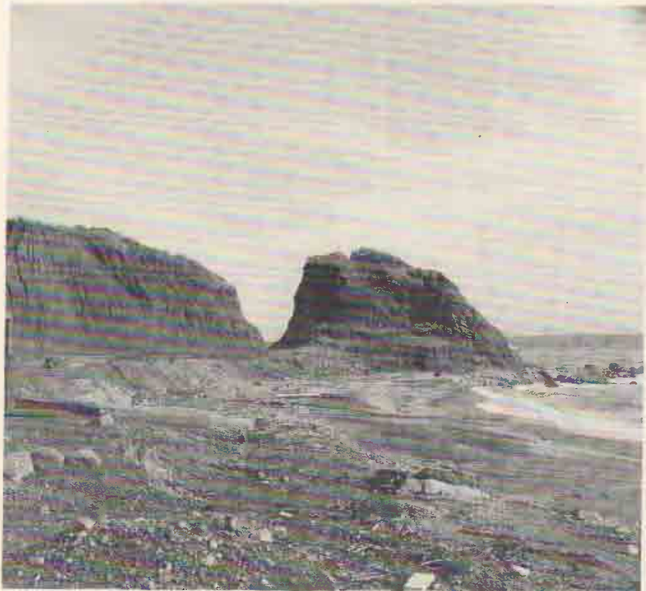
Miniera di Cala Seregola

operativo, il Parco garantirà un'attraente combinazione d'iniziative, abilmente dosate e integrate. Dalla fase di ricerca è emerso che lo sfruttamento di quarzite e calcare, impiegati nel calcestruzzo, sarebbe competitivo e potrebbe occupare una ventina di operai. L'asso nella manica, da giocare con meditata perizia, sembra però un altro e consente di guardare al futuro con una carica di ottimismo, avendo sbaragliato almeno sulla carta la temibile concorrenza straniera, segnatamente quella tedesca di Bochum, esclusa da questa opportunità. Che consiste, alle spicce, nel principio del "fai da te" applicato disinvolatamente alla miniera, senza dubbio l'aspetto più innovativo dell'intero disegno. Con gli stessi visitatori, studiosi e collezionisti, impegnati nella cerca e nello scavo per soddisfare l'antica passione, "minatori" in prima persona nel-