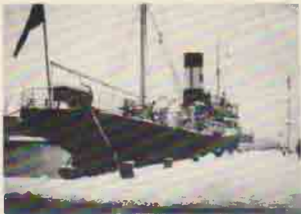
Il piroscafo 'Andrea Sgarallino' sotto una coltre di neve

La drastica decisione va collegata al fatto che fra le promesse avute da Roma per risolvere la vertenza sui collegamenti marittimi, c'era la garanzia che il servizio postale fra Portoferraio e Piombino dovesse essere effettuato da piroscafi capaci di percorrere 12 miglia all'ora e l' Elba II non era in grado di raggiungere tale velocità.