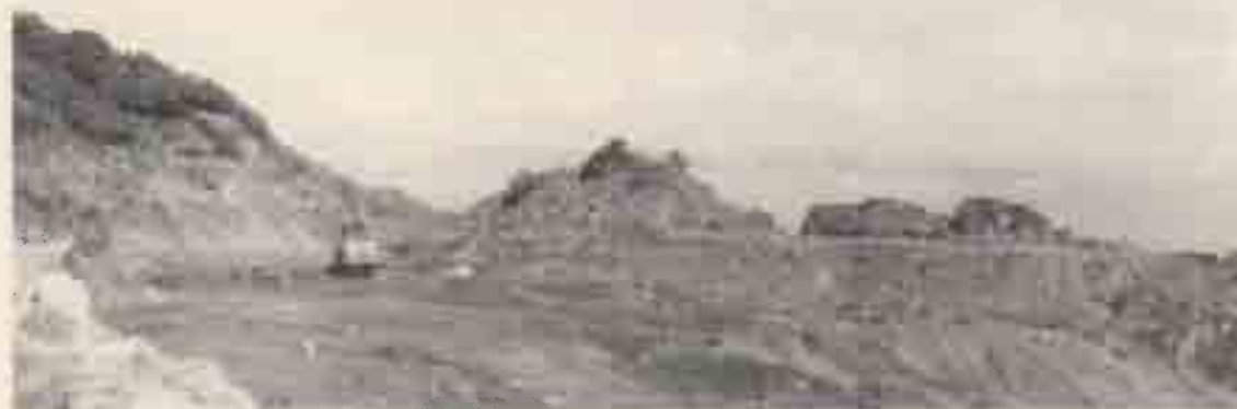
Miniere di Rio Albano

no le ville napoleoniche, usate come termine di paragone: con un flusso minimo di venticinquemila unità, riferito invece agli attuali permessi d'ingresso ai cantieri dell'Italsider. Le spese di avviamento, coperte con i fondi assegnati dallo Stato alla Regione Toscana, si aggirano sui cinque miliardi e comprendono le infrastrutture diffuse, viabilità interna, piazzole di sosta, segnaletica. Il Centro Congressi assorbirà altri quindici miliardi, da reperire mediante accordi di gestione col capitale privato. Costo d'esercizio, un miliardo e settecento milioni, imputabile largamente alla voce "Personale": 14 dipendenti stabili, 21 stagionali. Le entrate figurano calcolate in bilancio sulla presunta vendita dei biglietti d'accesso, senza escludere a priori cespiti straordinari, come sponsorizzazioni, lasciti, piccolo commercio di minerali e di oggetti ricordo.