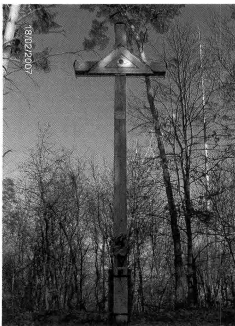
Zdjęcie nr 2 – Krzyż drewniany z „Okiem Bożym” na wzniesieniu Szurowa Góra