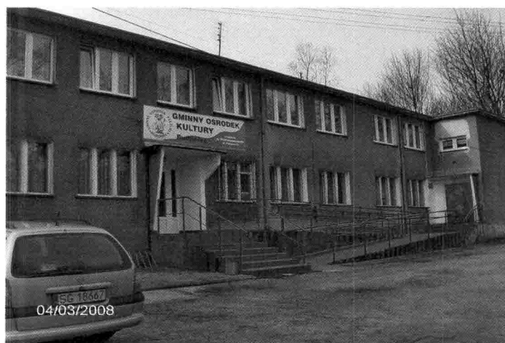
Zdjęcie nr 4 – Budynek Gminnego Ośrodka Kultury, w którym mieści się także filia Biblioteki Publicznej oraz Przedszkole