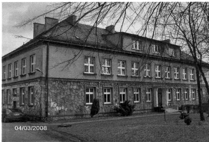
Zdjęcie nr 3 – Budynek Szkoły Podstawowej