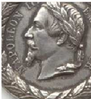
E.F. (non signé)

Pour les frappes privées, la barbichette de NAPOLEON III ne se trouve pas placée Pareillement sur la médaille. - BARRE et SACRISTAIN : avant le N de Napoléon - E FAROCHON : en face du N - FALOT : en face du A Cela permet d'identifier les frappes non signées