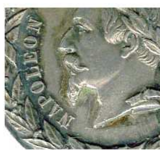
FALOT (non signé)