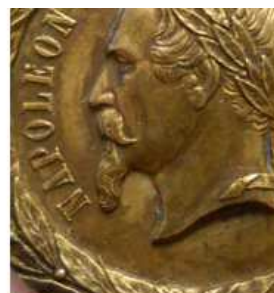
Sacristain (non signé)