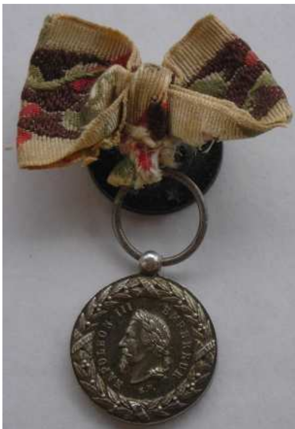
Modèle E.F. 18 mm avec ruban à bouffette.