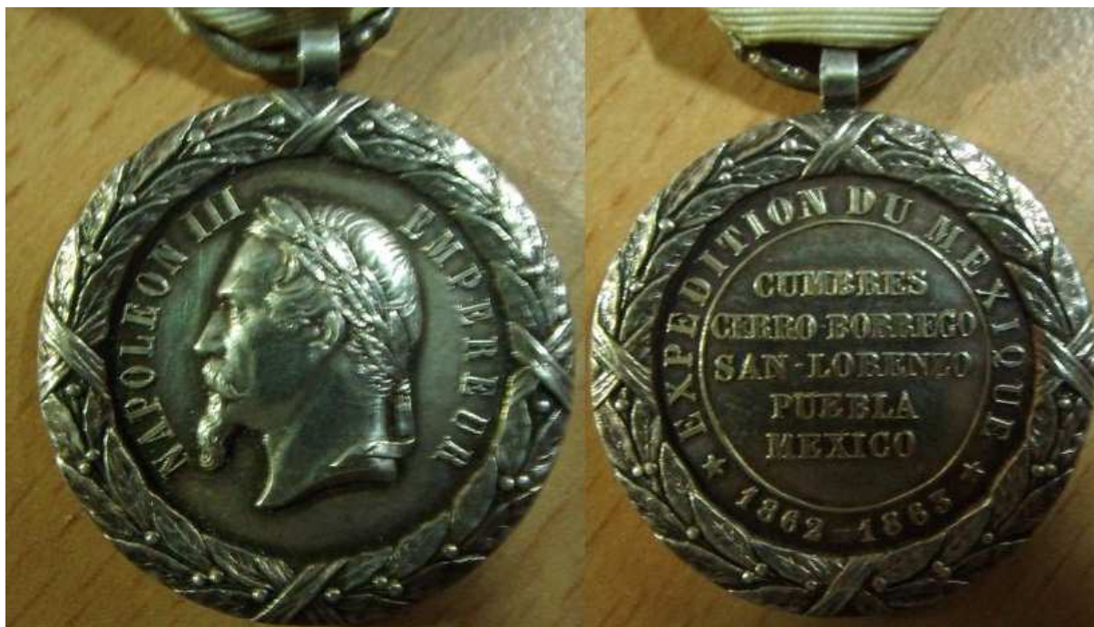
Modèle sans signature et sans poinçon. En argent. Modèle SACRISTAIN. Bélière courte (frappe n'étant pas d'époque ?).