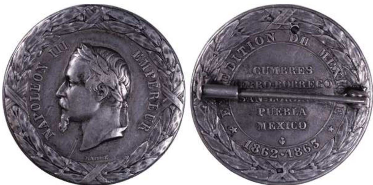
Jeton Barre monté en broche