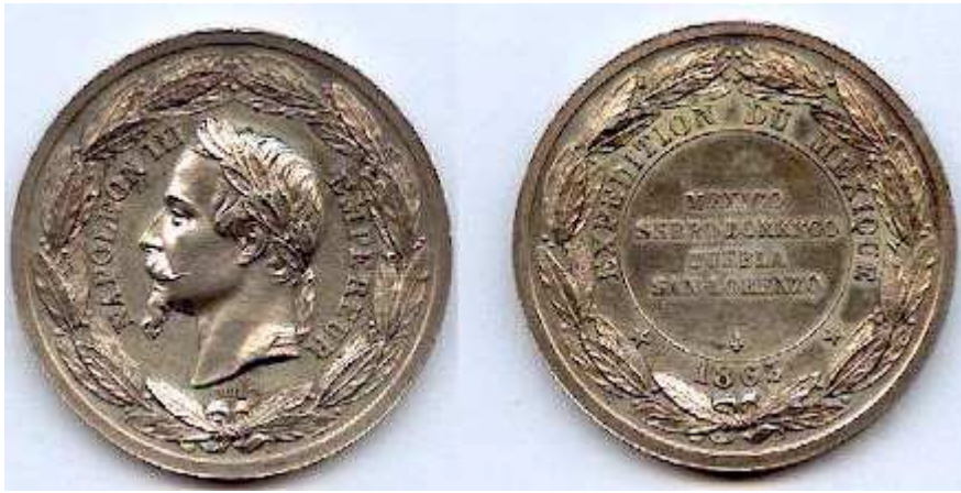
Essai de 30mm signé BARRE (Cussonneau)

L'ensemble était encadré d'une couronne de laurier.