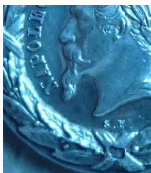
S.F T . (Sacristain)