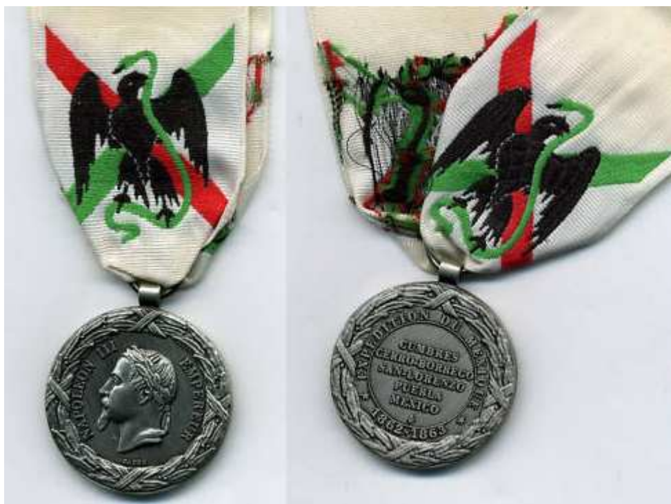
Une fois monté avec un ruban moderne...