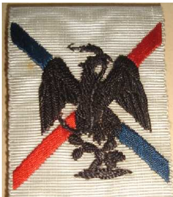
Modèle bleu et rouge

TELECHARGEMENT GRATUIT SUR WWW.FORUM-INSIGNES-MEDAILLES.NET