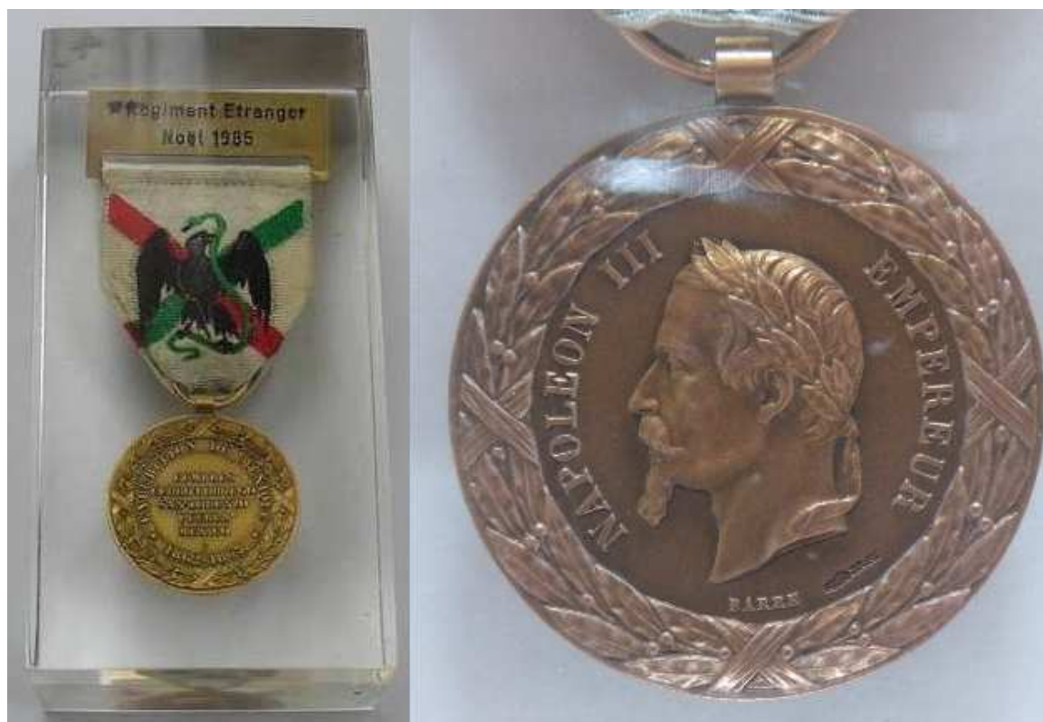
Inclusion 1 er RE – Noël 1985. Refrappe modèle Barre. Avers poinçonné Corne BRFL (Mdp).

TELECHARGEMENT GRATUIT SUR WWW.FORUM-INSIGNES-MEDAILLES.NET