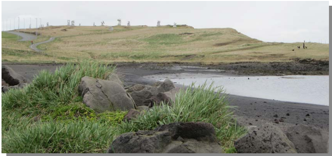
Við eiðið út í Geldninganes, fjær sést í höggmyndagarðinn.

Blikastaðakró, fjaran, fjörukamburinn og mjótt belti upp af honum er að mestu óspillt land hvað gróðurfar varðar. Í aðalskipulagi Reykjavíkur fellur strandlengjan frá Úlfarsá og vestur í Geldinganes undir hverfisverandarsvæði og svæði á Náttúruminjaskrá. Norðurjaðar golfvallarins liggur nálægt fjörinni (Heimild: Náttúrufar með Sundum í Reykjavík, 1999. Náttúrufræðistofnun Íslands).