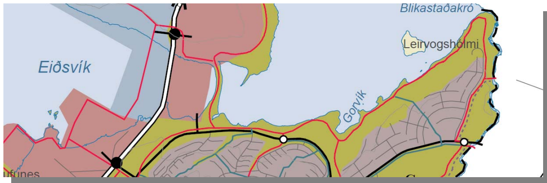
Aðalskipulag Reykjavíkur 2001-2024.

Í Aðalskipulagi Reykjavíkur 2001-2024 er svæðið skilgreint sem opið svæði til sérstakra nota. Stofnstígur liggur í gegnum allt skipulagssvæðið. Ekki er gert ráð fyrir að svæðið sem er merkt blönduð byggð í aðalskipulagi við Geldinganes sé hluti af skipulagssvæðinu. Geldinganes hefur ekki enn verið deiliskipulagt en aðalskipulagið segir til um að þar eigi að rísa blönduð byggð og hafnar- og athafnasvæði ásamt því sem Sundabraut á að liggja þar um. Gert er ráð fyrir stofnstíg sem liggur í gegnum eiðið út í Geldinganes.