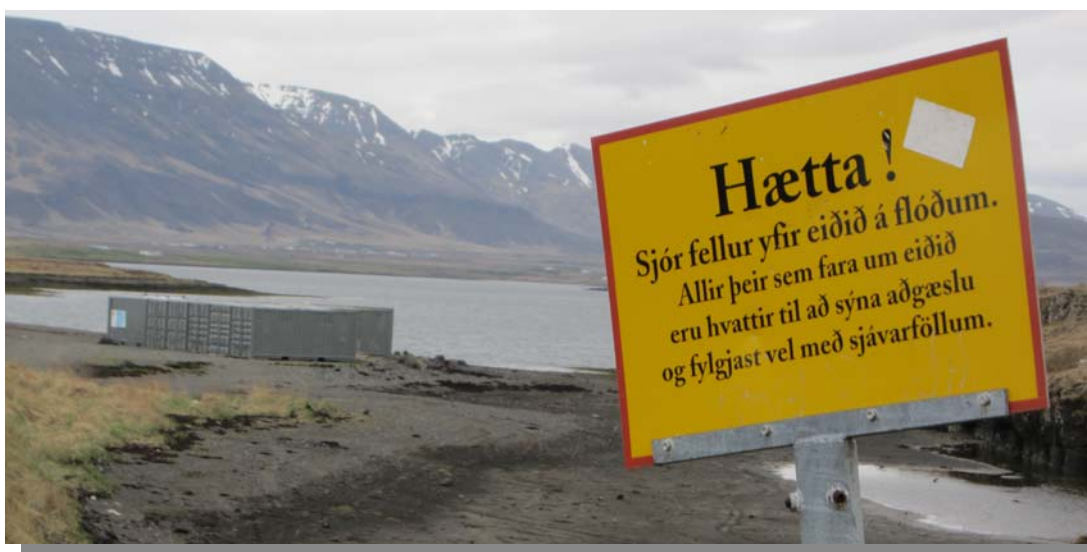
Við eiðið út í Geldinganes.

Eitthvað er af lögnum inni á skipulagssvæðinu en þó liggja þær að mestu meðfram Strandvegi og búið að tengja inn á nokkur svæði eitthvað af lögnum. Frárennslisæð liggur út í sjó úr Víkurhverfi við Gorvík. Rafmagn hefur verið tengt að svæði Kayakklúbbsins í gámana á eiðinu við Geldinganes. Kalt vatn og rafmagn er tengt inn á svæði skólagarðanna sem og í veiðihúsið við Blikastaðakró. Haft verður samráð við OR um lagnir og framkvæmdir því tengdu við vinnslu deiliskipulagsins.