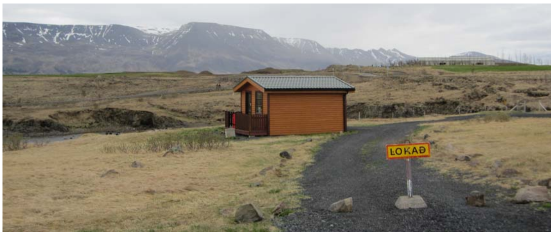
Veðiðhúsið við Korpu.

Veðiðhús er staðsett við Blikastaðakró, en það er ekkert landnúmer né stærð þess að finna í gagnasöfnum FMR né borgarinnar. Húsið er veðiðhús fyrir Úlfarsá (Korpu) sem rennur í sjó við Blikastaðakró. Í Korpu eru leyfðar tvær stangir (fyrir bæði maðk og flugu) og er veiðitímabil frá 01.07 – 20.09 ár hvert. Áin sjálf er 17 km. að lengd og fellur úr Hafravatni og veiðast að meðaltali ár hvert 210 laxar. Veiðihúsið sjálf virkar lítið, en þar er aðstaða til hvíldar og hressingar fyrir leyfishafa og er veiðimönnum skylt að mæta í húsið að morgni veiðidags og framvísa þar veiðileyfi sínu.