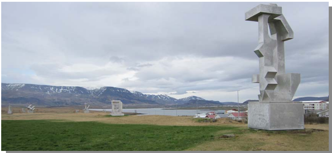
Hluti af höggmyndagarðinum í Gufunesi.

Höggmyndagarður er staðsettur vestast á skipulagssvæðinu, við Gufunes á um 14.700 m 2 svæði sem liggur að mestu frekar hátt í landinu. Hallsteinn Sigurðsson myndhöggvari hefur frá 1992 haft þar aðstöðu fyrir höggmyndir sínar og var samþykktur í Borgarráði 26.05.1992, uppdráttur um landstækkun skv. þeim leigusamningi sem gildir fyrir svæðið. Í dag eru núna staðsett 16 listaverk, minni og stærri sem sóma sér vel í umhverfinu. Stígur liggur í gegnum svæðið og er mikill hæðarmunur frá hæsta punkti og þangað til komið austur og út úr höggmyndagarðinum, er farið úr 35-36 m.y.s. niður í 18-19 m.y.s. – um 15 metra hæðarmunur.