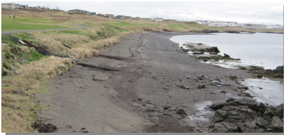
Við fjöruna neðan golfvallar.

Ströndin frá Blikastaðakró að odda Geldinganes er að mestu ósnortin. Svæðið er talið hafa mikið verndargildi vegna náttúru og fuglalífs og lífríkar fjöru einkenna svæðið. Öll strandlínan er skilgreind sem verndarsvæði og stefnt hefur verið að því að halda strandlengjunni óspilltri. Norðurströndin öll er skilgreint sem verndarsvæði, en slíkum svæðum skal halda óspilltum og eingöngu gerð aðgengileg fólki á látlausan hátt, s.s. með malarstígum og upplýsingaskiltum um sérstöðu þeirra út frá náttúru- eða minjagildi. Jafnframt skal halda öllum framkvæmdum í lágmarki á verndarsvæðum. Hins vegar þá eru öll opin svæði borginni skilgreind sem útivistarsvæði.