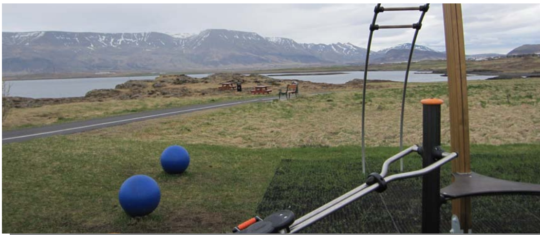
Trimmtæki við stíginn, fjær sést aðeins í nýlega nestisaðstöðu.

Trimmtæki hafa verið sett upp við stíginn meðfram ströndinni, ekki langt frá skólagarðunum og undirgöngunum undir Strandveg. Hafa þau nýlega verið sett upp í kjölfar íbúakosningar í Grafarvogi en þar var hægt að kjósa um þrjá flokka, þ.e. Umhverfi og útivist, Leikur og afþreying og Samgöngur. Í Grafarvogi var Umhverfi og útivist fyrir valinu og trimmtækin við stíginn eitt af því sem var gert. Einnig undir liðinn Umhverfi og útivist heyrði m.a. nestisaðstaða við stíginn meðfram ströndinni sem að sýnist við vettvangsskoðun, vera nýlegir bekkir ekki langt frá trimmtækjum (sjá mynd hér að neðan). Í sömu kosningum var óskað eftir drykkjarfonti við stíginn meðfram ströndinni, en skv. vettvangsferð þá virðist sem hann hafi ekki enn verið uppsettur en væri æskileg viðbót.