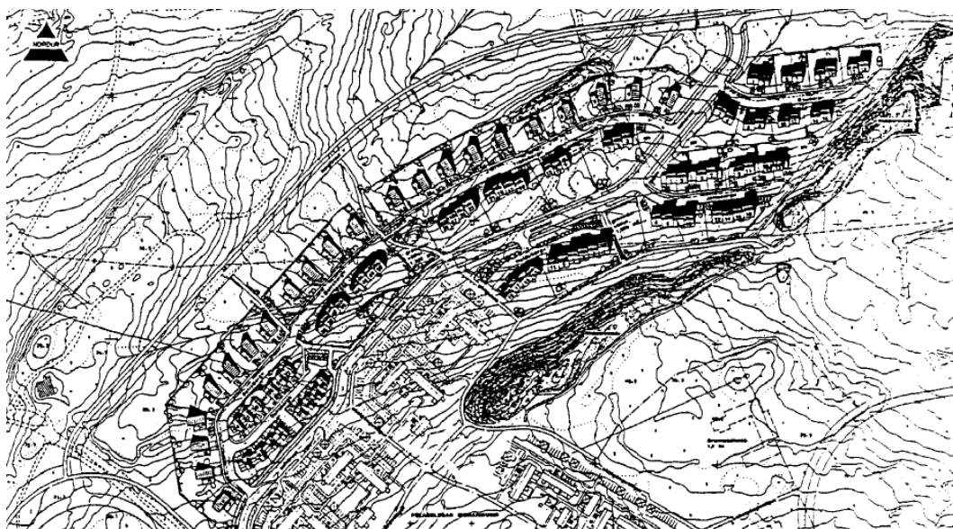
Borgahverfi E-H hluti, deiliskipulag samþykkt 19.04.94.