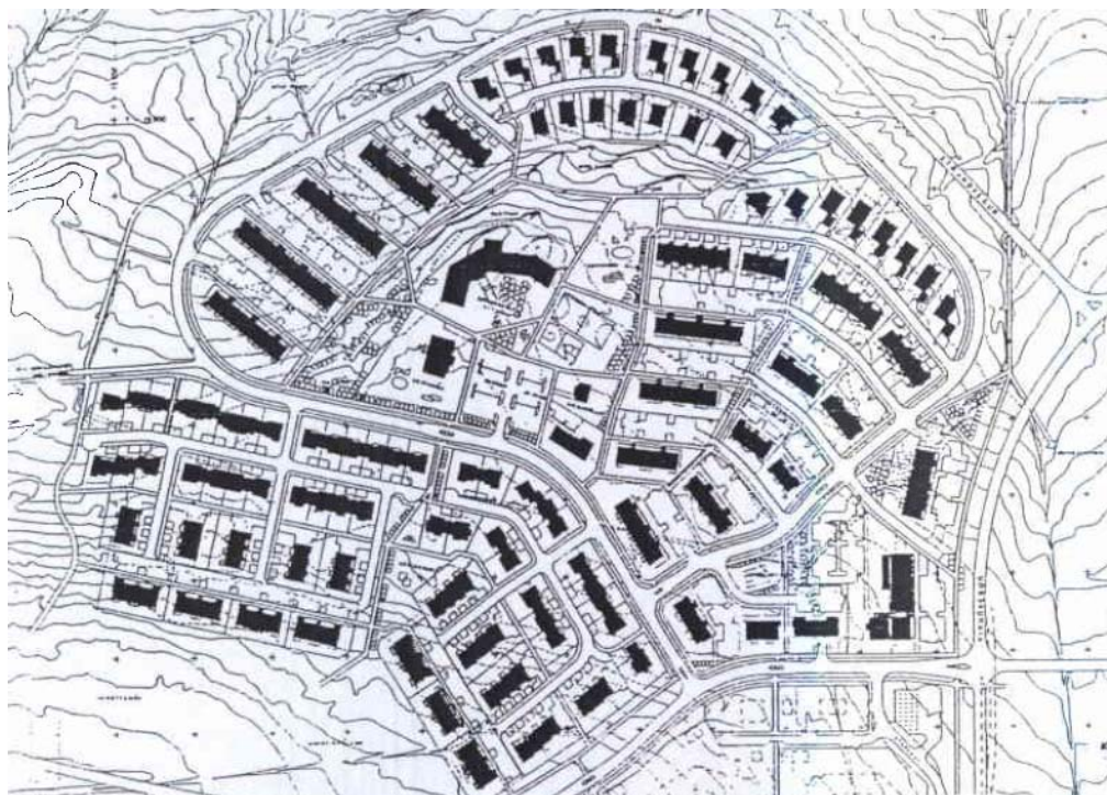
Víkurhverfi, deiliskipulag samþykkt 19.04.94.