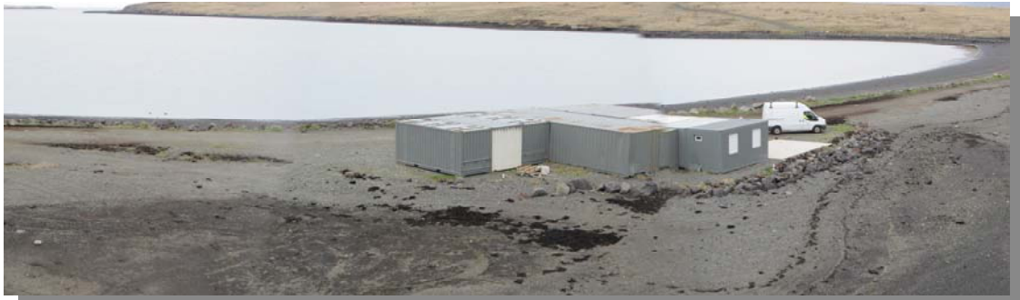
Kayakklúbburinn með sína aðstöðu á eiðinu út í Geldinganes.

Kayakklúbburinn er með aðstöðu í gámum á eiðinu út í Geldinganes til bráðabirgðar. Klúbburinn var stofnaður árið 1981 og er aðili að ÍBR. Starfsemin klúbbsins hefur vaxið með árunum og eru virkir félagar um 400, skv. heimasíðu félagsins. Klúbburinn hefur sl. 9 ár byggt upp aðstöðu sína á eiðinu út í Geldinganes þar sem hefur verið komið fyrir bráðabirgðaaðstöðu í formi gáma. Klúbburinn er einnig með aðstöðu í Sundlaugunum í Laugardal og Nauthólsvík. Í Geldinganesi er geymsluaðstaða fyrir 140 báta auk félags- og sturtuaðstöðu. Klúbburinn hefur bent á eftirfarandi kosti eiðsins fyrir kayakróður, t.d. stutt í fjölbreytt og fallegt róðrasvæði sem og skjólgott svæði sem auðveldar fólki að róa allan ársins hring