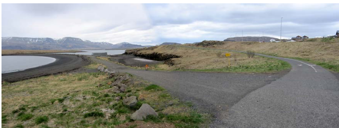
Við eiðið út í Geldinganes.

Akandi umferð er um svæðið á nokkrum stöðum. Mest umferð er við eiðið yfir í Geldinganes þar sem aðstaða fyrir Kayakklúbbinn er í dag og þverar hann stofnstíginn þar sem liggur austur-vestur. Einnig er hægt að leggja bílum við mjög bágborið bílaplan við svæðið þar sem listaverkin eru, ásamt því sem austast við Blikastaðakró er hægt að aka að veiðihúsinu. Við svæði skólagarðanna í Gorvík er malarborið bílaplan þar sem ekið inn af Strandvegi.