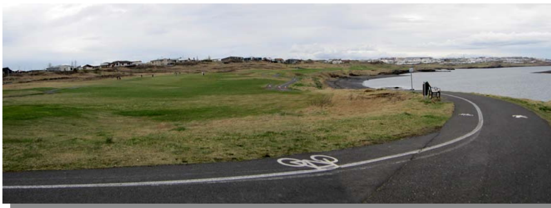
Stofnstígur við Blikastaðakró.

Stofnstígur liggur í gegnum allt skipulagssvæðið meðfram ströndinni og er mikilvægur hluti af tengingu stígakerfisins frá Mosfellsbæ og áfram suður Grafarvog í átt að innri borg. Töluverður hæðarmunur er frá vestri til austurs og munar allt að 30m frá umhverfislistaverkunum í Gufunesi að stígnum við Gorvík og meðfram ströndinni við Staðahverfi að Blikastaðakró. Stígurinn er malbikaður og í nokkuð góðu ástandi. Alls eru 11 bekkir á skipulagssvæðinu og ruslastampar við flesta þeirra. Góðar stígatengingar eru fyrir hendi inn í Staðahverfi á nokkrum stöðum og jafnframt eru þveranir inn í Víkurhverfi og Borgahverfi á nokkrum stöðum, auk þess sem eru undirgöng undir Strandveg rétt austan við svæði skólagarðana í Gorvík.