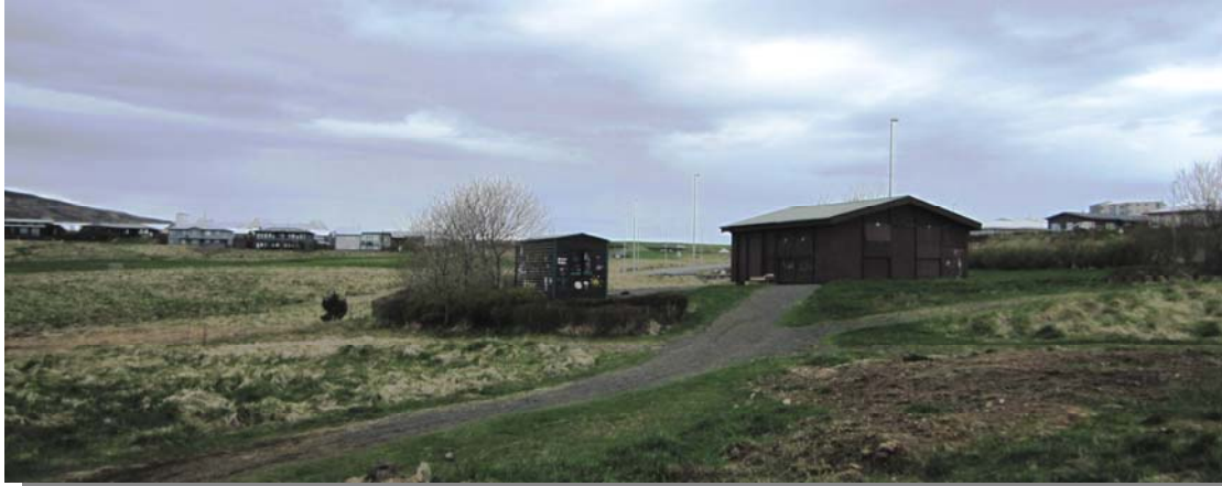
Skólagarðarnir í Gorvík við Strandveg.

Skólagarðar hafa verið starfræktir í Gorvík við Strandveg um langt skeið, en skólagarðar í Reykjavík verða ekki starfræktir sumarið 2011 eins og undanfarna áratugi. Í staðinn fyrir skólagarðanna verður fjölskyldum boðið að leigja sér svæði eða reit til að rækta matjurtir. Yfir 600 matjurtagarðir í Reykjavík verða leigðir almenningi þar sem skólagarðar voru áður, þ.á.m. í Gorvík við Strandveg. Markmið skólagarðanna hefur alltaf verið að kenna börnum umgengni við náttúruna og ræktun gróðurs, þar sem börnin fengu úthlutað garði sem þau báru ábyrgð á allt sumarið og í lok sumars fengu þau afrakstur erfiðis þegar þau gátu fengið að fara með grænmetið heim. Aðaláherslan var lögð á umhirðu garðanna og ræktun í samráði við leiðbeinendur, en einnig voru haldnir leikjadagar eða farið í ferðir. Aðstaðan í Gorvík eru tveir skúrar með aðgengi að köldu vatni og rafmagni, ásamt malarbornu bílplani.