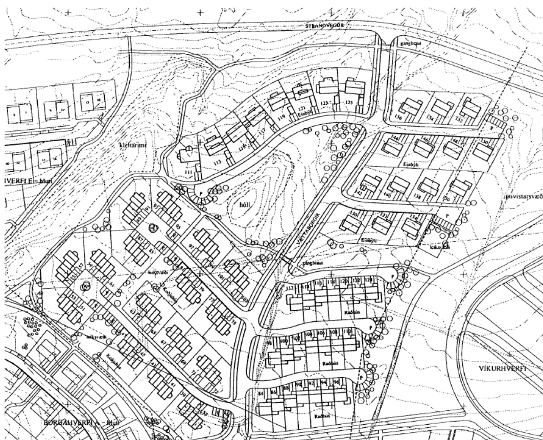
Borgahverfi B-hluti, deiliskipulag samþykkt 21.03.95.