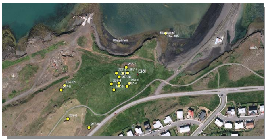
Mynd sem sýnir minjar við bæjarstæði Eiða.

Eitthvað er um mannvistarminjar og örnefni á skipulagssvæðinu og verður haft samráð við Minjavernd Reykjavíkur við gerð deiliskipulagsins. Bæjarstæðið við Eiði (sjá mynd hér að neðan) er það svæði þar sem mest er um minjar innan skipulagssvæðisins. Líklegt má telja að við ströndina í átt að sveitarfélagsmörkum séu litlar eða engar minjar og mun Minjasafn Reykjavíkur útbúa skýrslu um það svæði við gerð deiliskipulagsins.