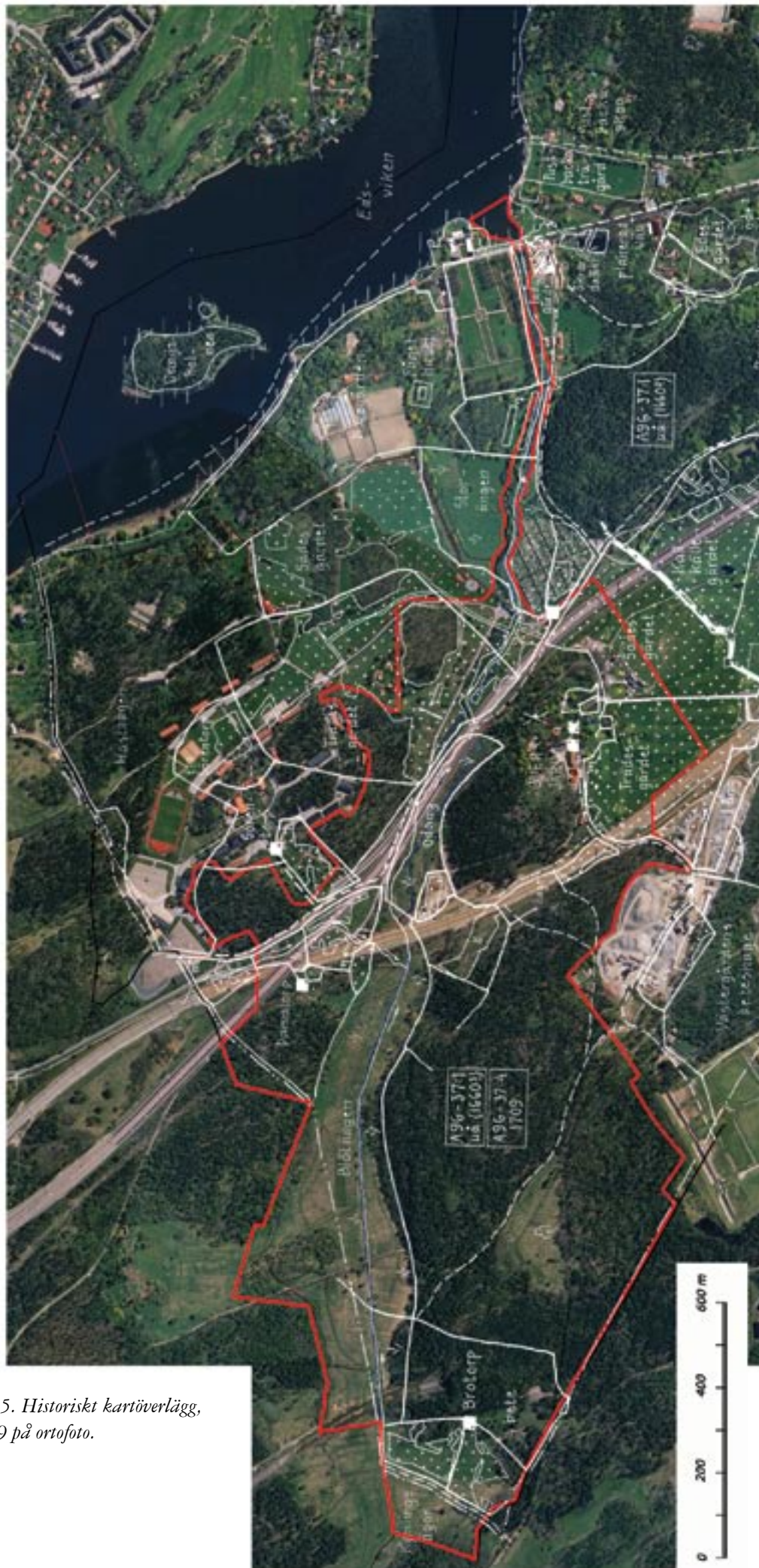
Fig. 5. Historiskt kartöverlägg, 1709 på ortofoto.