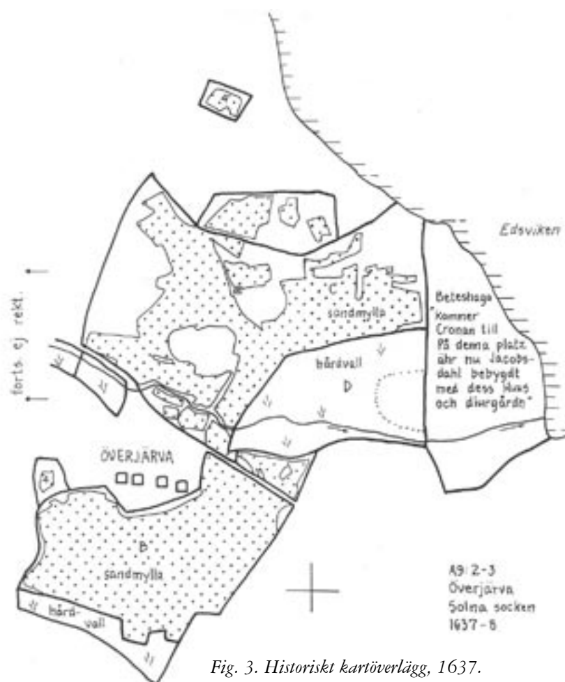
Fig. 3. Historiskt kartöverslägg, 1637. Upprättat av Ylva Othzén.