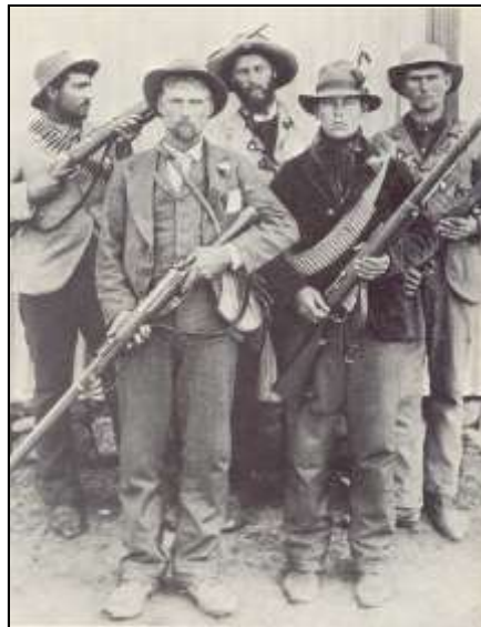
Afrikaner commando's van de 2 de Boerenoorlog

De juteweaverij van Charles De Zutter leverde in het begin van de 20 ste eeuw jutezakken e.d. voor de transporten naar Zuid-Afrika. Waarschijnlijk stond op die leveringen ook de naam 'Transvaal' geschilderd, vandaar de bijnaam van de fabriek.