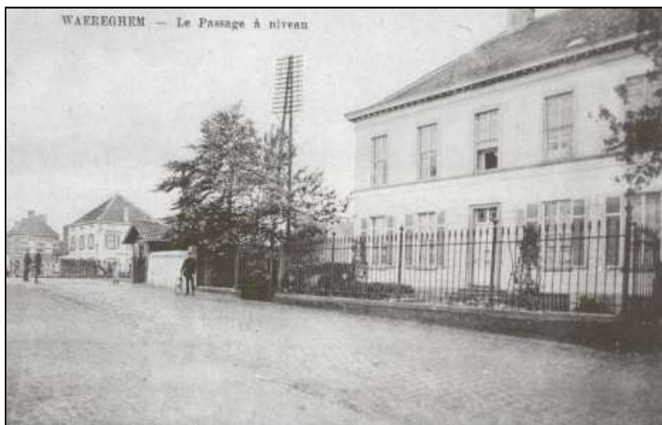
Villa Boulez, gezien vanuit de richting van Sint-Eloois-Vijve, met links de spoorwegovergang