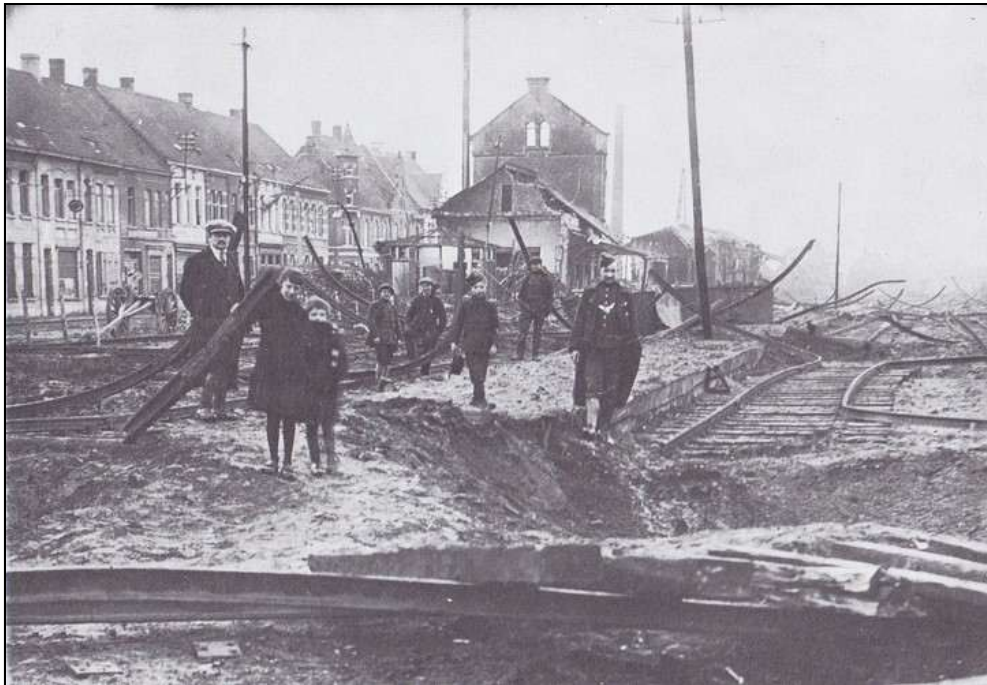
het verwoeste station in oktober 1918

We starten de wandeling op de pendelparking achter het station, in de Boulezlaan. Het eerste (goederen)station dateert van 1839. Van 1847 tot 1854 waren de weiden achter het station, die eigendom waren van de familie Boulez, het strijdtoneel van de eerste edities van Waregem Koerse. Pas in 1855 verhuisde het evenement bij gebrek aan ruimte naar de huidige locatie aan de Holstraat. Het station werd sterk uitgebreid rond 1917 door de Duitsers, ter ondersteuning van hun troepen aan het front in de Westhoek. Toen moest ook de villa van de familie Boulez, die gelegen was aan de Vijfseweg, verdwijnen. Op het einde van de oorlog dynamiteerden de Duitsers het zelf aangelegde station en lieten de hele site achter in puin. Er werd een noodstation gebouwd dat uiteindelijk dienst deed tot in de jaren '80. Toen de lijn Gent-Kortrijk geëlektrificeerd werd, kreeg Waregem een nieuw betonnen stationsgebouw met een voetgangerstunnel onder de sporen. De parkeerhaven achter het station, met meer ruimte en betere voorzieningen voor pendelaars, werd aangelegd in de jaren 2000, met Europese steun. Sinds december 2009 is Waregem een IC-station, met IR-treinen richting Gent en Kortrijk op het half uur, en IC-treinen op het kwartier.