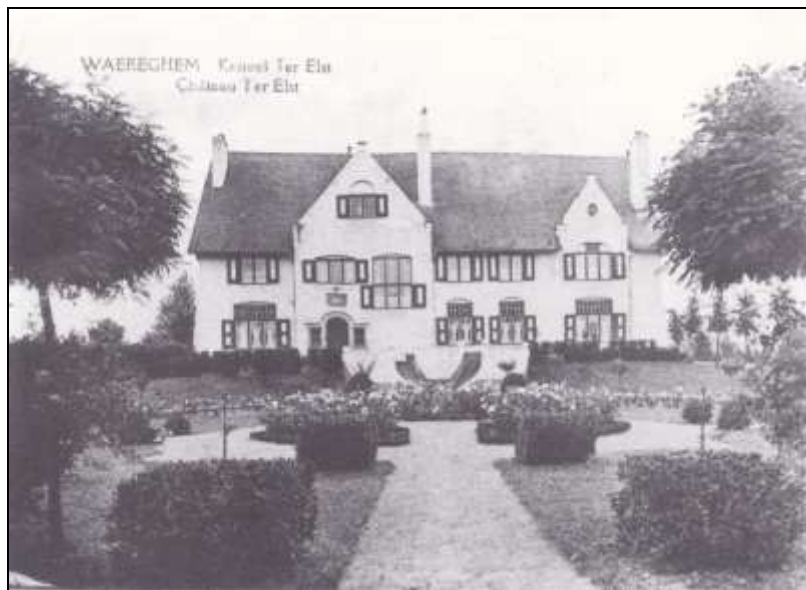
Kasteel ter Elst in het begin van de 20 ste eeuw.

van de Vijfseweg de S.A. de Waereghem op, een grote juteweaverij waar honderden arbeiders werkten. Hij woonde eerst in de Guido Gezellestraat, vervolgens in de Stationsstraat. In 1907 liet hij dit statige landhuis bouwen door architect Viérin uit Kortrijk.