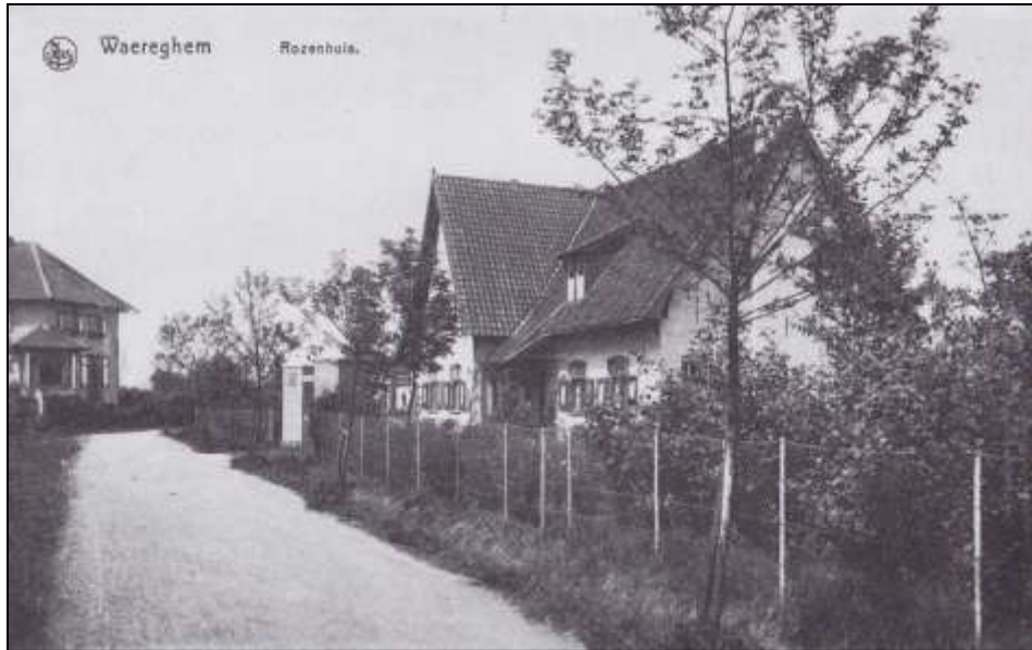
Het Rozenhuis anno 1910, met achteraan Villa 'Nooit Gedacht'

tussen meester en leerlinge. Maar toen ze bemerkten dat dit hen niet ging lukken, wisten ze listig de heer De Zutter argwaan te doen opvatten omtrent zijn vrouw en de jonge kunstenaar. Het geworpen zaadje zou niet nalaten te ontkiemen ..." (100 Waregemnaren)