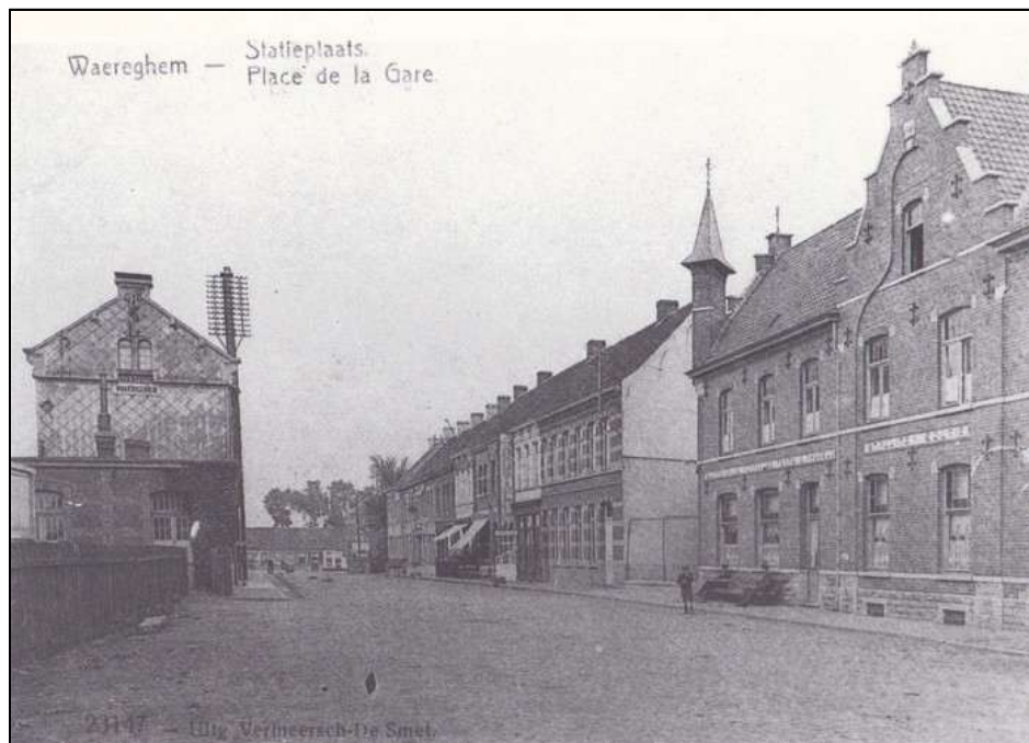
het stationsplein anno 1900, met rechts het pand van zadenhandelaar Devos

We draaien de Westerlaan op naar rechts en komen iets verder terug bij het station. Het huidige stationsgebouw staat iets dichterbij de Holstraat dan het eerste station, zoals te zien is op de onderstaande foto. Waar nu de Aldi-supermarkt ligt, was vroeger de weverij Boone-Debrabandere, gespecialiseerd in witgoed (lakens, zakdoeken, ...). Tegenover het station lag de groothandel in zaden en koloniale waren van de familie Devos, wat te zien is in de faiences boven de ramen. In het statige rode bakstenen pand is nu een zaak in woon- en winkelinrichting gevestigd. Verder richting Stationsstraat had je hotel du Parc , de Post en verschillende cafés: Au Belle Vue , Café du Parc , Café de la Poste , Café de la Station , de Gambrinus en Au Pavillon . Aan de verkeerslichten was het stationsplein afgesloten met een rij huisjes en ... cafés. Die zijn verdwenen bij de doortrekking van de ring.