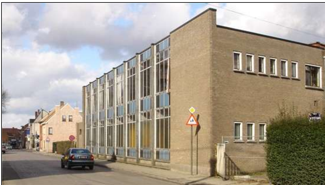
een van de verdwenen bedrijfsgebouwen van weverij Sofinal, in de Westerlaan

Naast de firma Claessens lagen de gebouwen van het bedrijf Sofinal , dat voeringstoffen produceerde en in 2003 failliet ging. Jaren lang stond de site te verkommeren. Vorig jaar werden de gebouwen gesloopt en het terrein geëffend zodat er een enorme lege ruimte verscheen tussen de Molenstraat en de Westerlaan. Hier wordt binnenkort een modern woonproject gerealiseerd, met appartementen en winkels. Daarna zal de hobbelige Molenstraat worden heraangelegd.