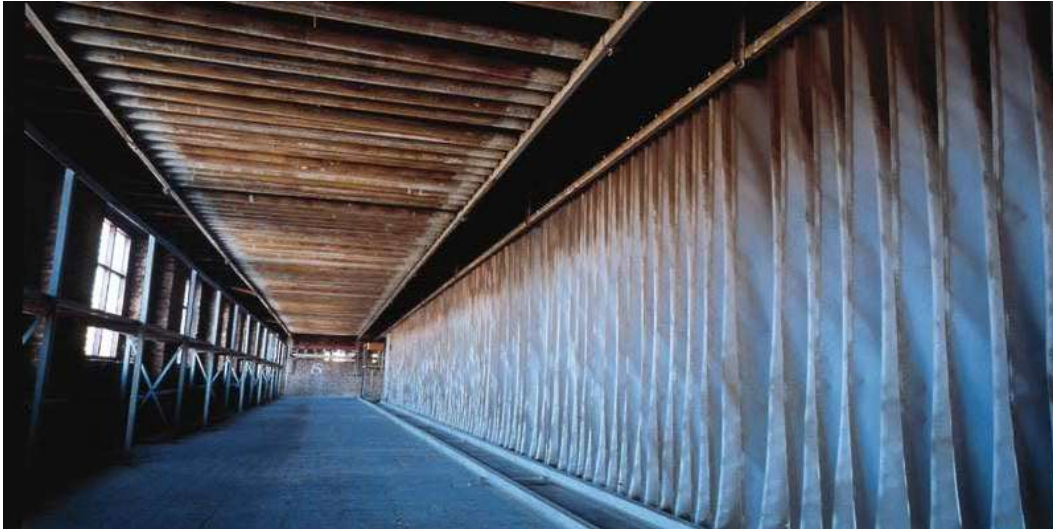
zicht in de droogloodsen van de firma Claessens

Aan het kruispunt draaien we rechts de Processiestraat in, die we volgen tot aan het kruispunt met de Molenstraat. Hier op de hoek stond de 'Plaetse meulen', een houten staakmolen die afbrandde in 1905. We draaien rechts de kasseistraat in en komen een paar honderd meter verder links bij de moderne kantoorgebouwen van de firma Claessens . Achter de kantoren liggen de droogloodsen van het bedrijf, die doorlopen tot aan de Westerlaan. Claessens vervaardigt al meer dan 100 jaar doeken voor kunstschilders. Zware linnen stof (vlas) wordt ingestreken met een grondlaag loodwitverf en te drogen gehangen in de loodsen. Daarna wordt het canvas opgespannen op een houten frame.