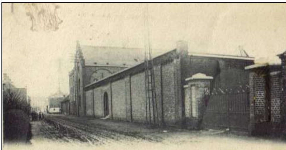
de Olmstraat anno 1900

Aan de overkant van de straat, naast café De Loskaai , was er tot in de jaren '80 een openbare weegbrug. In de bloeitijd van de stationsbuurt werd die gebruikt om de karren met o.a. aardappelen en suikerbieten te wegen vóór de vracht werd overgeladen op goederenwagons.