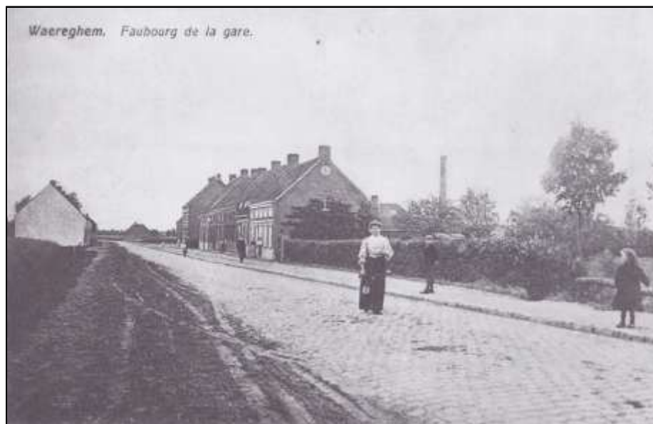
de Vijfseweg rond 1900, vanaf het kruispunt met de ter Elststraat, richting Sint-Eloois-Vijve

Iets verder in de Vijfseweg, richting Sint-Eloois-Vijve, vind je de winkels van de familie Lisarde: rechts de hengel- en siervishandel, verder links de rietwarenwinkel. De winkels bestaan al verschillende generaties en de familienaam inspireerde André Demedts toen hij op zoek was naar een pseudoniem voor zijn jeugdboeken. Hij publiceerde er vier tijdens zijn Waregemse periode, onder de naam 'Koen Lisarde': Ik wil een dappere kerel zijn (1943), Trouw aan hun volk (1944), Alle vreugd is eindeloos (1946) en Vorbij aan de nacht (1952). Het tweede boek vertelt het verhaal van twee tienerjongens die een gevaarlijke opdracht krijgen tijdens de Zuid-Afrikaanse Vrijheidsoorlog (1899 - 1902) tussen de Boeren en de Engelsen (zie verder bij Transvaal ).