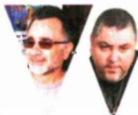
מאמינים. דוכין ואיבגי

המרכז הישראלי לנפגעי כתות: "הטכניקות שמושמות ב'בני ברוך' עשויות להביא לשבי מחשבתי, פיזי ופיננסי, עד כדי ניתוק מהסביבה, חוסר יכולת להשתלב בחברה ובגיעות נפשיות מתמשכות"