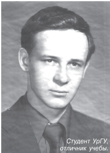
Студент УрГУ, отличник учебы.