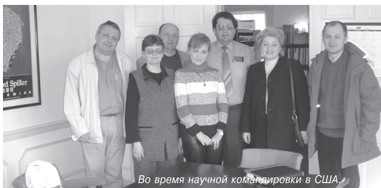
Во время научной командировки в США.