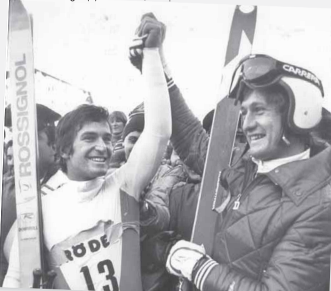
Lieferten sich auf der Saslong unvergessene Duelle: Herbert Plank (links) und Franz Klammer (rechts). Auf diesem Foto hatte Plank die Nase vorne (18. Dezember 1977).