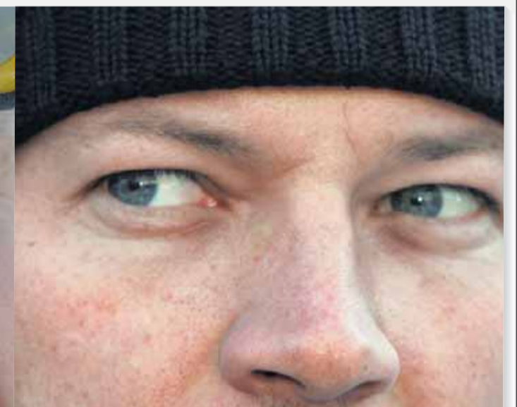
Augenspielereien: Lasse Kjus (links im Bild) hat in Gröden als einer von nur zwei Rennfahrern sowohl die Abfahrt (1998) als auch den Super-G (2003) gewonnen. Hermann Maier (Mitte) stand in Gröden noch nie auf dem obersten Treppchen, während Stephan Eberharter (rechts) die Abfahrt im Dezember 2001 für sich entschied.