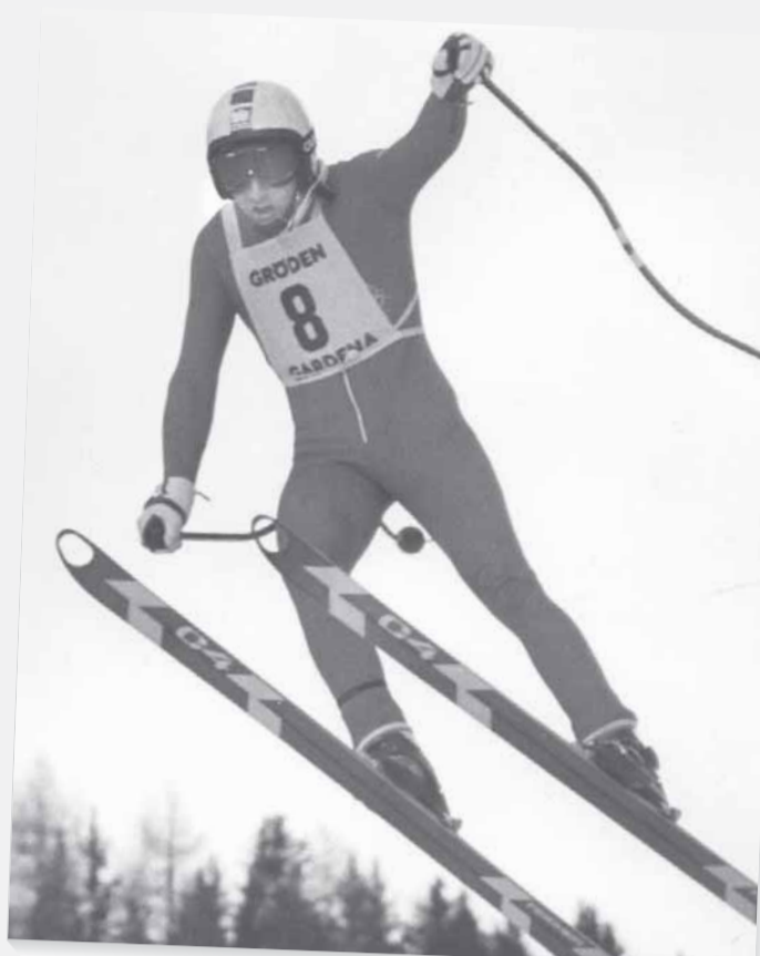
Der Abfahrtskaiser, Franz Klammer, in Aktion. Mit Lochski und gebogenen Abfahrtsstöcken gewann er auf der Saslong vier Mal (1975, 1976 I und II, 1982).