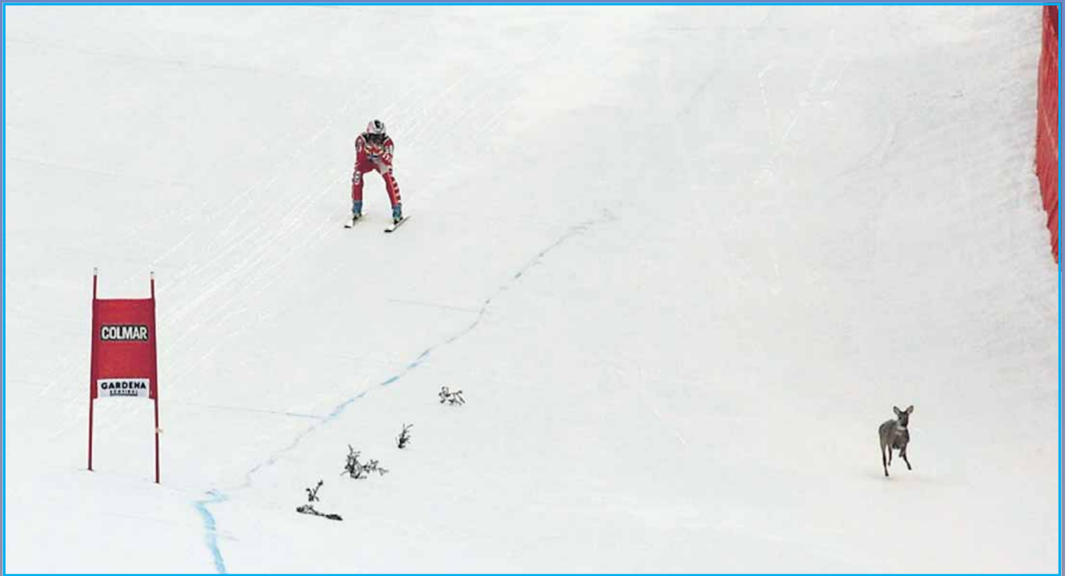
Dieses Foto ging um die Welt. Sogar die Hauptabend-Nachrichten der großen europäischen Sender berichteten über das Reh, das 2005 den Weg von Kristian Ghedina auf der Saslong kreuzte.