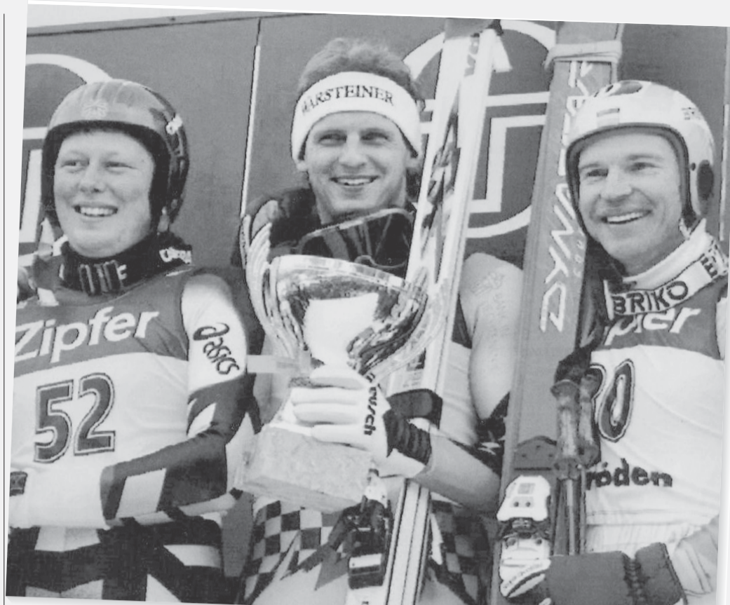
Der Sensationssieger schlechthin in 40 Jahren Skiweltcup in Gröden: Am 17. Dezember 1993 gewann der Liechtensteiner Markus Foser mit der Startnummer 66 vor Werner Franz (links, Startnummer 52) und Marc Girardelli (rechts, Startnummer 30).