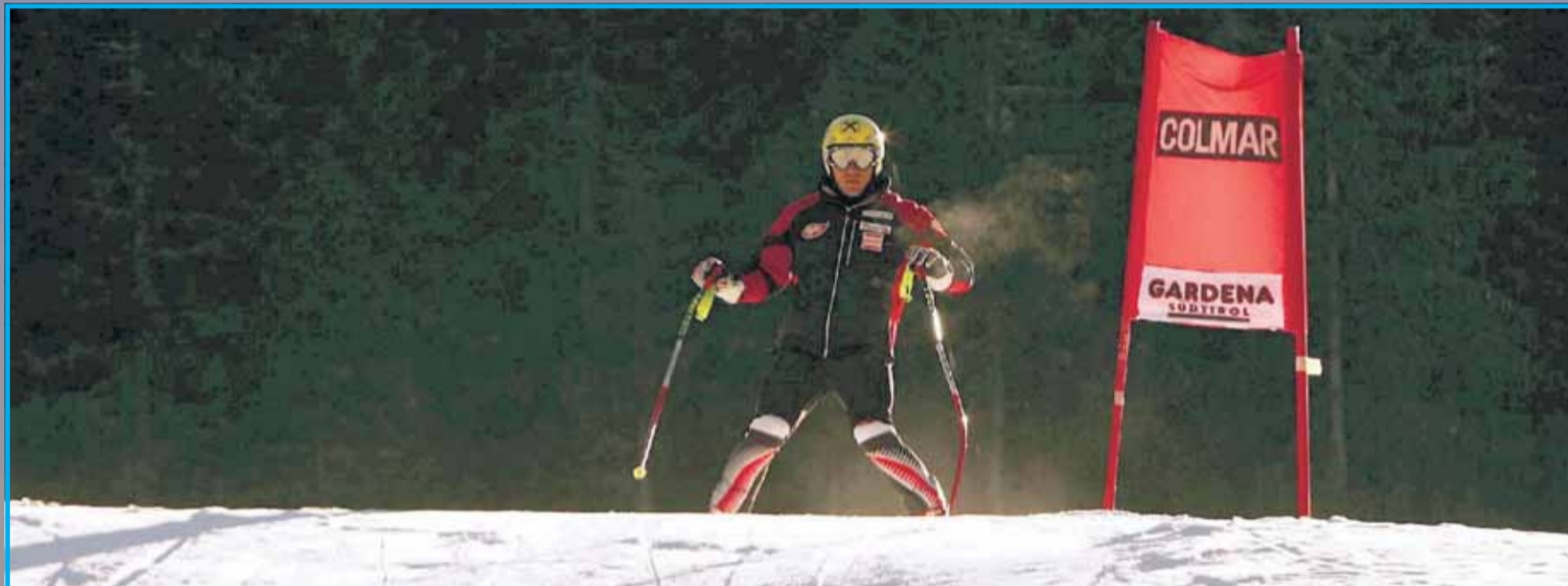
Das ist Hermann Maier bei einer Besichtigung auf der Saslong. Ganz genau hat der „Herminator“ diese Piste nie verstanden, denn gewinnen konnte er in Gröden noch nie. Aber er kommt ja heuer wieder ...