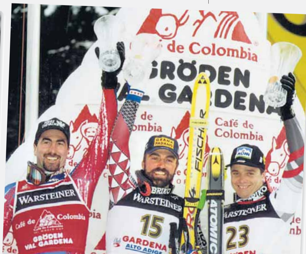
Sieger mit Vollbart: Kristian Ghedina bei seinem ersten der insgesamt vier Siege auf der Saslong am 21. Dezember 1996, mit Luc Alphand (links) und Josef Pepi Strobl (rechts).