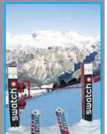
Das ist der (herrliche) Ausblick, den die Läufer am Start haben.