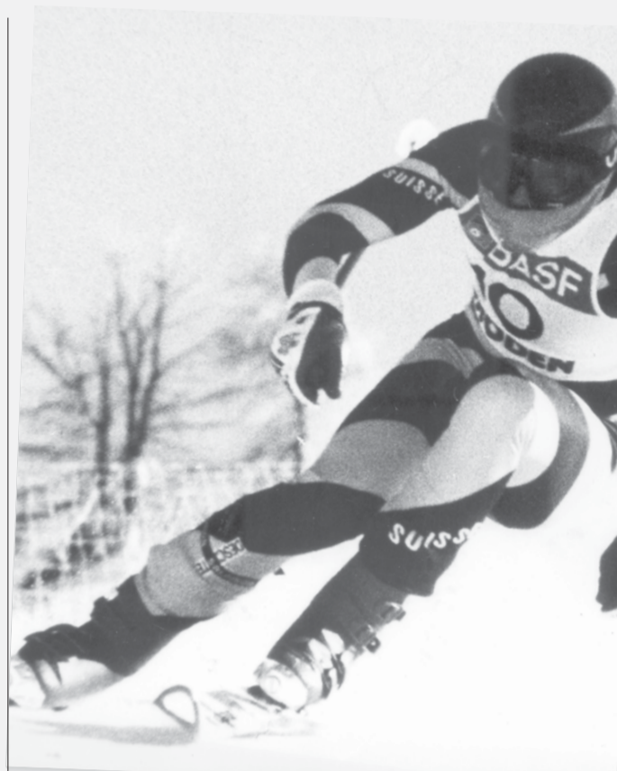
Der erste Weltcup-Super-G auf der Saslong wurde am 19. Dezember 1983 ausgetragen. Im Bild Sieger Pirmin Zurbriggen auf seiner Siegesfahrt.