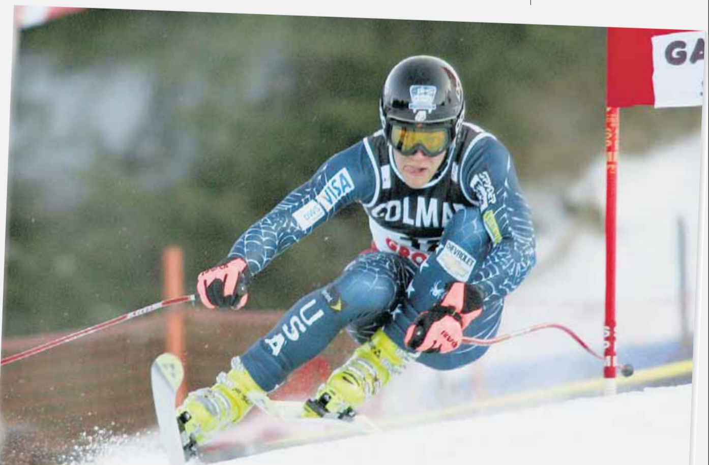
Steven Nyman aus den USA, Sieger der letztjährigen Abfahrt.