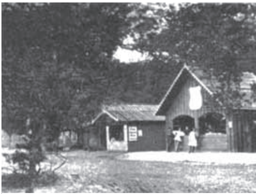
Boder ved Karupvejen

Hver søndag formiddag blev der afholdt gudstjeneste. I det første lejrår var man noget uheldig med formen for gudstjenesten, idet halvdelen af lejrstyrken beordredes til at deltage, iført fuld feltmæssig påklædning. Med et musikkorps i spidsen, fulgt af divisionsgeneralen med stab, marcherede soldaterne ad Non Mølle til, hvor en prædikestol var rejst på en markskråning, og med "gevær ved fod" og i stegende solvarme hørte man da på prædikenen. Senere rejstes prædikestolen på en skyggefuld plads i egeskoven, ved foden af Ørnebjerg (bag "Niels Bugges Hotel"), og deltagelsen blev frivillig. Kun musik-korpsset, der blæste salmemelodierne, og de tilsynshavende befalingsmænd var udkom-