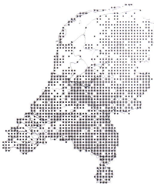
Verspreiding 1990-1997 (cirkel), 1998-2007 (stip). Distribution 1990-1997 (circle), 1998-2007 (dot).

De Grote keizerlibel was in de eerste helft van de vorige eeuw een schaarse soort die tot het zuiden van Nederland beperkt was. In de tweede helft van die eeuw is de soort sterk toegenomen en ze behoort nu tot de algemeenste libellen van Nederland. De noordgrens van het areaal ligt in Denemarken en ook in Nederland is te zien dat de soort in het noorden schaarser is. In Friesland, Drenthe en Groningen heeft de soort zich sinds 1997 verder uitgebreid. Dit komt deels door de toegenomen inventarisatie-inspanning maar zal ongetwijfeld ook komen door de hogere temperaturen van afgelopen jaren.