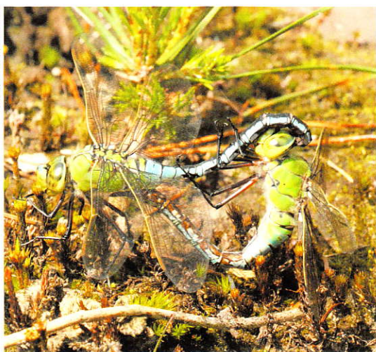
Paringswiel van de Keizerlibel Anax imperator .