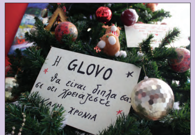
Μια υπόσχεση βοήθειας και προσφοράς