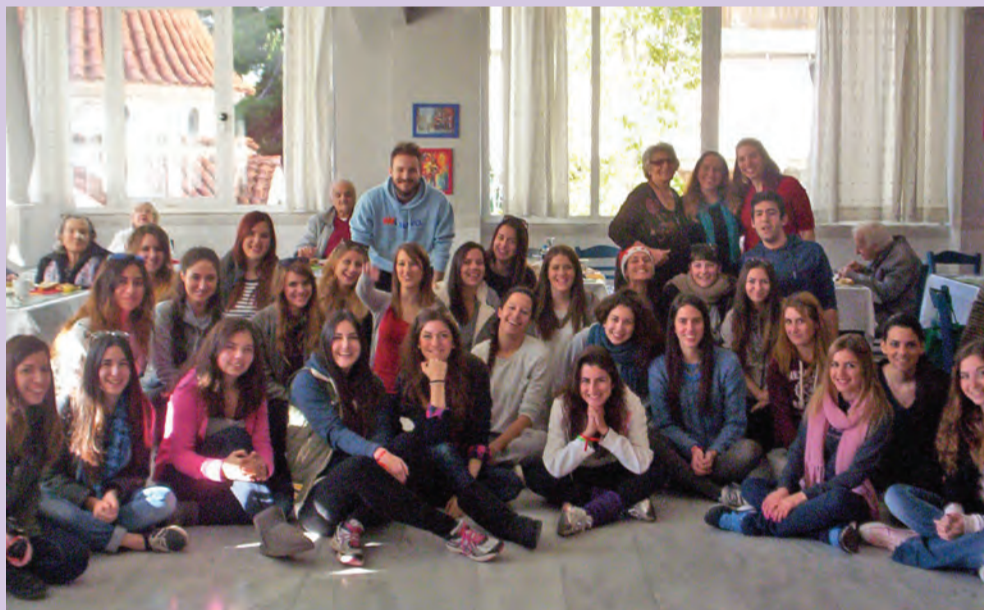
Η GloVo στην ΚΜΜ!