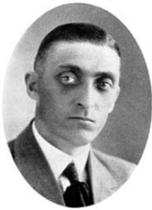
Den socialdemokratiska politikern och tidningsmannen Elon Dufvenberg. Ur Västerbottens län i porträtt och bild (1929).

FOTO: KRISTER HÄGGLUND/ SKELLEFTEÅ MUSEUM