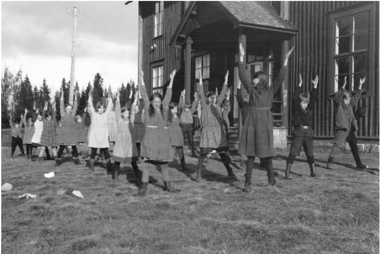
Klasserna 3–6 gymnastiserar uthomhus vid skolan i Bäcksjö, Vilhelmina. Foto 1928.