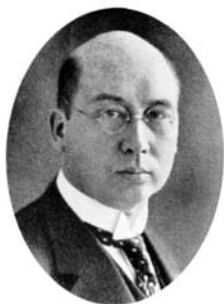
Advokat Sven Hallström från Umeå var en av förgrundsfigurerna i den nationalsocialistiska rörelsen i Västerbotten. Ur Västerbottens län i porträtt och bild (1929).

FOTO: KRISTER HÄGGLUND/ SKELLEFTEÅ MUSEUM