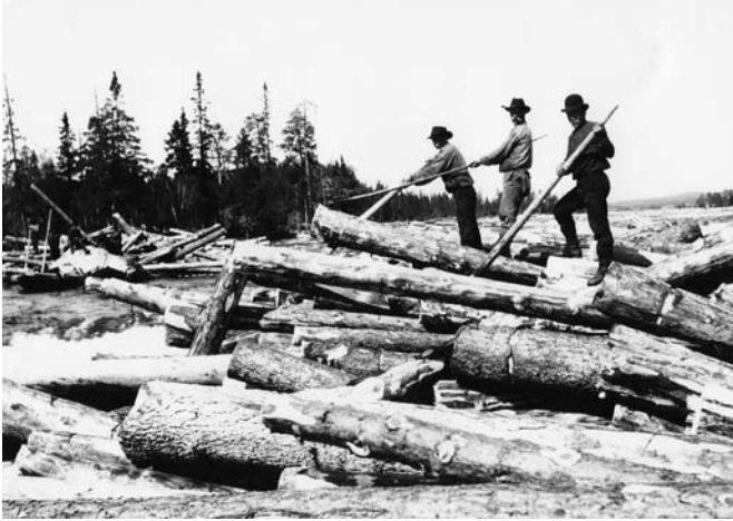
Några flottningsarbetare söker lossa på en bröt som bildats i Karlskronaforsen i Umeälven strax söder om Stensele.

med timpenning. Det talades om ersättningar på ned till tre kronor per dag för oorganiserade skogshuggare och en femma för köraren, mannen med hästen. Talet om svältlöner var liksom inte gripet ur luften!