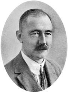
En av företrädarna för det radikala västerbottniska frisinnnet, Anton Wikström. Ur Västerbottens län i porträtt och bild (1929).