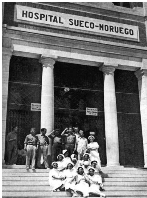
Insamlingar i Sverige och Norge bekostade ett gemensamt fältsjukhus i Alcoy.