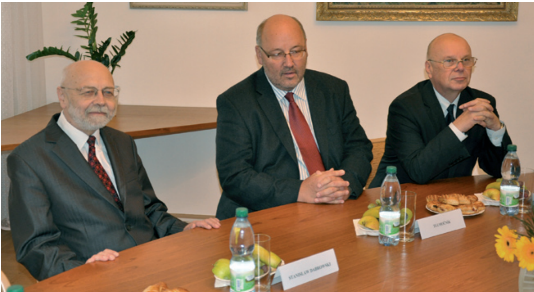
Návštěva předsedy Nejvyššího soudu Polské republiky Stanisława Dąbrowského u Nejvyššího soudu, 13. 9. 2012