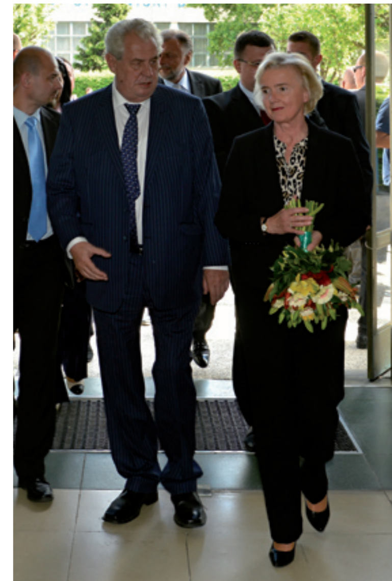
Návštěva prezidenta republiky pana Miloše Zemana u Nejvyššího soudu, 21. 5. 2013