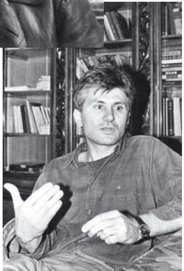
1988. godina.

Mi smo veoma aktivan narod, individualistički, radoznao, veoma kompetitivan. Sve su to osobine koje su veoma zapadne. Mi, međutim, nismo samo evropski narod, imamo u sebi elemente i Istoka i Zapada. Sada od rukovodstva zavisi koju će stranu podržati.