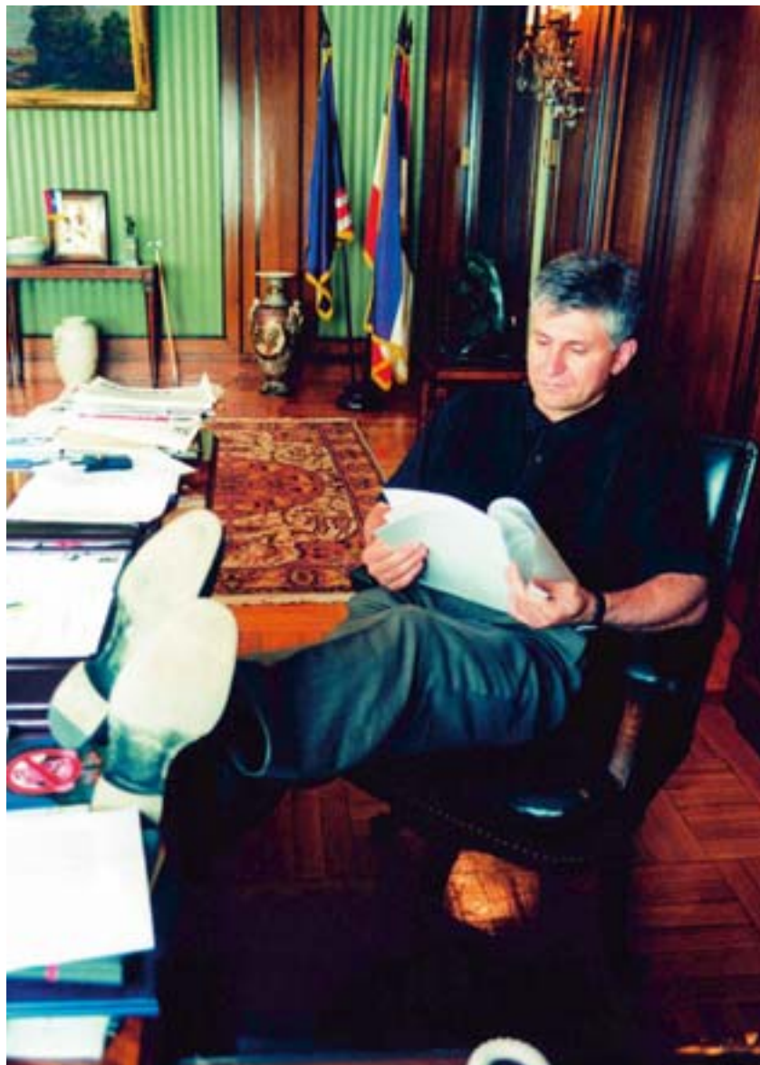
Zoran Đinđić, gradonačelnik Beograda, 1997.