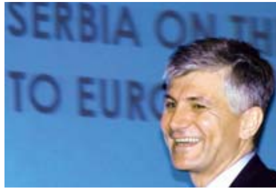
gore: pred sednicu Vlade Srbije, avgust 2001.