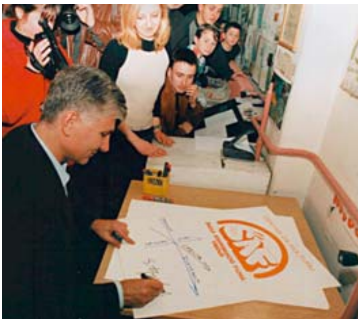
Vranje, novembar 2002.