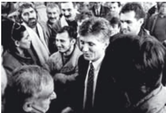
kampanja "Pošteno", 1993.