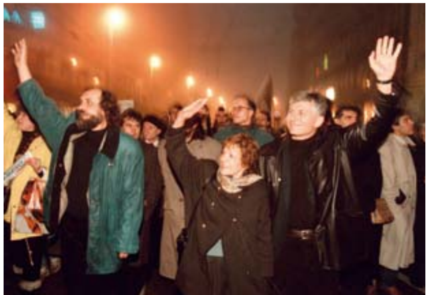
novembar 1996.