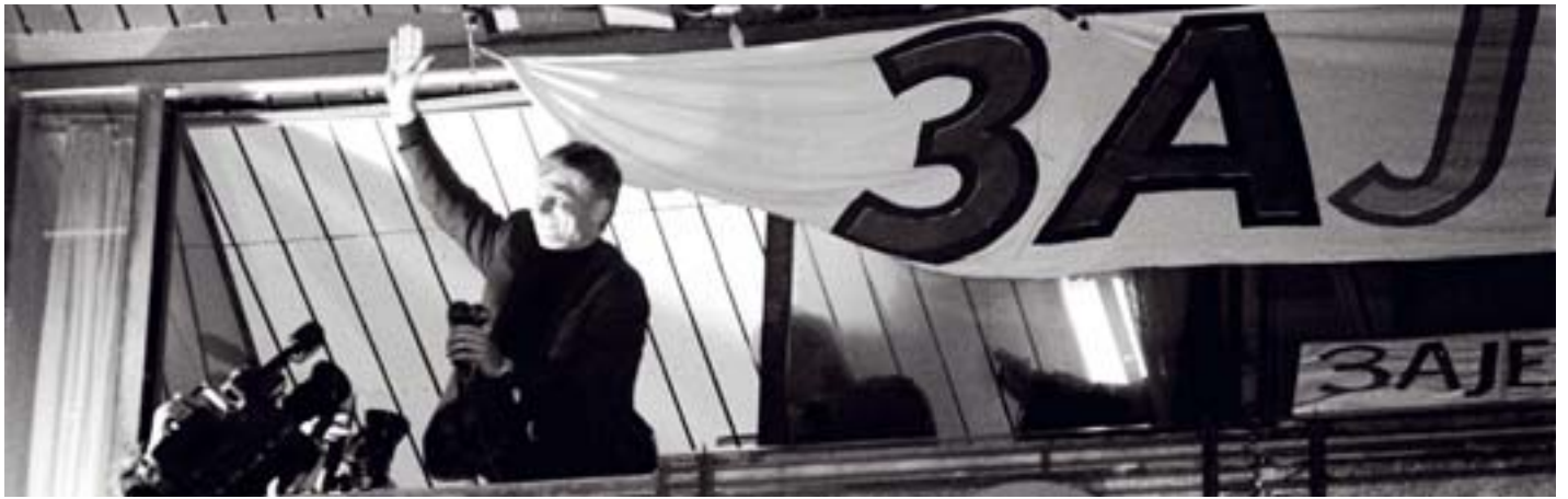
prostorije Demokratske stranke na Terazijama, novembar 1996.

Moja ambicija je zadovoljena činjenicom da sam 5. oktobra video leđa Miloševiću. Ja sam sve svoje političke ciljeve ostvario. Možda je prethodnih deset godina dovelo do toga da su oni postali skromniji nego što su bili 1990. godine, kad sam želeo da budem čovek koji će uvesti Srbiju u Evropsku uniju. Da li sada to mogu da sanjam, nisam siguran. Borba sa Miloševićem je bila gerila. Sada počinje ozbiljna politika i ne bih voleo da budem viđen kao neko ko je bio dobar za politiku po neregularnim uslovima, a kada je došla politika po evropskim uslovima, onda nije sposoban. Ali, ako ljudi misle da Srbija ne treba da ide tim tempom, ja neću biti ni ljut, ni uvređen i biću u istoriji Srbije premijer koga će biti najlakše smeniti.