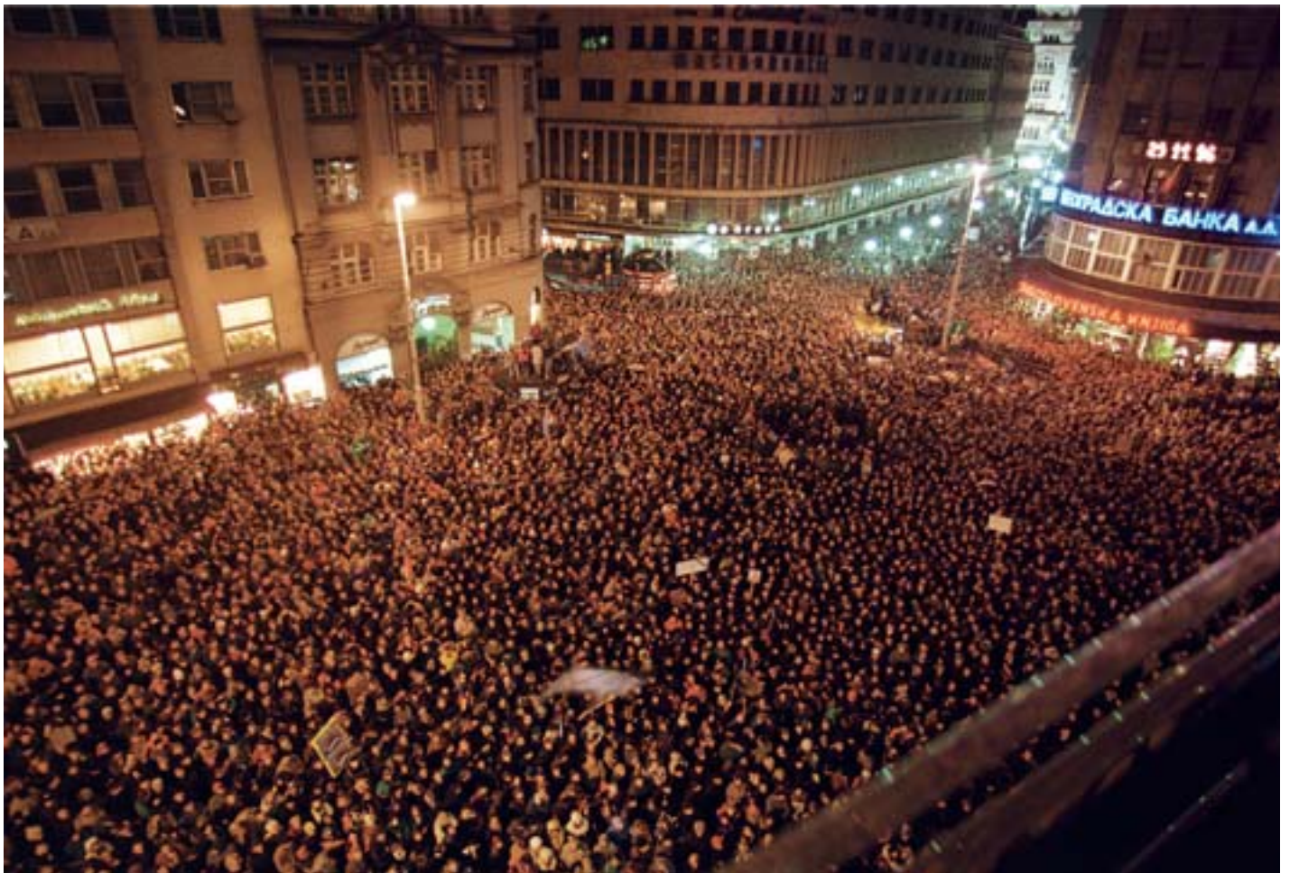
Terazije, novembar 1996.

Ovo jeste referendum između slobode i ropstva, o činjenici da je ovde reč o klasnom društvu u kojem manjina ima superioran položaj nad većinom i gde će samo manjina biti slobodna i diktirati nam ideologiju. Mi mislimo da je red da većina u ovoj zemlji ipak bude slobodna. I zbog toga to jeste referendum i o slobodi, i o patriotizmu, i o budućnosti, dakle o životnim stvarima, a ne o metafizičkim opsenama. Sreća je da se većina sa tih ideoloških, metafizičkih oblaka spustila na zemlju, a to je ono što nam daje podršku i nadu, a sablažnjava režim čije manipulacije više ne prolaze i zato postaje sve grublji u sili i represiji.