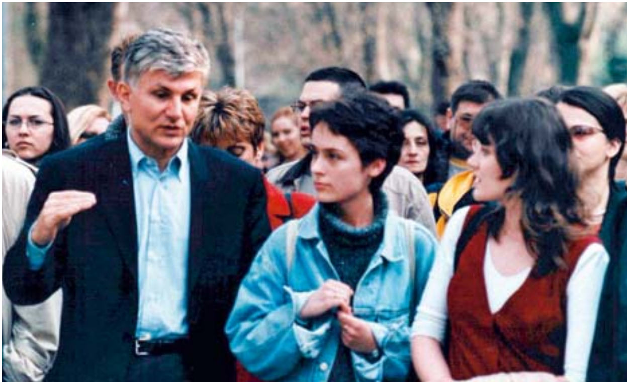
"Srbija na dobrom putu", Sombor, mart 2002.

Imam primere da neko drugi putem dobre organizacije i dobre volje može od iste pozicije u kojoj smo bili mi, veoma brzo da napreduje. Znači, nije nekakvo čudo ako i mi to uspemo, ali treba da se borimo i treba da verujemo u svoju pobjedu i treba da gledamo napred ka cilju, a ne kao sada da svaki klinac gleda drugoga, da li ima bolje patike nego ja i da li da mu dodam loptu, jer ćeš ti da budeš taj koji je postigao koš, a ja ne volim da ti postigneš koš, nego mi smo tim koji treba da igra i treba da pobjedi. Mislim da to nama nedostaje.