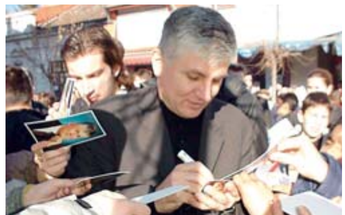
gore desno: sa učenicima u IS Petnica, mart 2002.