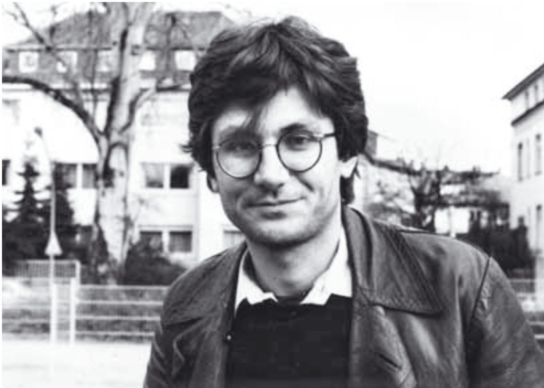
gore: iz studentskih dana u Nemačkoj

Uđimo u svaku utakmicu sa željom da poredimo. Da li ćemo porediti ili nećemo, to zavisi od našeg protivnika i od malo sreće. Ono što sam siguran: ako ne uđemo sa željom da poredimo, nećemo porediti, sasvim sigurno. Ako uđemo sa željom da poredimo, onda ćemo možda porediti. Nema garancije ni za to.