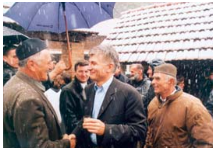
gore: selo Prilike na Zlatiboru, februar 2002.