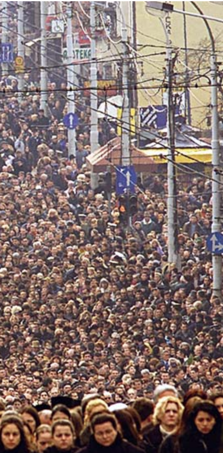
na ostalim fotografijama: oproštaj od ubijenog premijera Zorana Đinđića