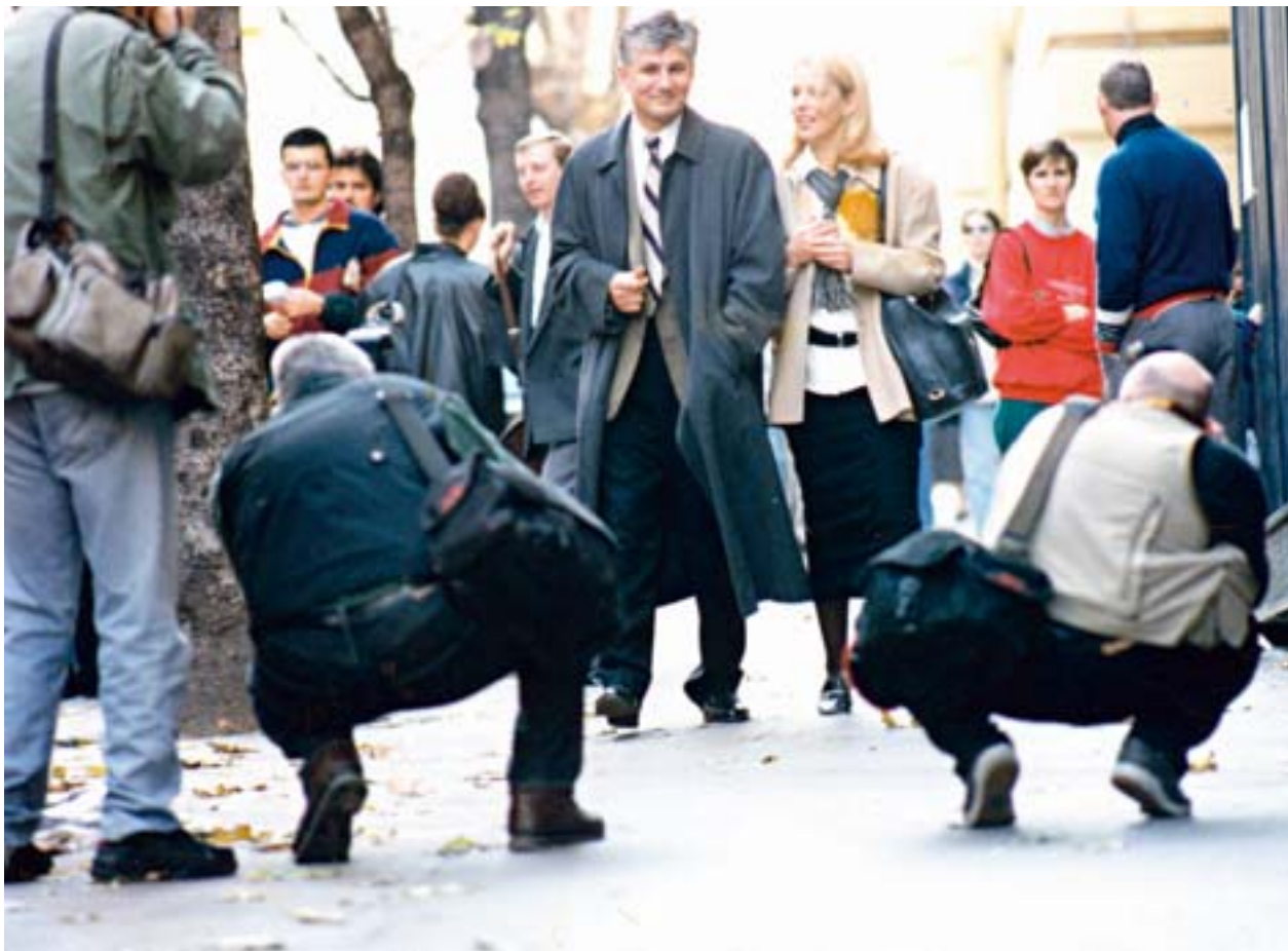
fotografije iz porodičnog albuma

Ja sam javna ličnost i svako ima pravo da o javnim ličnostima priča šta god hoće, ali to ne obavezuje javno da se ljudi time bave. Znači, ja sam neka vrsta gromobrana i svako ko ima neki višak svoje energije, usmeri je na taj gromobran i svaki oblak koji protutnji, on malo nešto okrzne taj gromobran i misli da će svaki gromobran biti o njemu.