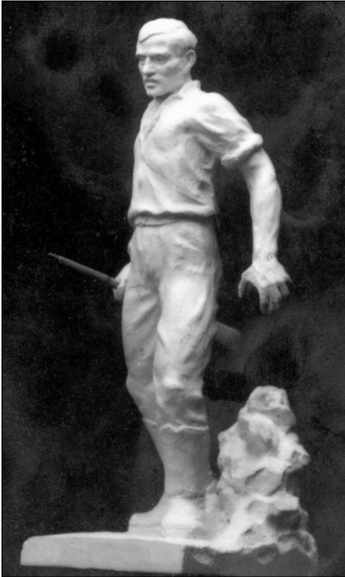
A rudabányai I. világháborús bányász hősi emlékmű gipszintája.