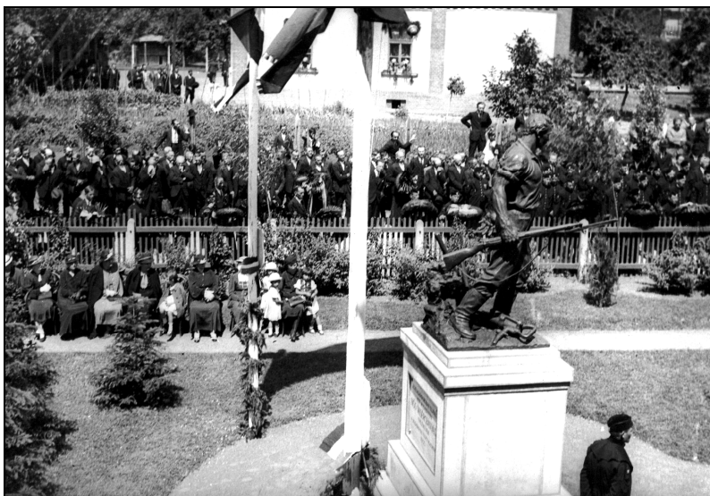
Pillanatkép az emlékmű leleplezési ünnepségéről. A kerítésen belül a hadiözvegyek és hozzátartozóik ülnek.(A fotó az iskola ablakából készült.)

A kész szobor és a gipszminta között néhány lényeges különbséget figyelhetünk meg (az utóbbiról még hiányoznak a bányászszerszámok, felsőtteste erőtlenebb, csizmája, fegyvere és arca is eltérő). Ebben nyilván szerepe volt a modellt álló bányásznak, valamint a megrendelőt képviselő bányaigazgatónak, aki észrevételeivel, kívánalmaival bizonyára befolyást gyakorolt az alkotóra. Feltehetően a bányászszerszámok is a helybeliek kérésére kerültek fel az emlékműre, egyértelműen utalva a szoboralak foglalkozására (az eredeti gipszmintából ugyanis ez nem igazán tűnik ki).