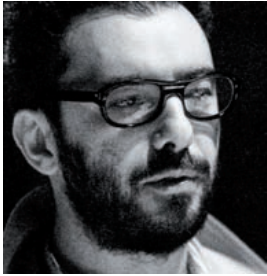
Michaël R. Roskam