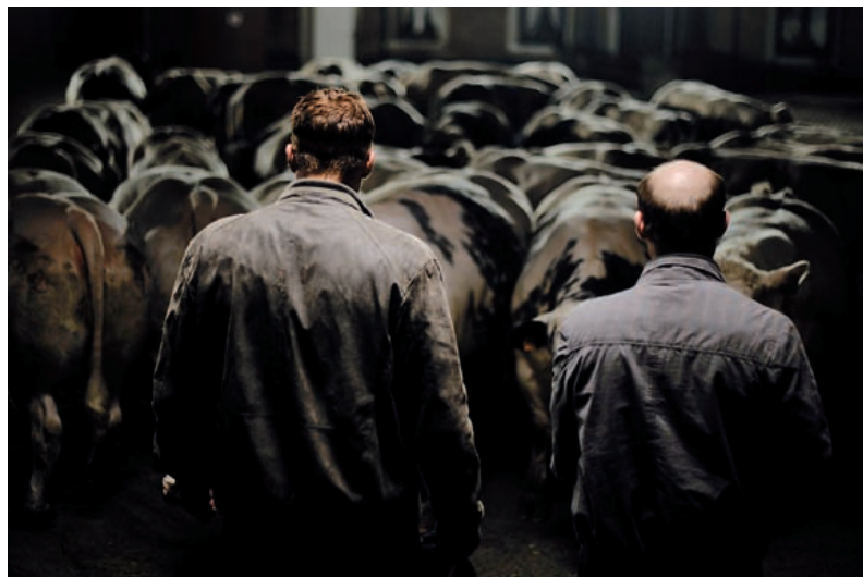
Matthias Schoenaerts, Jeroen Perceval