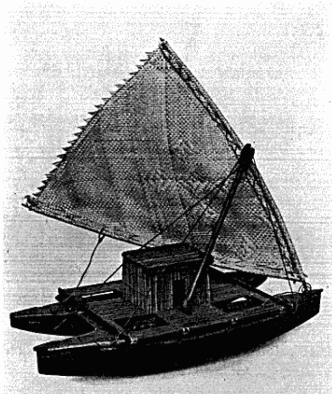
Fig. 5. Model af dobbeltbåd fra Tonga, skænket af H. M. Dronning Salote.

Som en efterslæt fra „Galathea“-ekspeditionen har museet haft den glæde gennem H. K. H. Prins Axel at modtage en smukt udført model af en dobbeltkano fra dronning Salote af Tonga (fig. 5). Dette vidnesbyrd om kongelig interesse må så meget mere påskønnes, som samlingerne fra Polynesien i almindelighed og fra Tonga