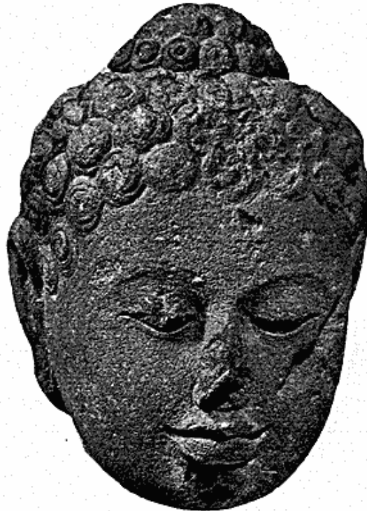
Fig. 1. Buddha-hoved fra slutningen af 8. årh. e. Chr. Borobudur, Java. (Gave fra Ny Carlsbergfondet).

Som før nævnt har H. K. H. Prins Peter med vanlig interesse og sagkundskab fortsat sine indkøb af tibetanske sager i Kalimpong,