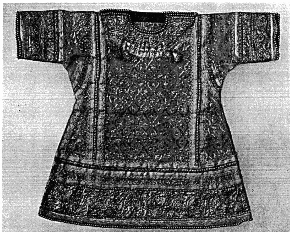
Fig. 3. Guldbroderet barnedragt fra Madras, Indien.

rejst over en buddhistisk relikvie, der er opført i sidste halvdel af det 8. århundrede e. Chr. og nu, skønt en ruin, udgør Javas største og skønneste mindesmærke fra den tid, da hinduisme og buddhisme satte deres præg på øen. De to andre stykker stammer ligeledes fra Javas middelalder, nemlig et par relieffer fra Prambanam, der var de hindu-javanske kongers residens 860—915 e. Chr. Alle tre kunst-