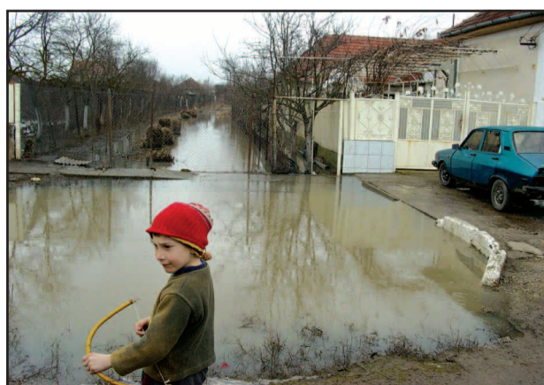
Az eldugult gyűjtőkanálisból a víz néhol csak az udvarba, másutt a házba is befolyt

színre és pumpákkal is közbelépett, segítséget nyújtott nekik a polgármesteri hivatal