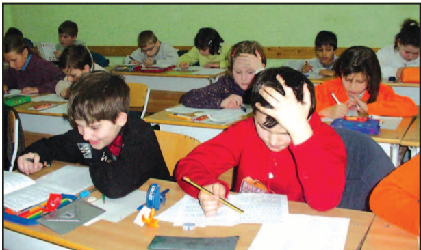
Van, aki a fejét fogja, van, aki mosolyog. A matematika már ilyen...