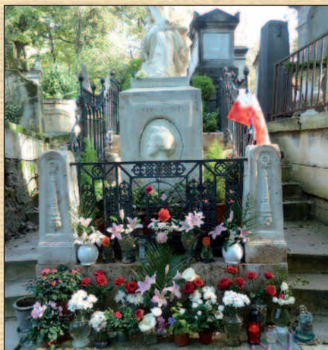
Komponist Frederic Chopin.

Det mest slående var størrelsen på gravmonumentene. Her var det ikke spart på noe, de døde skulle æres med store gravstøtter, ja noen var nesten formet som hus eller tårn. Dessuten virket det ikke veldig ryddig. Vedlikeholdet varierte stort fra det meget velholdte til forfall.