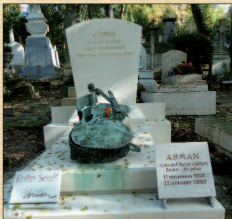
Maler og skulptør Armand Pierre Arman.

For en tid tilbake på tur til Paris, hadde jeg opplevelsen av å vandre rundt på en av byens store kirkegårder, «Père Lachaise». Det tok sin tid å komme rundt. Mange kjente personer er gravlagt på denne kirkegården, blant andre Georges Bizet, fransk komponist, Frédéric Chopin, polsk-fransk komponist, Molière, fransk forfatter, Édith Piaf, fransk sanger og Oscar Wilde, irsk forfatter. Sannelig finnes også en dansk-norsk billedhugger, Stephan Sinding.