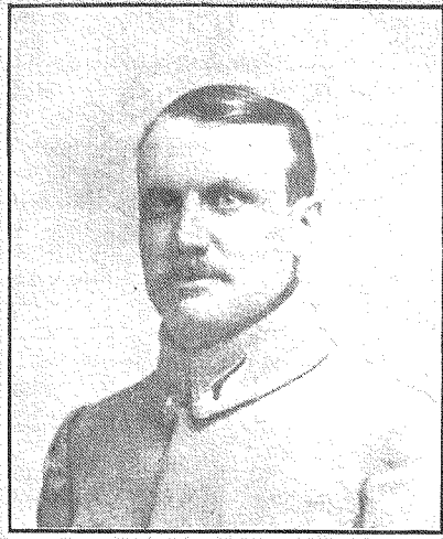
dams vairākas ienaidnieka lidmašīnas un izpelnidamies oficiālas atzinības.