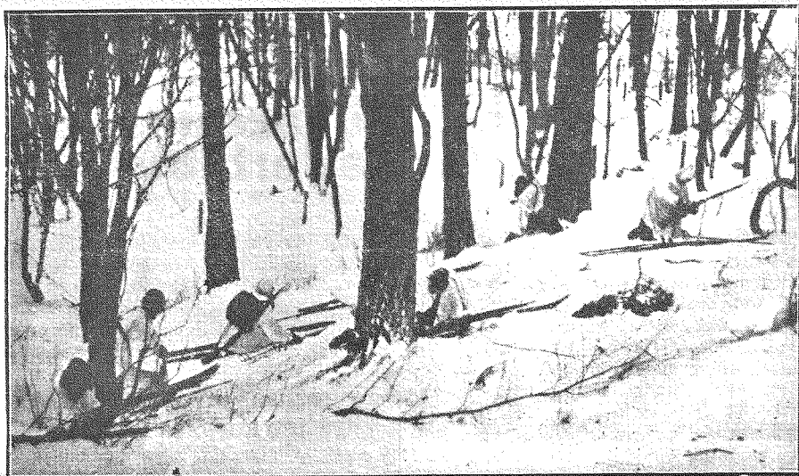
Somu karavīru-slēpotāju patruļa aizsegā sagatavoja iziešanu no meža.

Angļu aviācijas ministrija ziņoja, ka ceturtdienas un piektdienas naktī angļu lidmašīnas izdarījušas vairākus izlūkošanas lidojumus virs Ziemeļrietumvācijas.