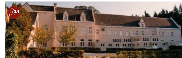
Een uitgave van de vzw Vrienden van het Sint-Jansbergklooster

Tijdens de Franse revolutie werd het klooster afgeschaft en, in 1798, verkocht. De inboedel werd te gelde gemaakt, de kerk afgebroken en steen per steen verkocht. De rijke kloosterbibliotheek was al overgebracht naar Maastricht en verdween in de Cartoucherie als hulzen voor Franse gewerkskogels... In de 19 de eeuw werd het klooster omgebouwd tot kasteel met lushof. Aan de Eupense familie Fischbach de Malacord danken we het park met de prachtige bomen. Vandaag is het hele domein geklasseerd als landschapsmonument. Na wereldoorlog I werd het korte tijd een vakschool, later werd het bewoond door de Dominicanessen en sinds 1993 is Sint-Jansberg een centrum voor seminaries, feesten en evenementen. Je kan het elke zondag vrij bezoeken.