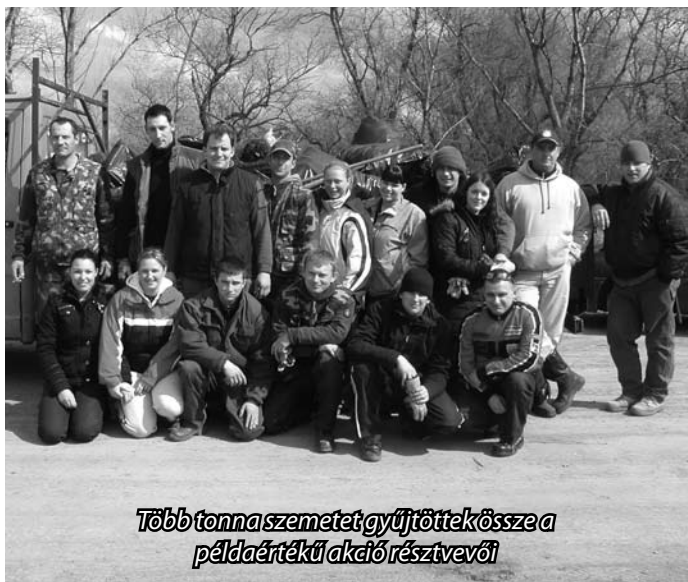
Több tonna szemetet gyűjtöttek össze a példaértékű akció résztvevői