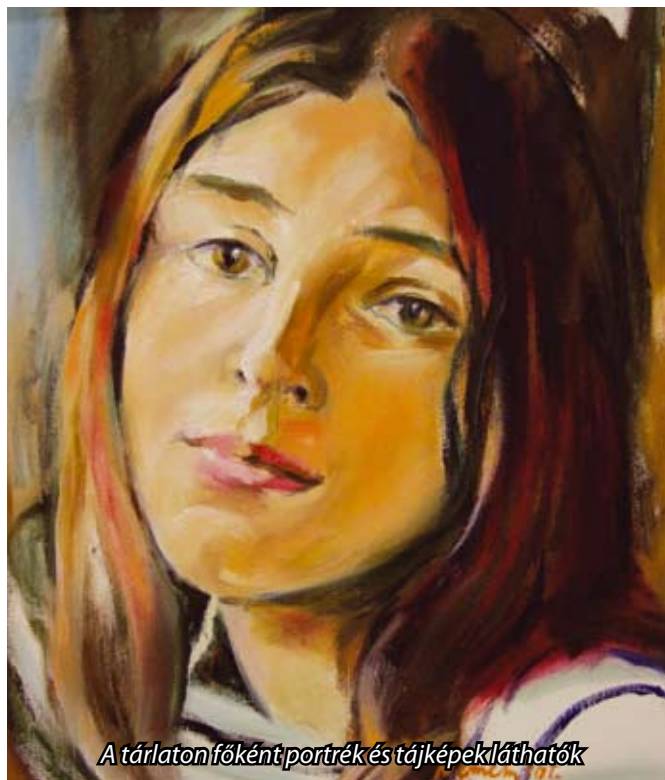
A tárlaton főként portrék és tájképek láthatók