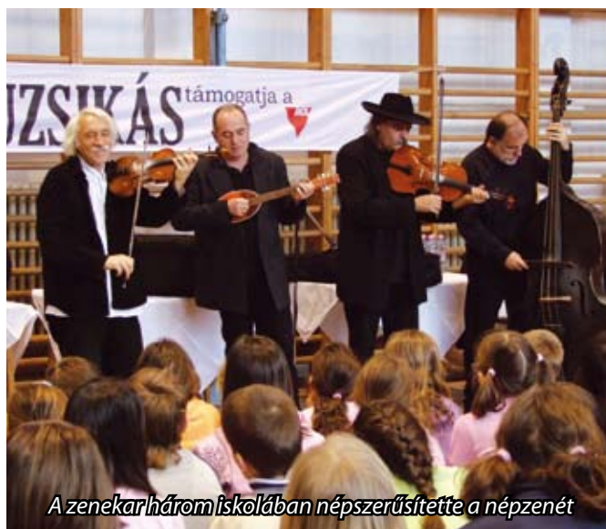
A zenekar három iskolában népszerűsítette a népzenei