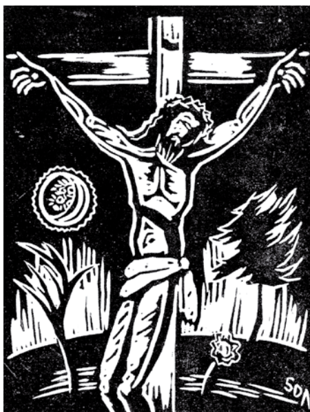
Krisztuskereszt az erdőn Sorki Dala Andor munkája

Elment, a kaput bezárta, Beköltözött a hallgatásba. Kérlek Barátom, most ne legyints, Árvábbak lettünk megtint.