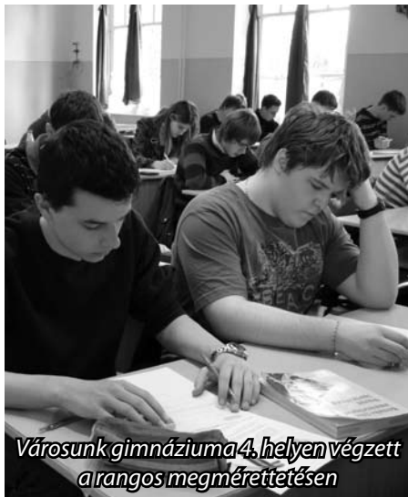
Városunk gimnáziuma 4. helyen végzett a rangos megmérettetésen