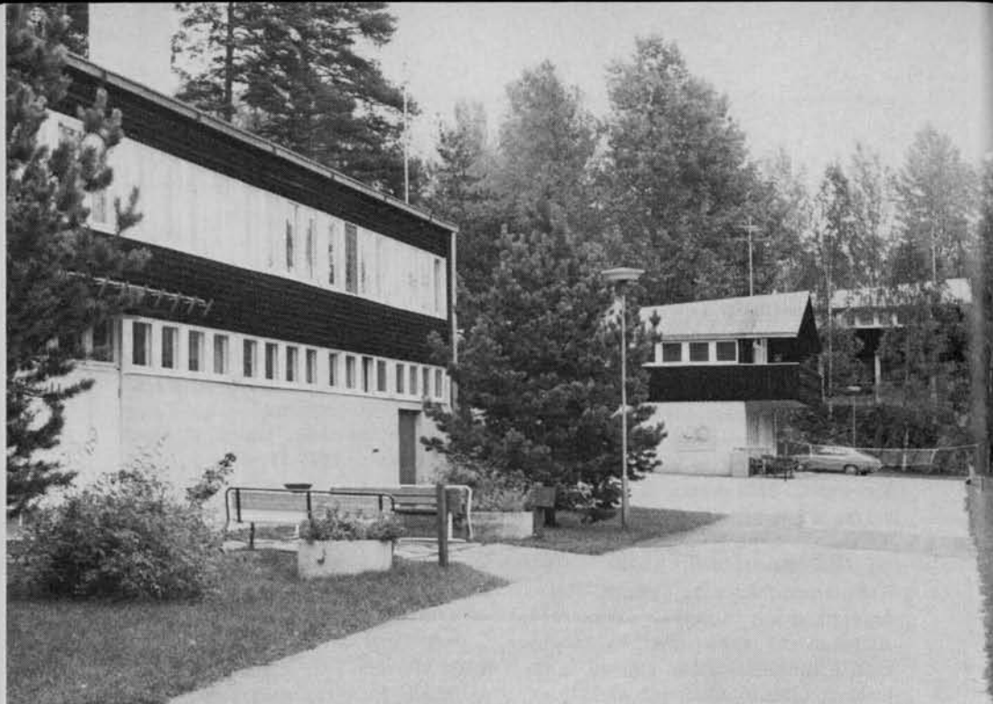
TUL:n urheiluopisto Kisakeskus täytti 20 vuotta. Kisakeskuksesta on muodostunut TUL:n koulutuksellinen keskuspaikka, joka on tarjonnut hyvän ympäristön niin ohjaajien, valmentajien, urheilijoiden kuin nuorten kouluttamiselle.

ja 475 miestä, yhteensä 795. Kurssivuorokausia kertyi 1.089 (572).