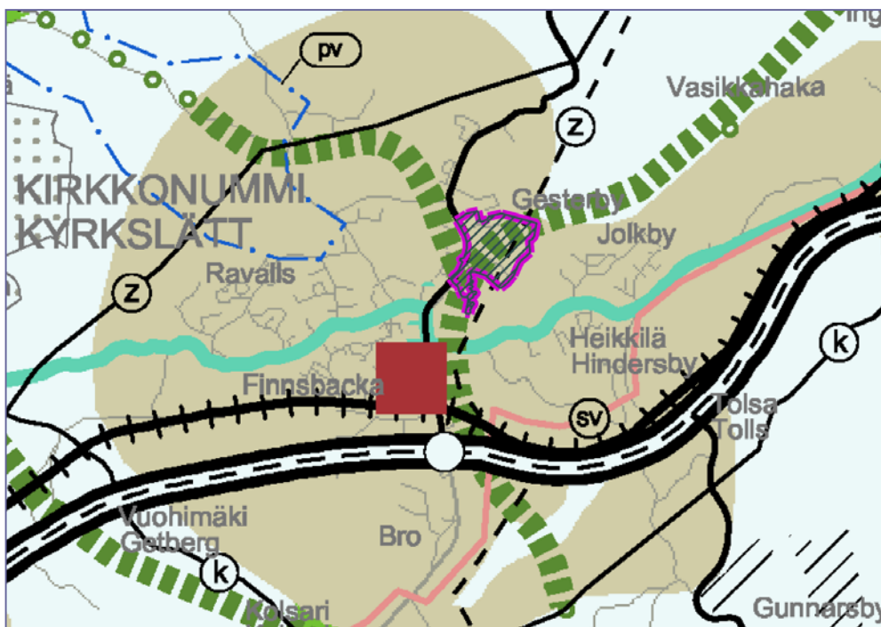
Kuva 2. Ote Uudenmaan maakuntakaavasta.